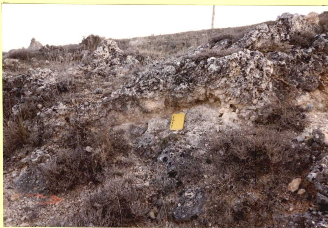
F9109. Dolomías brechoides del Santiense (12) en el corte de la foto 9107.