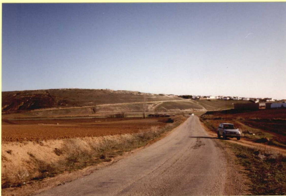
F9114. Mesa de Tresjuncos. De muro a techo, arcillas y limos rojos (29), arcillas y margas (31) y calizas y calizas y margas (32) de la Unidad del Páramo.