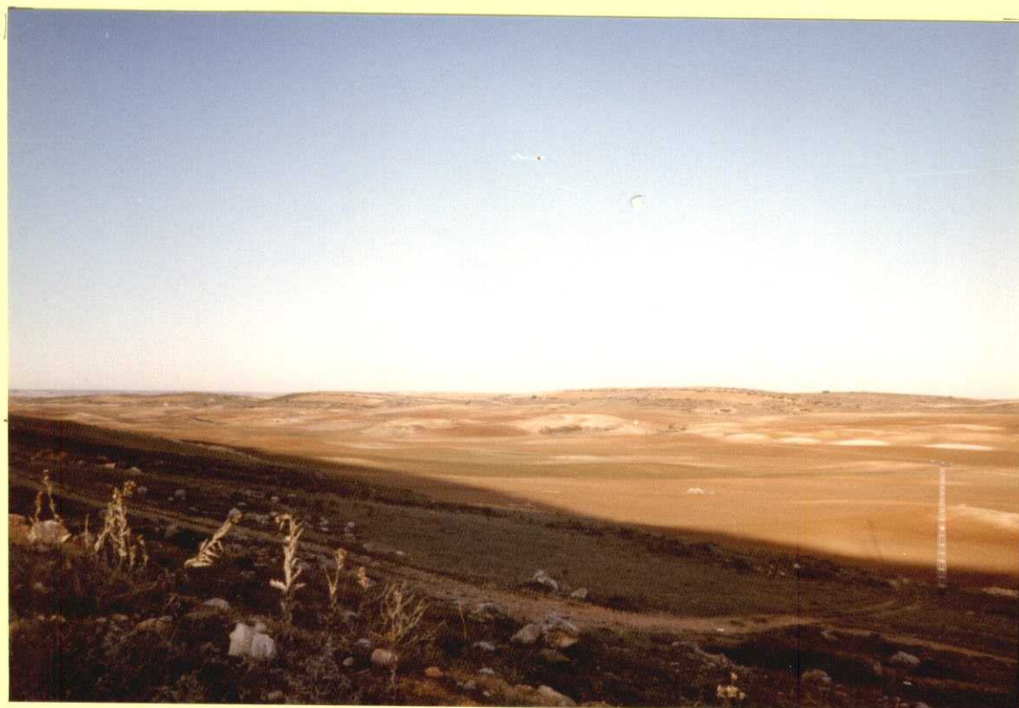
F9110. Panorámica de la serie terciaria al este de Almonacid. El núcleo del valle está ocupado por las arcillas y yesos de la unidad 14; encima, blanquea la serie detrítica de la Unidad Paleógena y sobre ésta reposan discordantes las margas y calizas de la Unidad Paleógena-Neógena (Subunidad Inferior).