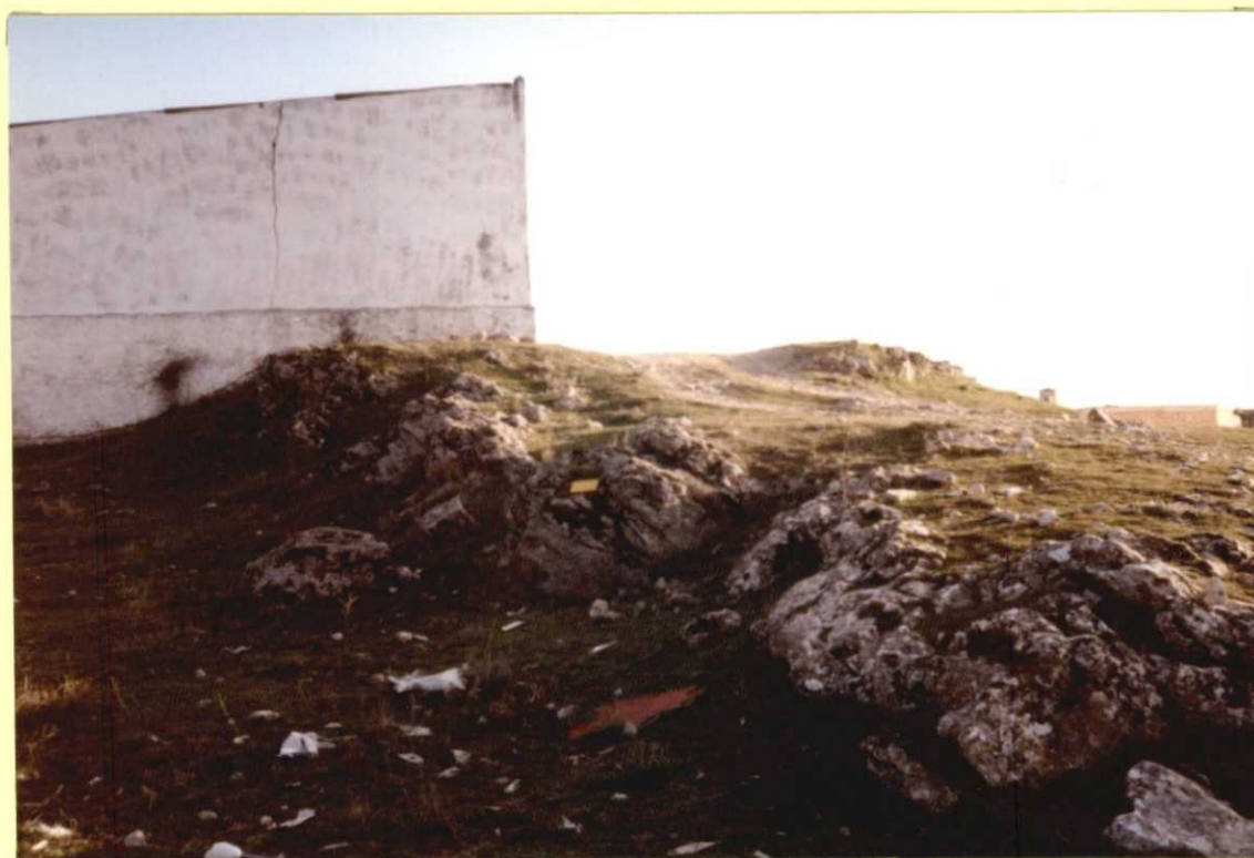
F9106. Dolomías del Turoniense (10) en Almonacid del Marquesado.