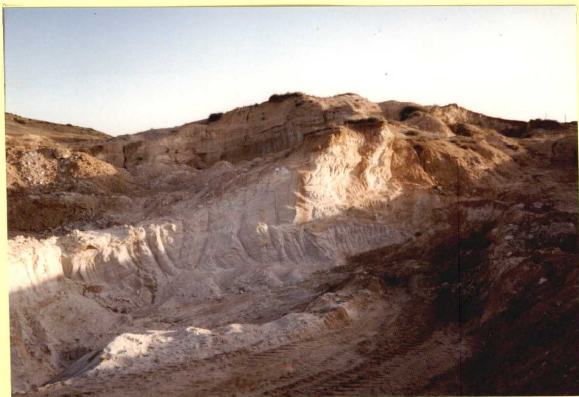
F9111. Canales (15) de la Unidad Palógena.