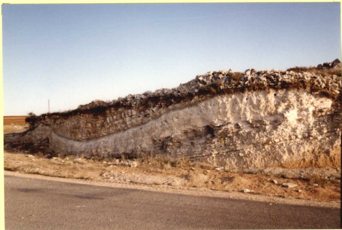
F9112. Calizas y margas de la Subunidad Inferior de la Unidad Paleógena-Neógena.