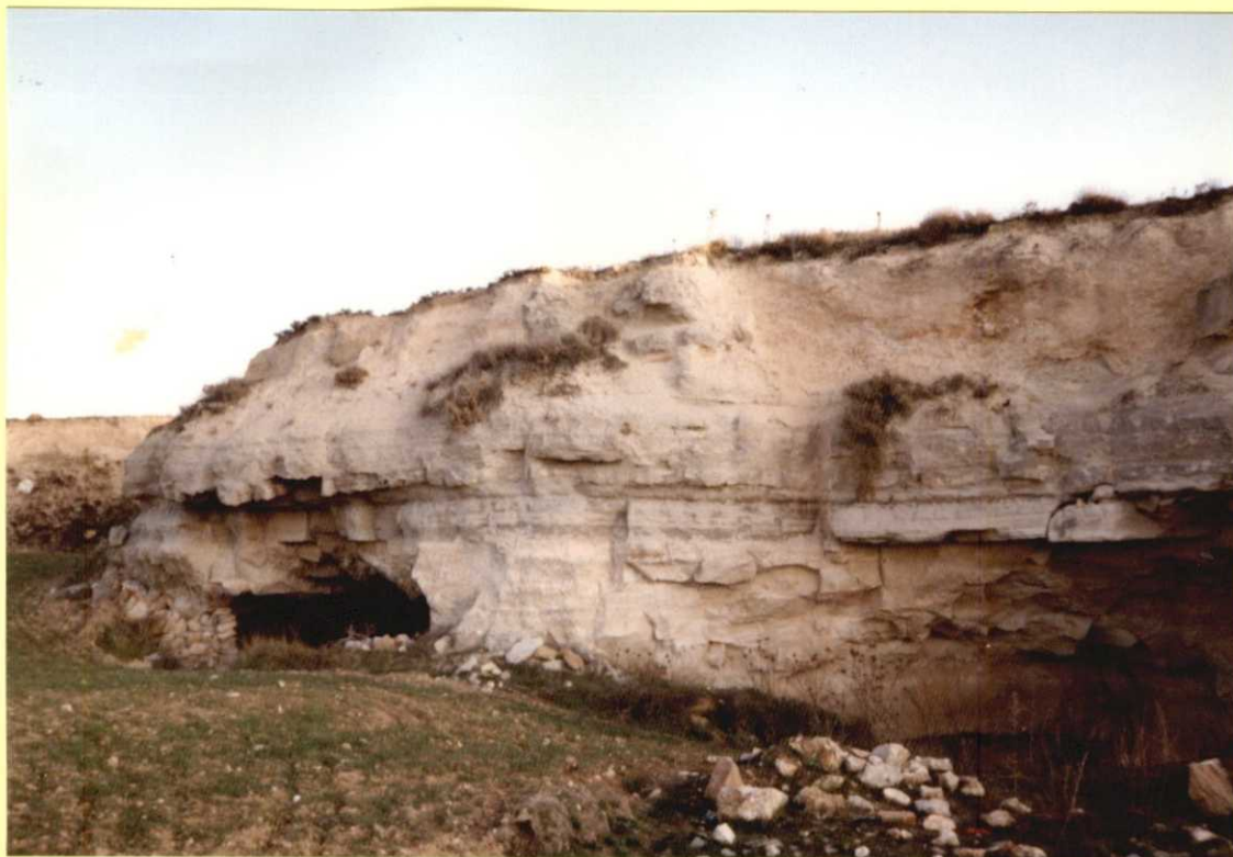
F9113. Yesos masivos (28) de la Subunidad Superior de la Unidad Paleógena-Neógena.