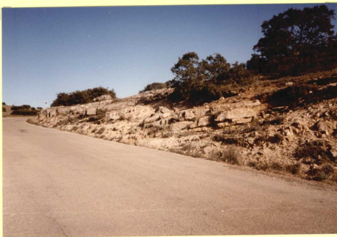
F9105. Dolomías tableadas del Cenomaniense (10) en la Sierra de Almenara (Carretera de la Puebla de Almenara a Villamayor de Santiago).