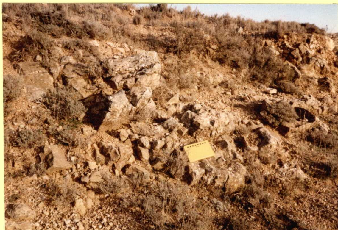
F9104. Calizas brechoides del tramo superior (6) de las facies Weald, al SE de Almonacid del Marquesado.