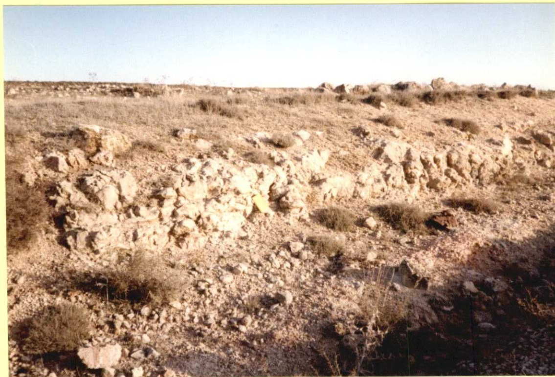
F9108. Detalle del tramo de margas con niveles dolomíticos del Coniaciense en el corte de la foto anterior.