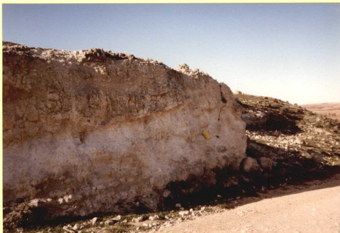
F9115. Calizas y margas (32) del techo de la Unidad del Páramo.