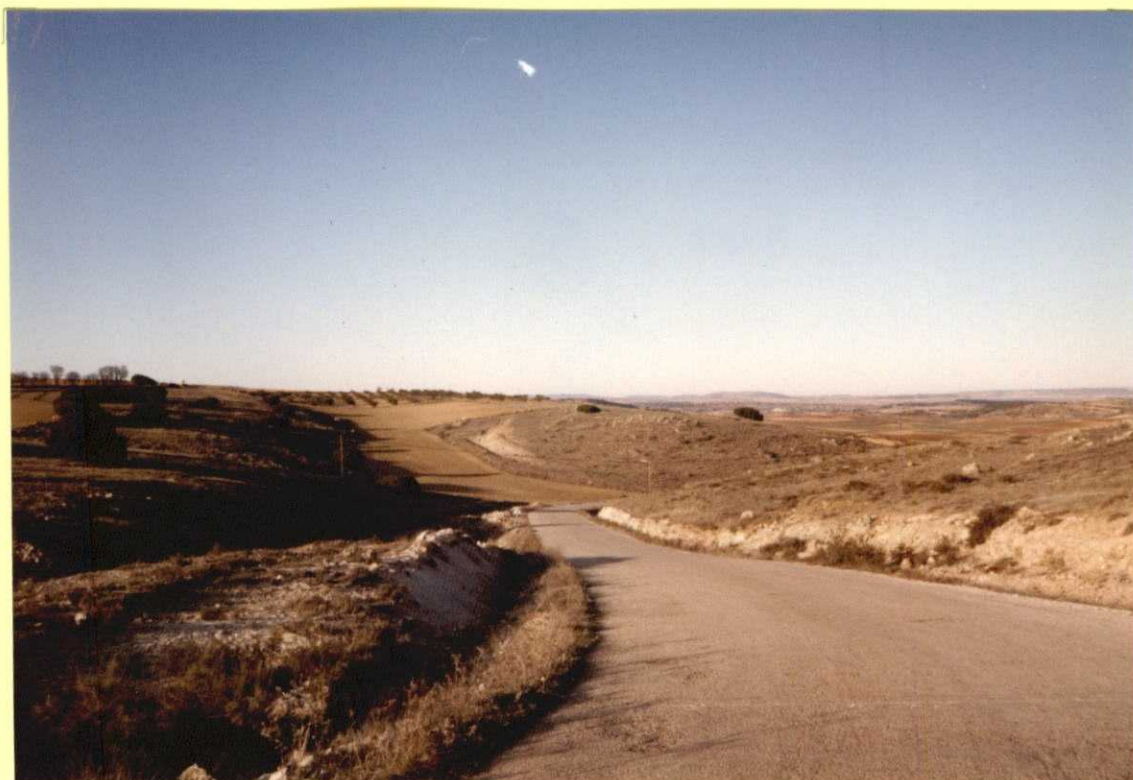
F9107. Corte del Cretácico Superior al este de Almonacid del Marquesado (Carretera a El Hito). El tramo blando por el que discurre la carretera son las margas con niveles dolomíticos del Coniaciense (11).