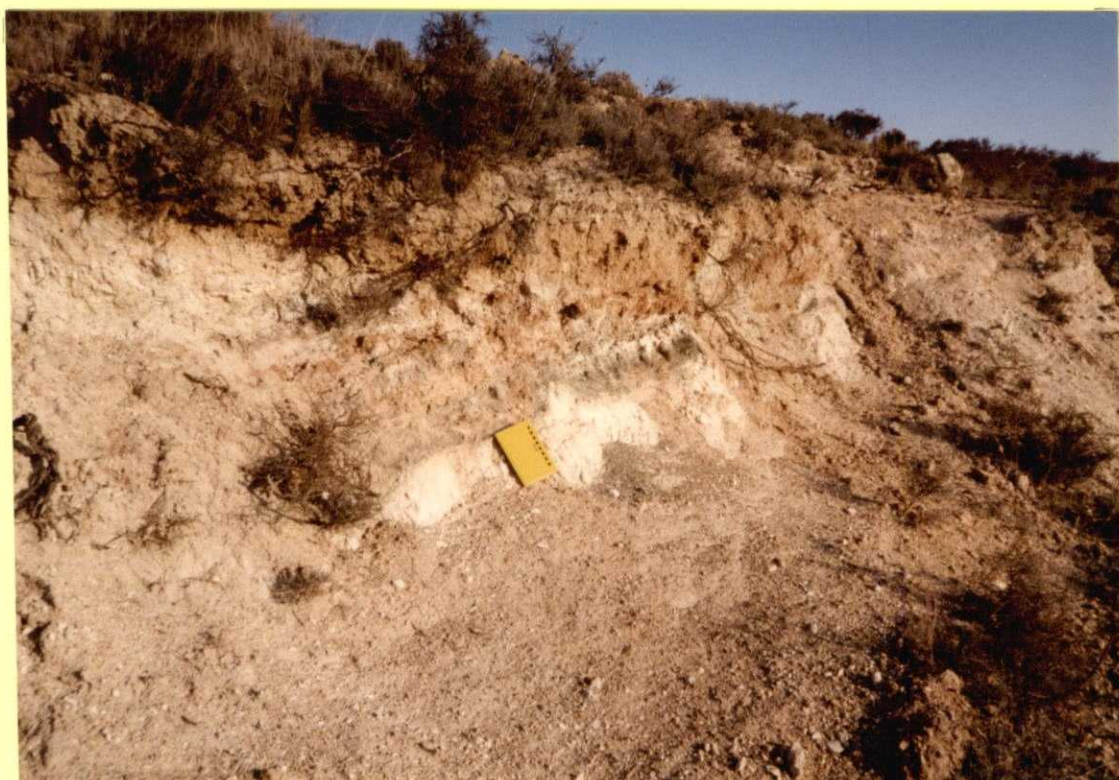
F9103. Arcillas y margas con niveles dolomíticos del tramo inferior (5) de las facies Weald, al SE de Almonacid del Marquesado.