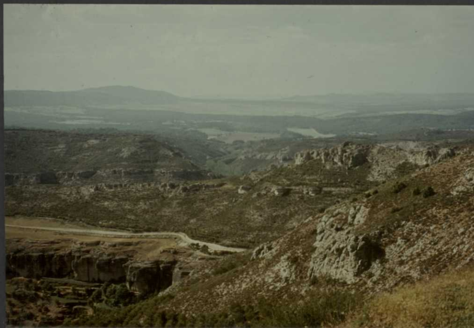
PO.9024.F16. .- Fm. Brechas de Cuenca. Al fondo sedimentos del Terciario en el Sinclinal de Mariana.