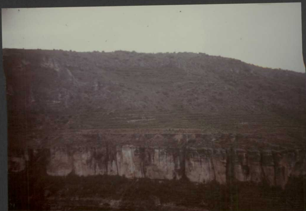
PO.9021.F13. — Hoz del Jucar: 1) Fm. Margas de Casa Medina. 2) Fm. Dolomías de la Ciudad Encantada. 3) Calizas dolomíticas y margas de la unidad cartográfica 11. 4) Fm. Brechas dolomíticas de Cuenca.