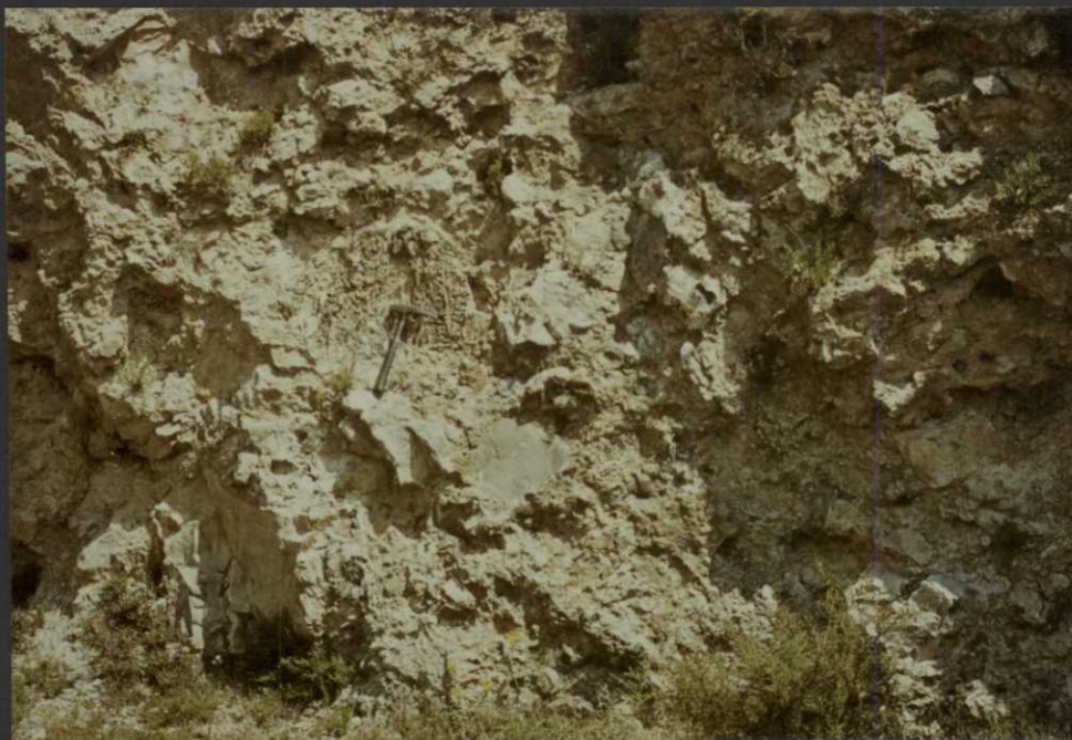
PO.9027.F19. - Fm. Brechas dolomíticas de Cuenca.