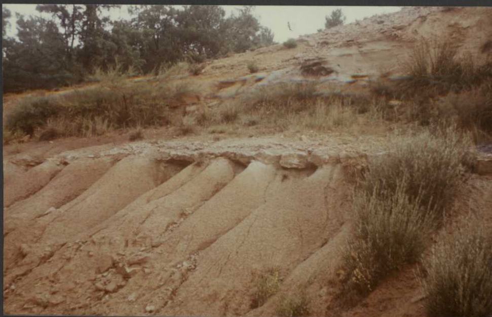
PO.9015.F7. - Arcillas y niveles calizos de la Facies Weald.