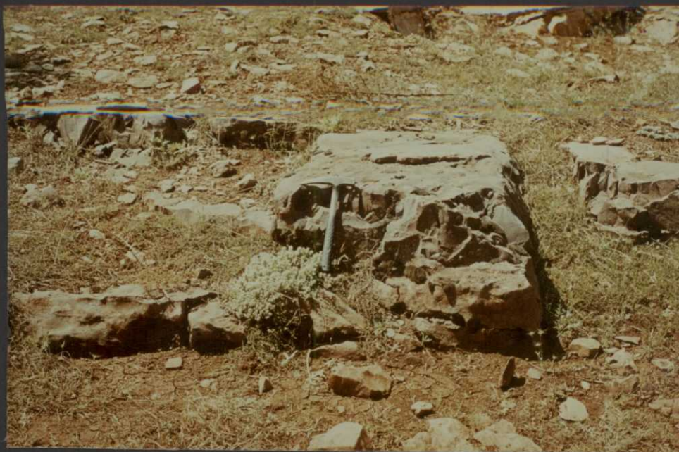
P0.9011.F3. .- Calizas oolíticas muy dolomitizadas del techo del Jurásico. Unidad cartográfica 5.