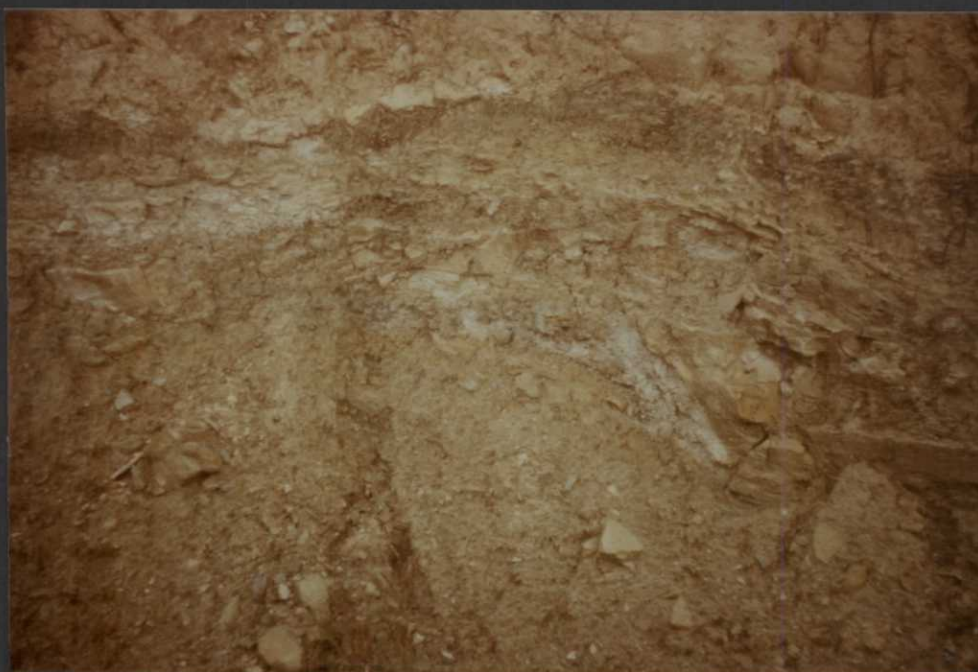
PO.9028.F20. - Transito de la Fm. Brechas de Cuenca a la Facies Garumn.