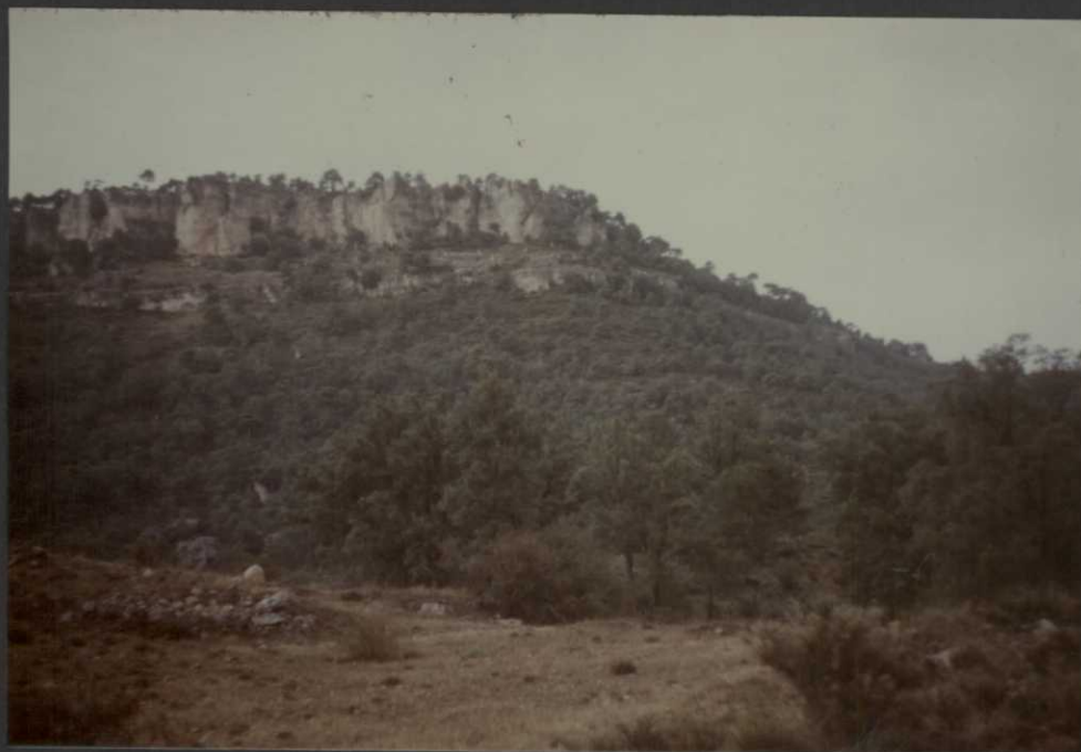
PO.9023.F15. .- Aspecto de la Fm. Dolomías de la Ciudad Encantada en la Hoz - de Valdecabras.