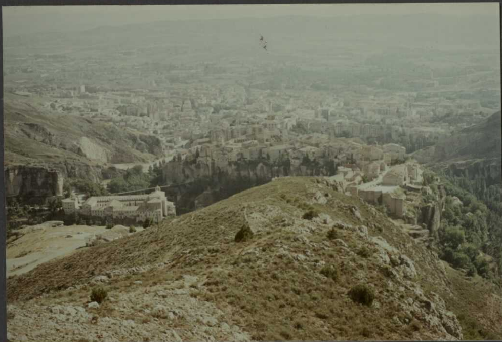
PO.9025.F17. - Brechas del Cretácico superior. Al fondo la ciudad de Cuenca,