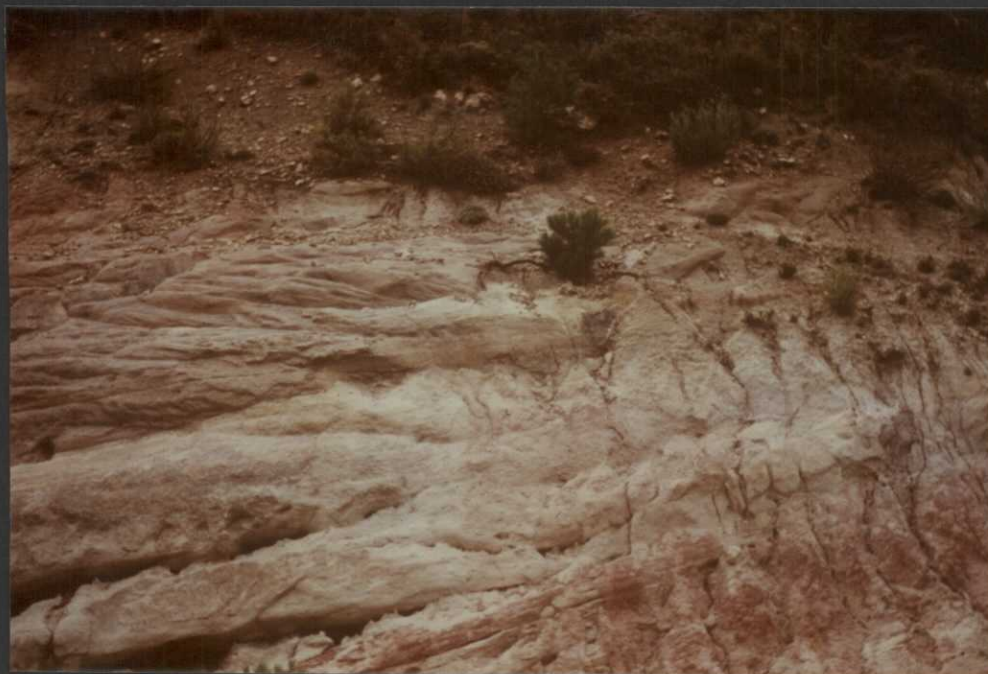
P0.9017.F9. .- Areniscas y arcillas de la Facies Utrillas.