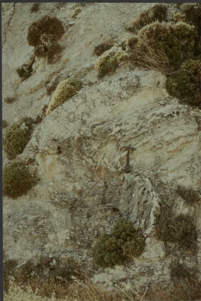
PO.9026.F18. - Pliegues en la unidad cartográfica 11.