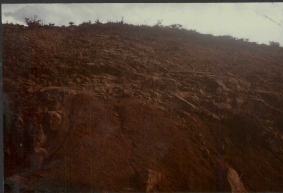
P0.9030.F22. - Fangos con niveles de arcillas rojas del techo de la unidad cartográfica (14). Eoceno-Oligoceno inferior.