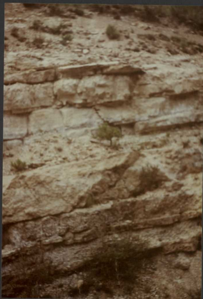
PO.9019.F11. .- Calizas y dolomías de la base del Cenomaniense. Fm. Dolomías de Alatoz.