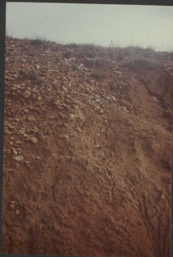
P0.9029.F21. - Fangos y arcillas rojas del Eoceno (14).