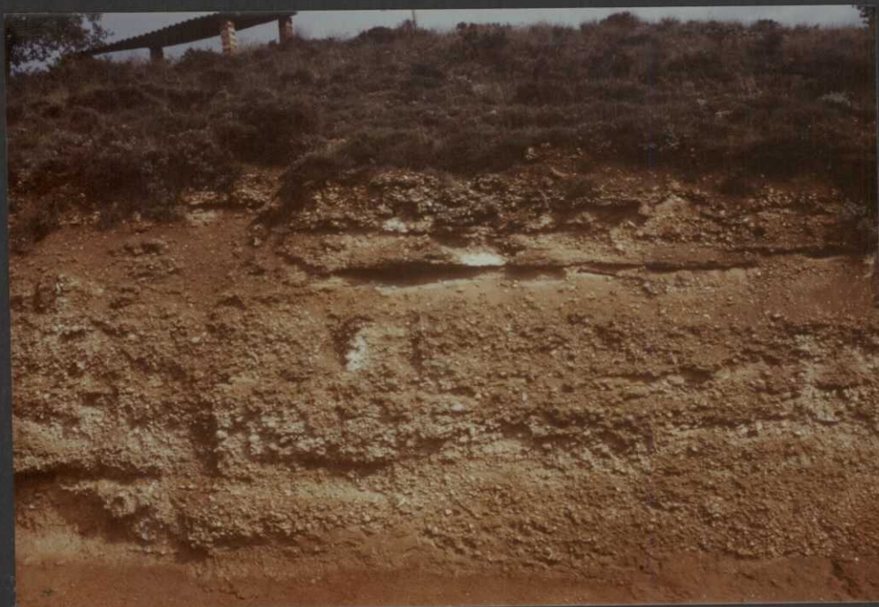
P0.9033.F25. — Conglomerados y areniscas sin cementar del techo de la unidad (15). Oligoceno.