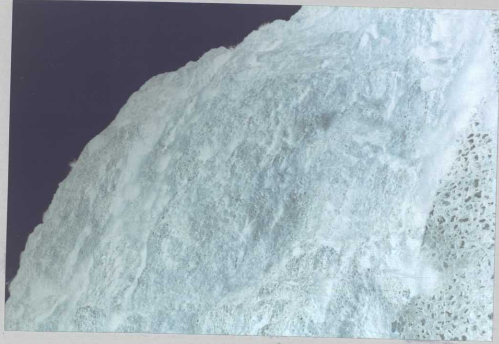
PO.9032.F24.- Conglomerados masivos del Oligoceno (15).