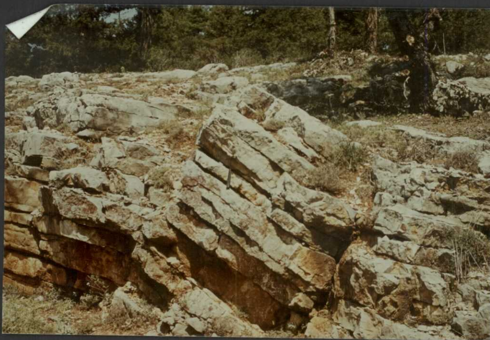
PO.9009.F1. - Calizas tableadas del Miembro Casinos de la Fm. Chelva (Dogger).