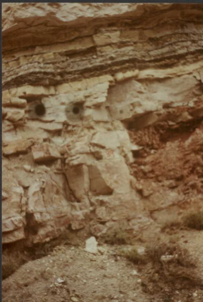
PO.9020.F12. - Dolomías y calizas dolomíticas del transito de la Fm. Dolomías de Alatoz a la Fm. Dolomías de Villa de Ves.