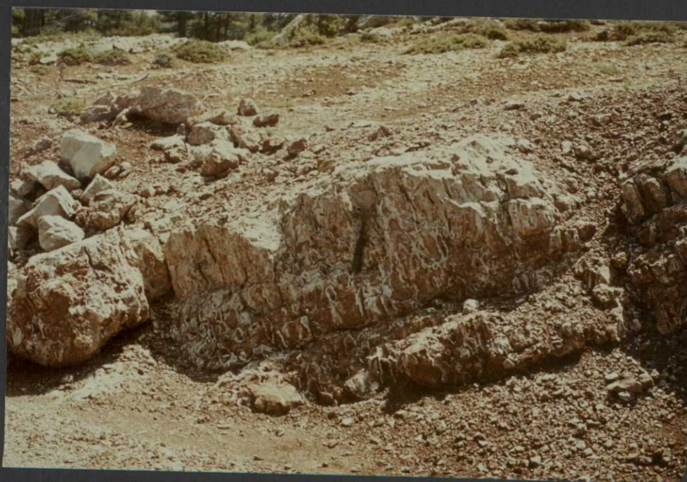
P0.9012.F4. .- Suelos calcimorfos en la base de la Facies Weald.