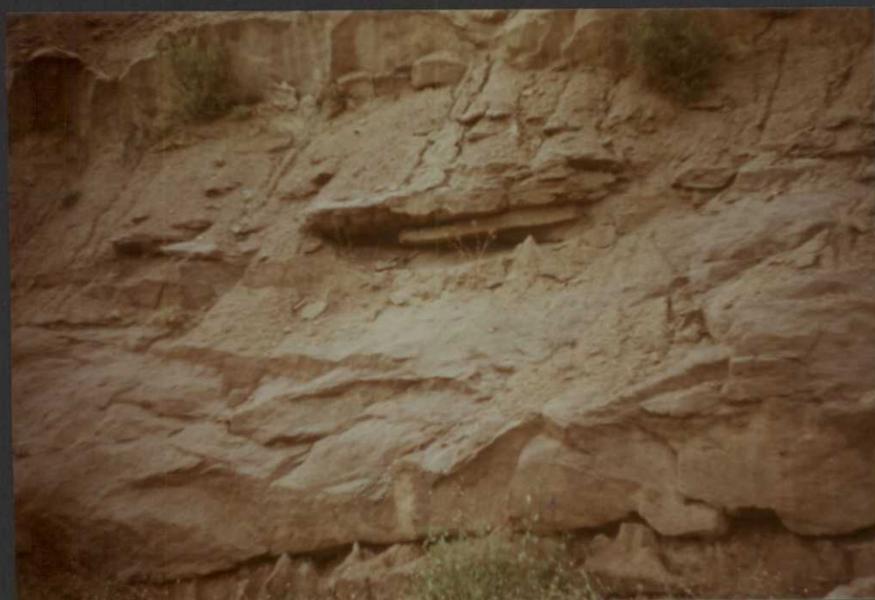
PO.9013.F5 y PO.9014.F6 .- Areniscas con base erosiva y estratificación cruzada de la Facies Weald.