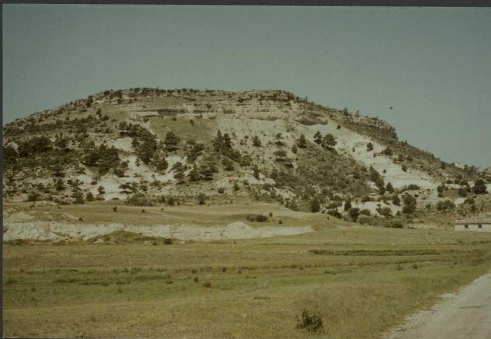
PO.9016.F8. - Facies Utrillas en las proximidades de Buenache de la Sierra.