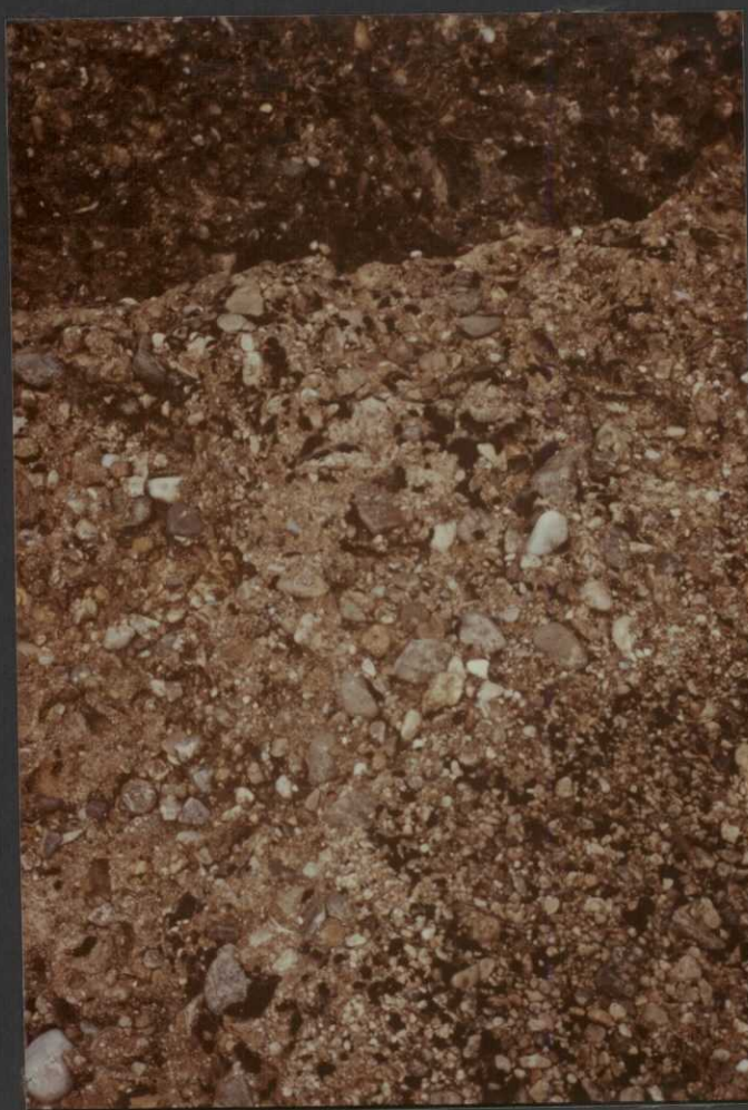
P0.9034.F26. — Detalle de los conglomerados calcáreos masivos de la unidad (15). Oligoceno.