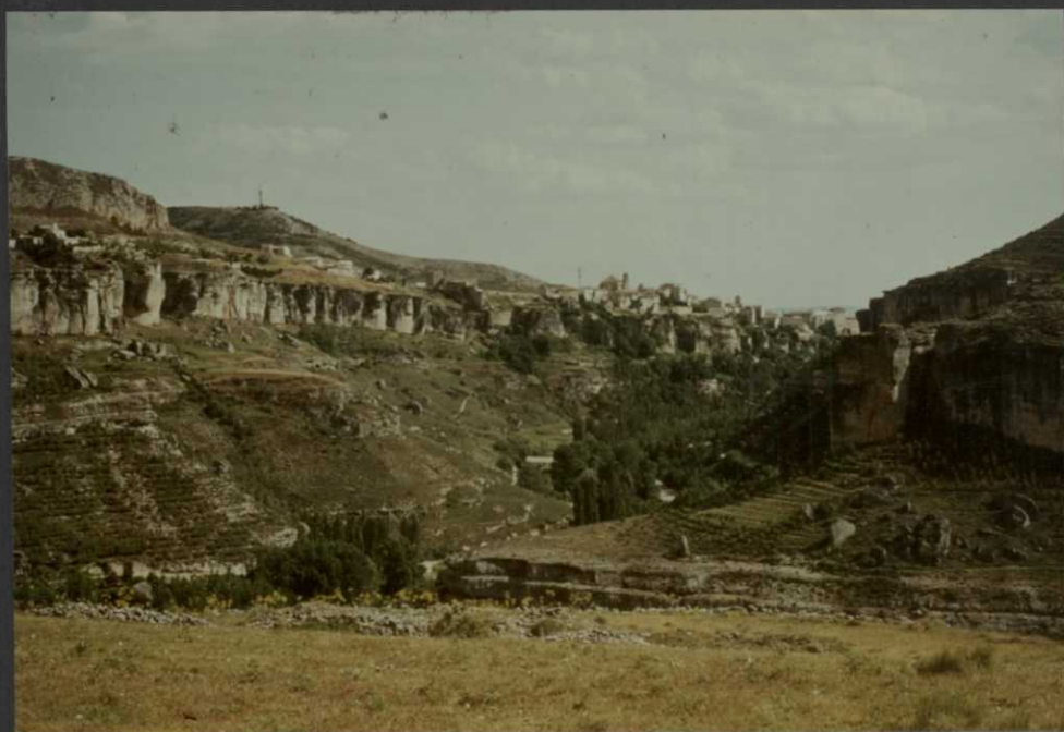
PO.9022.F14. — Hoz del Jucar: 1) Fm. Dolomías de Alatoz. 2) Fm. Dolomías de Villa de Ves. 3) Fm. Margas de Casa Medina. 4) Fm. Dolomías de la Ciudad Encantada. 5) Calizas y margas de la unidad cartográfica 11. 6) Fm. Brechas dolomíticas de Cuenca.