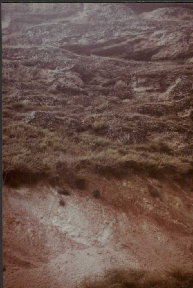
PO.9031.F23. — Conglomerados masivos del Oligoceno (15) discordantes sobre los fangos y arcillas de la unidad (14). Eoceno-Oligoceno inferior.