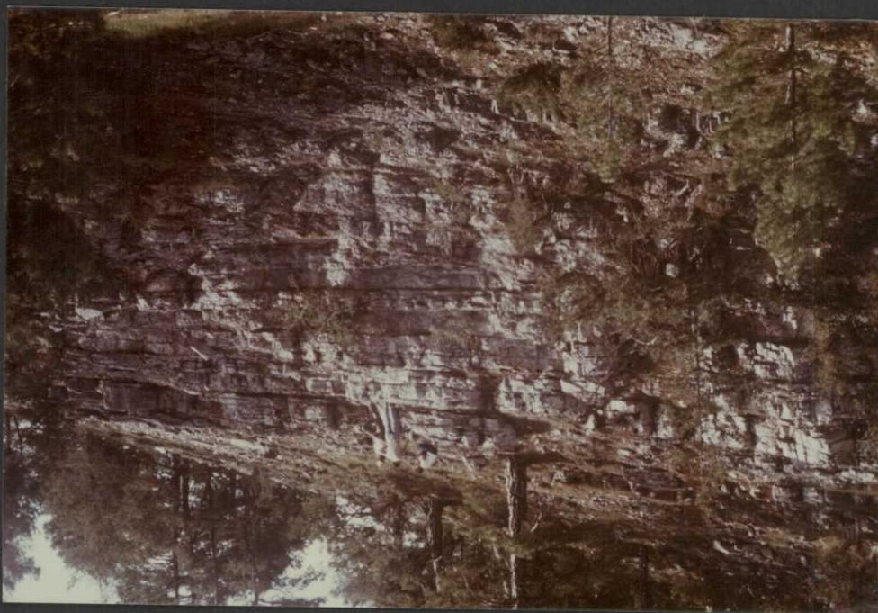
PO.9010.F2. - Calizas tableadas del Miembro Casinos. A techo calizas oolíticas.