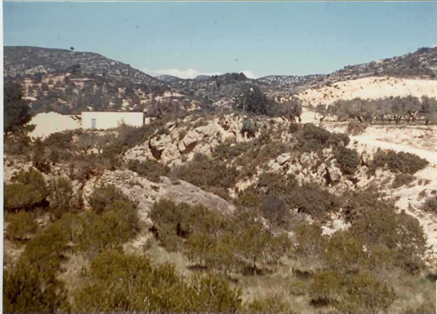
32-20-AD-MD-5013 . - Afloramiento de Plioceno en S. Onofre.