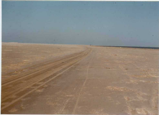
32-20-AD-MD-5002. - Vista de conjunto dela península del Fangar.