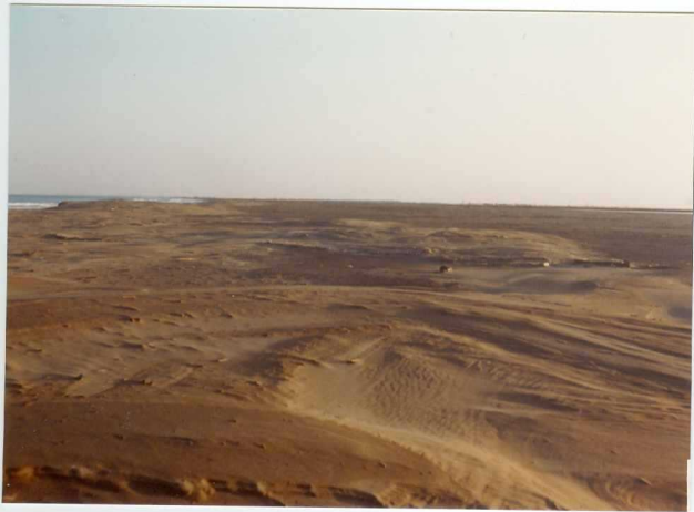
32-20-AD-MD-5004 . - Campo de dunas erosionado.