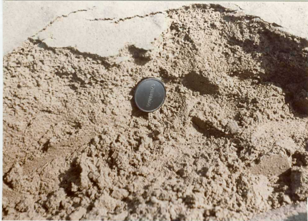
32-20-AD-MD-5008 . - Estructura en "esponja".