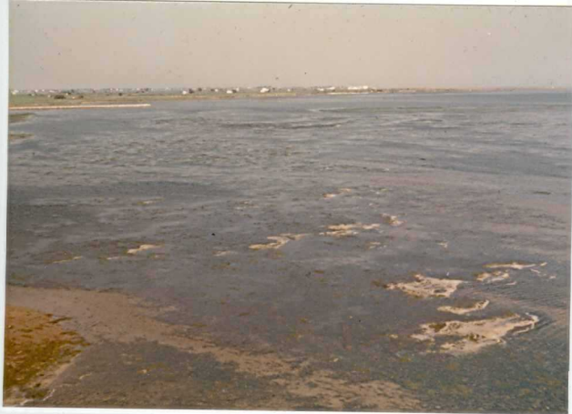
32-20-AD-MD-5003 . - El puerto del Fangar.