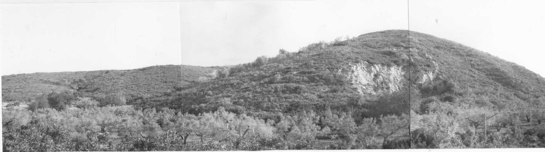
Hoja 32-20-AD-OG-15.- Barremiense superior ( C_{14}^3 ).