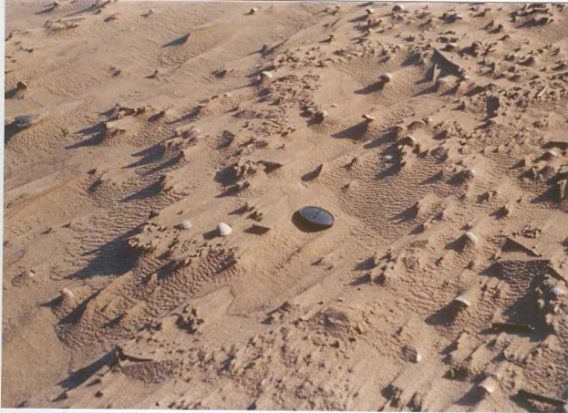
32-20-AD-MD-5009 . - "Filamentos de playa".