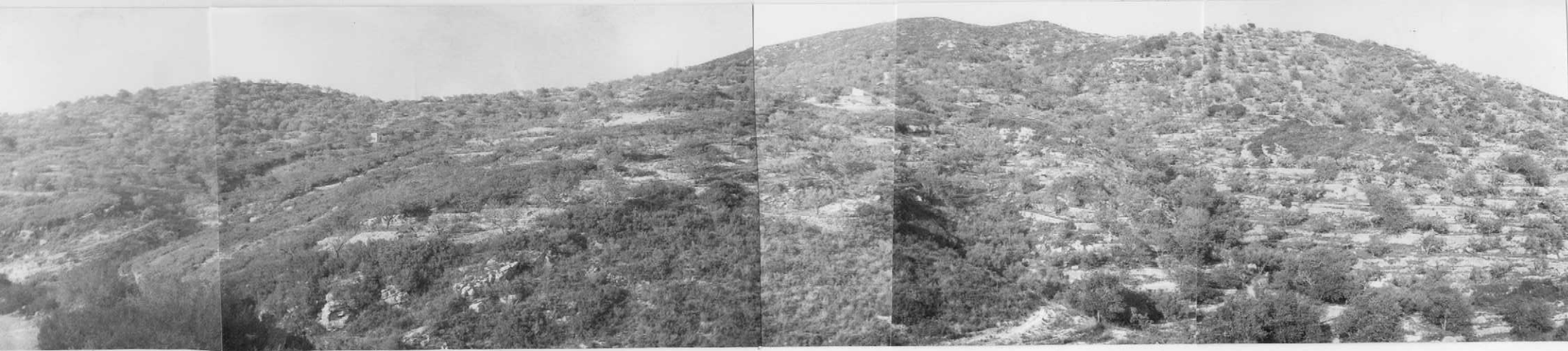
Hoja 32-20-AD-OG-16.- El Barremiense margoso (Cm ).