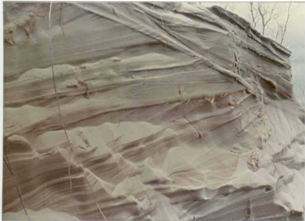
32-20-AD-MD-5007. - Duna erosionada.