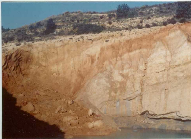
32-20-AD-MD-5014. - Cantera de Plioceno; en el techo Pleistoceno rojo.