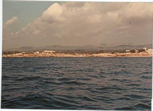
32-20-AD-MD-5001. - Vista del Pleistoceno desde el Fangar.