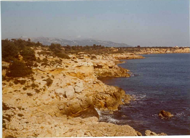
32-20-AD-MD-5012 . - Cantil del Pleistoceno.