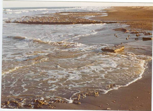
32-20-AD-MD-5006 . - Levee natural abandonado en erosión.