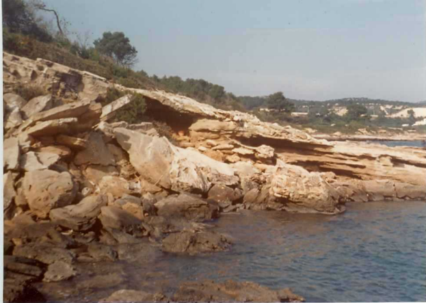
32-20-AD-MD-5011 . - Paleoplays de "Morro de Gos".