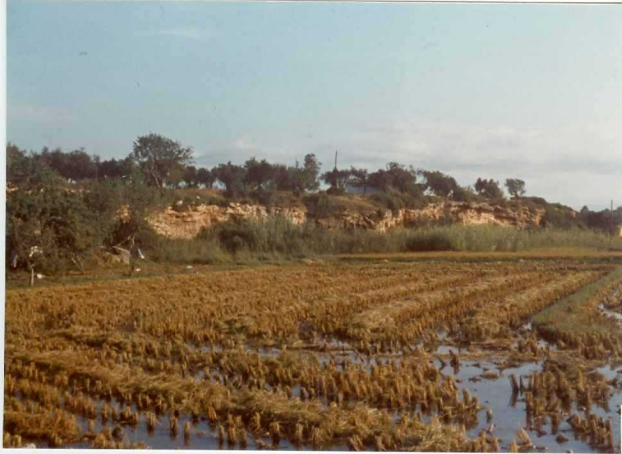
32-20-AD-MD-5010. - Contacto Delta-Pleistoceno.