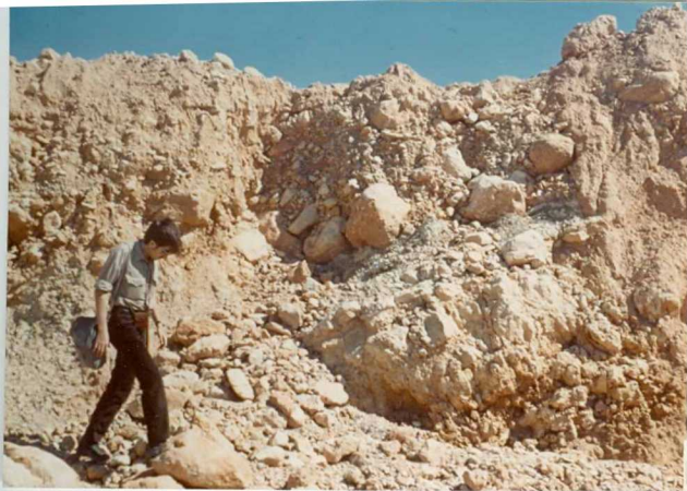
32-20-AD-MD-5015. - Nivel de calizas lacustres del Plioceno terminal.