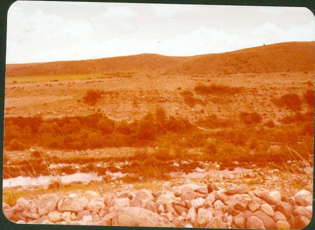
FOTO FC 25 9025 .- Aluviales en el rio Adaja. Zorita.