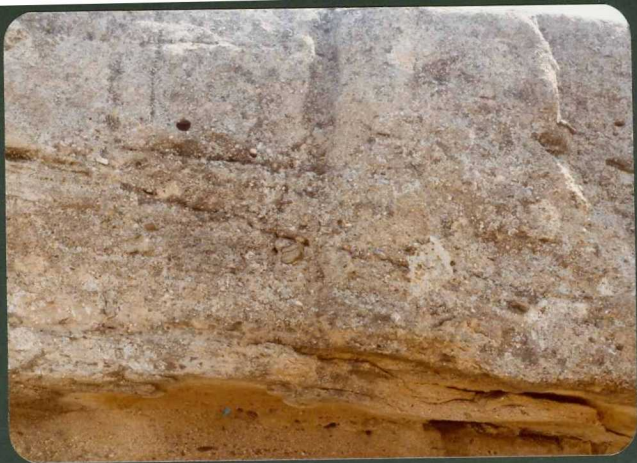
FOTO FC 5.- Detalle de los niveles de areniscas microconglomeráticas ce- 9005 mentadas. "Unidad Pozanco". Pozanco.