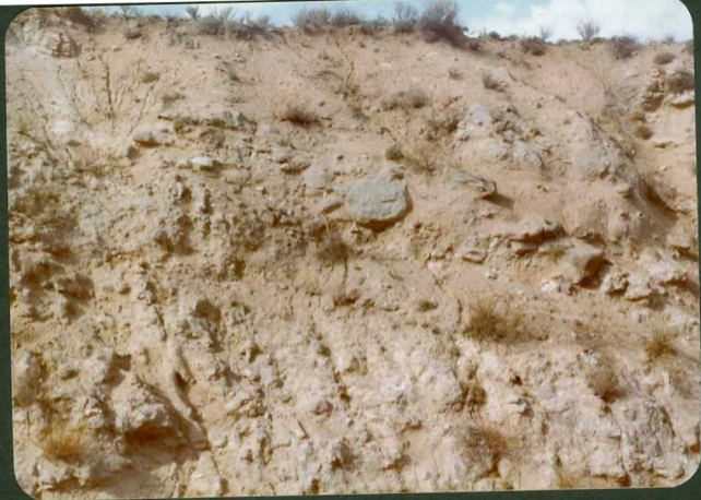
FOTO FC 10.- Proximal de abanico. "Unidad Calzadilla". Sur de Monsalupe.