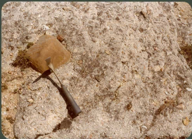
FOTO FC 8.- Areniscas microconglomeráticas de la "U. Pozanco" con cantos 9008 poligénicos englobados. Pozanco.