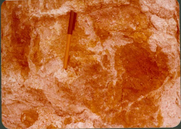
9001 FOTO FC X.- Arenas tigreadas de la "Unidad Torneros". (Paleógeno). Sur de Monsalupe.