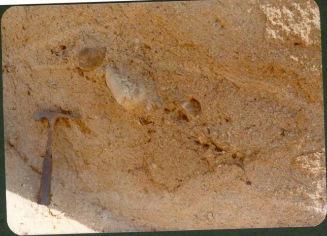
FOTO FC 15.- Fangos arcóxicos microconglomeráticos, paso de la "Unidad Peñalba" a la "U. S. Pedro del Arroyo". Las Berlanas.