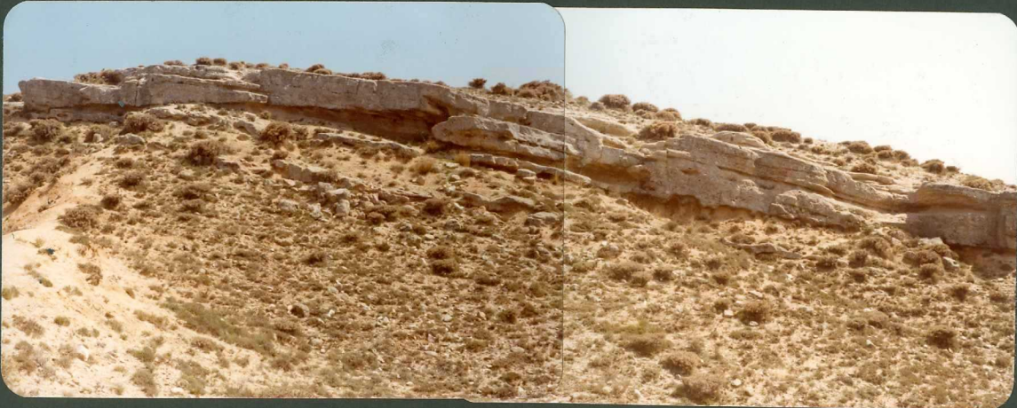
FOTO FC 3.- Paleocanales cementados de la "Unidad Pozanco". Mioceno in- 9003 ferior-medio. Pozanco.