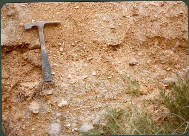
FOTO FC 16.- Fangos arcósicos beige rojizos de la "U. Peñalba". Zorita.