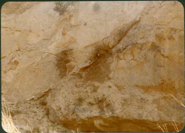
FOTO FC 9.- Fracturas dentro de las arcosas beigeas de la "U. Pozanco".