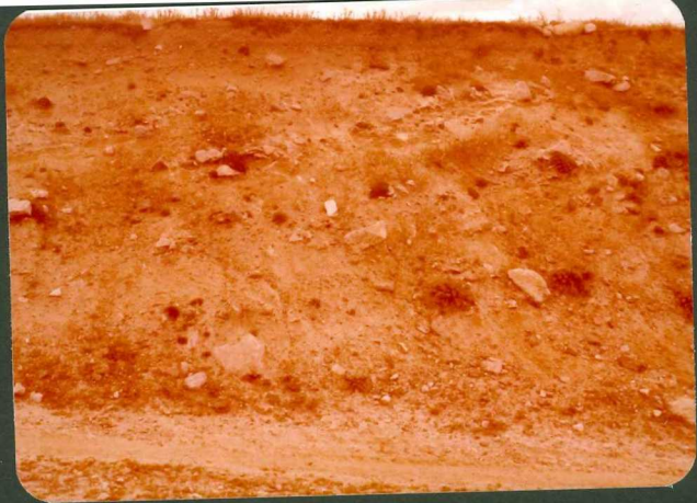
FOTO FC 14.- Fangos arcósicos englobando cantos, principalmente de procedencia plutónica. "Unidad Peñalba". Sur de Peñalba.