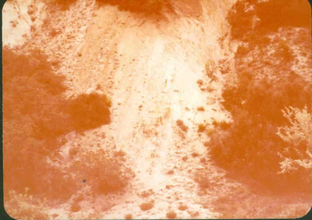
FOTO FC 2.- Areniscas tigreadas, arenas, y arcillas arenosas verticali- zadas. "Unidad Torneros". (Paleógeno). S de Monsalupo. 9002