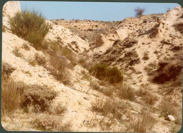
FOTO FC 6.- Arcosas beiges con cantos aislados de la "U. Pozanco". Pozanco.