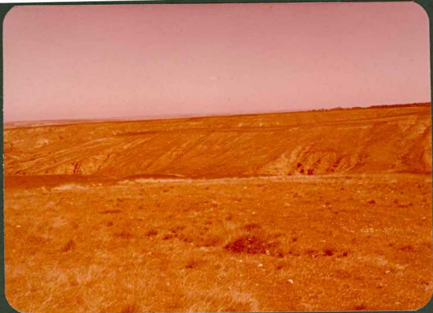
FOTO FC 19.- Superficies al Sur de Santo Domingo de las Posadas y "Unidad 9019 Olalla".