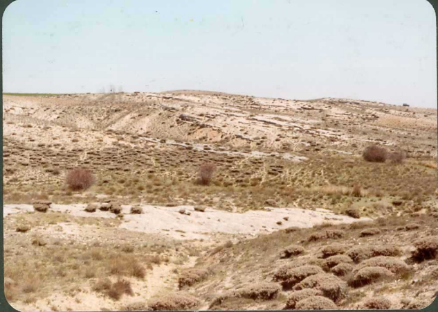
FOTO FC 4.- Arcosas beiges y areniscas cementadas de la "Unidad Pozanco".