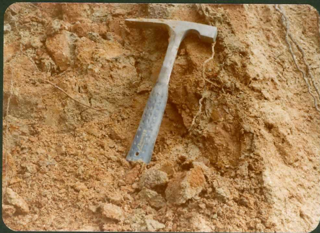
FOTO FC 17.- Fangos arcósicos de la "U. S. Pedro del Arroyo". San Juan de 9017 la Encinilla.