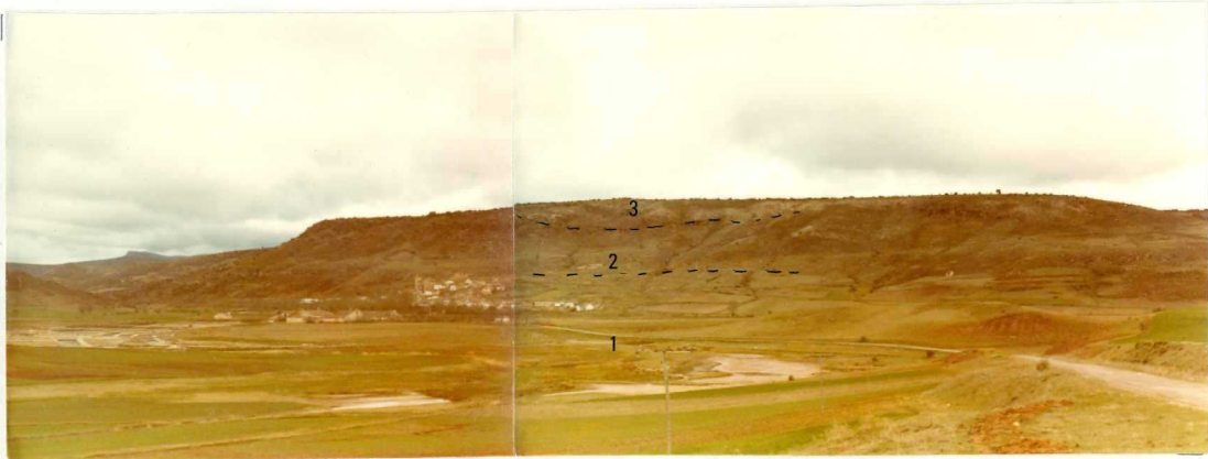
FA. 507. Vista parcial del pueblo de Imón. En primer término 1) Las margas, limolitas y yesos versicolores ( T_{G3} ). 2) Carniolas y dolomias tableadas en la base ( T_{G3-J1} ). 3) Caliza y dolomias tableadas ( J_{1-13}^{0-12} )