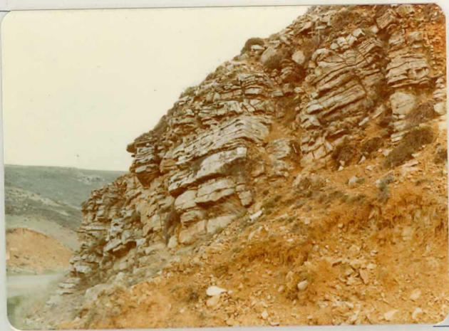
FA. 509. Vista detallada del tramo inferior del conjunto - (T G3-J1 ): Dolomias tableadas de Imón. Alrededores de Sigüenza.