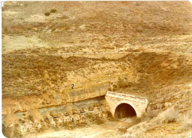
FA. 504. Vista general de las Facies Muscheskalk en el ferrocarril abandonado de Horna. 1) Dolomías ( T_{G_2} ) 2) Dolomías margas y calizas dolomíticas ( T_{G_2-3} )