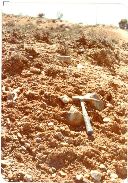
FA. 533. Detalla par- cial de la misma for- mación ( T_{C2}^B )