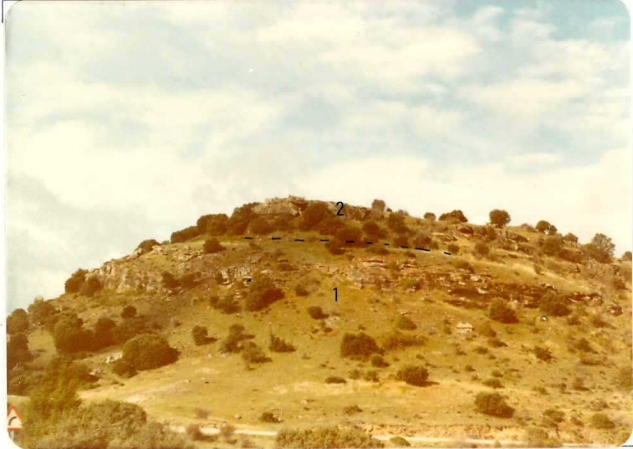
FA. 505. Vista general de las facies triásicas 1) Areniscas y arcillas rojas ( T_{G1-2} ) 2) Dolomias ( T_{G2} ). Carretera de Cubillas del Pinar a Guijosa.