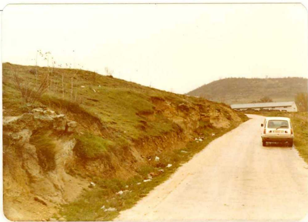
FA. 524. Vista parcial de una terraza de travertinos (QT) en las cercanías de Riotoví del Valle de Sigüenza