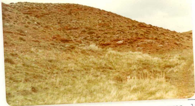
FA. 508. Vista general de las facies Keuper, margas, limolitas y yesos versicolores (T G -3)