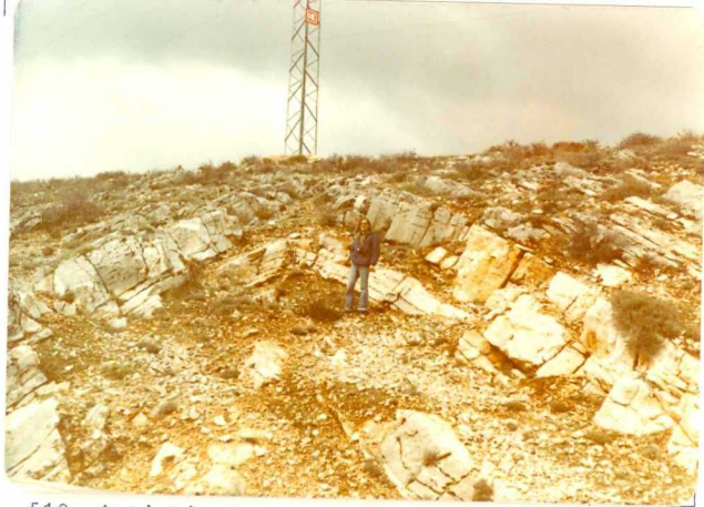
FA. 510. Anticlinal en las calizas y dolomias tableadas (J 0-12 1-13)