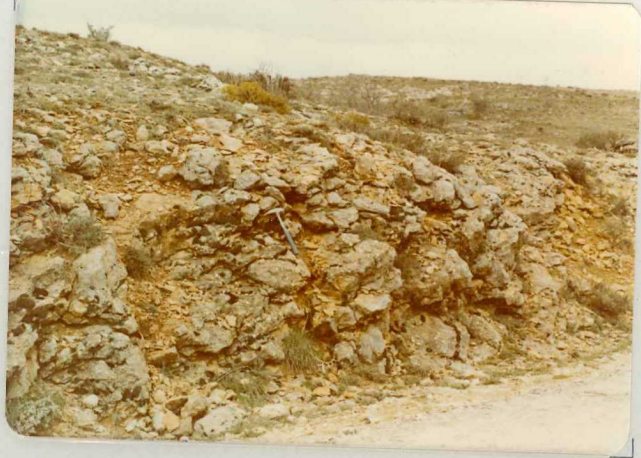
FA. 511. Calizas bioclasticas y margas del Pez a la base (J 12-23 13-13)