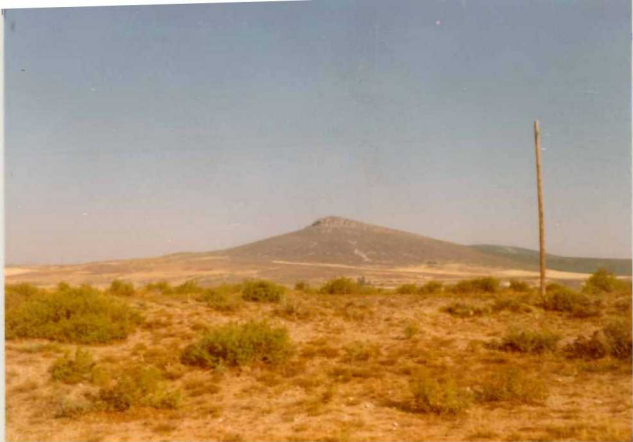
GL. 9615. Vista de la tierra de la Boderá, constituida por la serie alternante de cuarcitas y pizarras 0_{11} y cuarcitas del alto Rey 0_{12} q