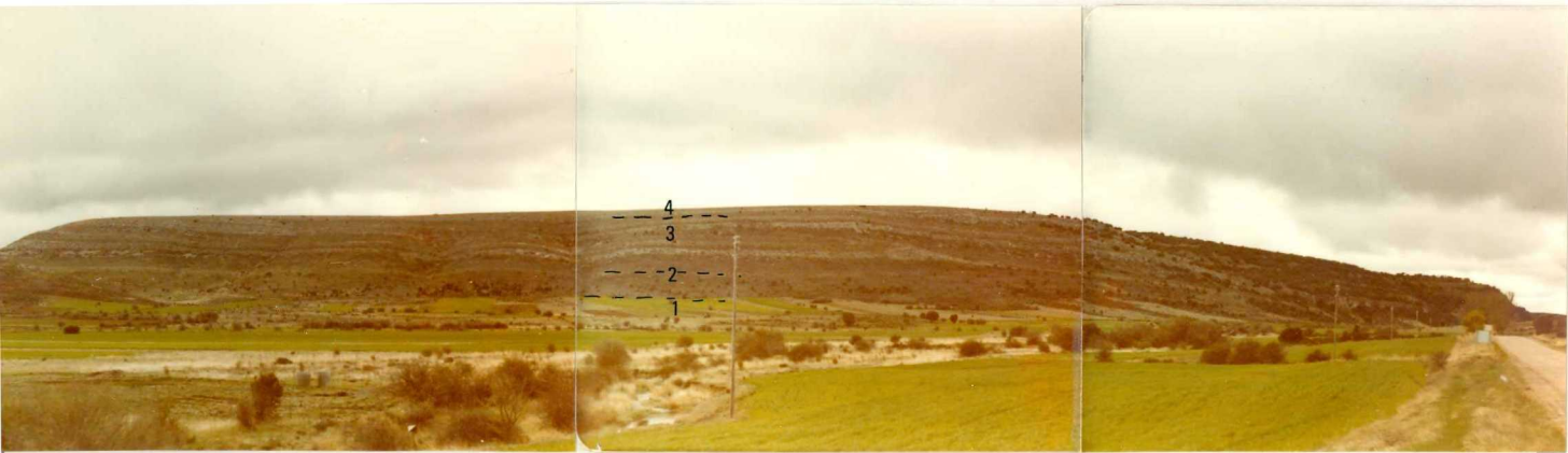
TA. 514. Panorámica del Cretácico de La Muela al NE de Riofrio del Llano: 1) Arenas arcóscicas versicolores ( C_{16-21} ) 2) Calizas y margas con fauna ( C_{21-22} ) 3) Calizas y calizas margosas ( C_{22-23} ) - 4) Dolomias y calizas dolomíticas en bancos gruesos ( C_{23-25} )