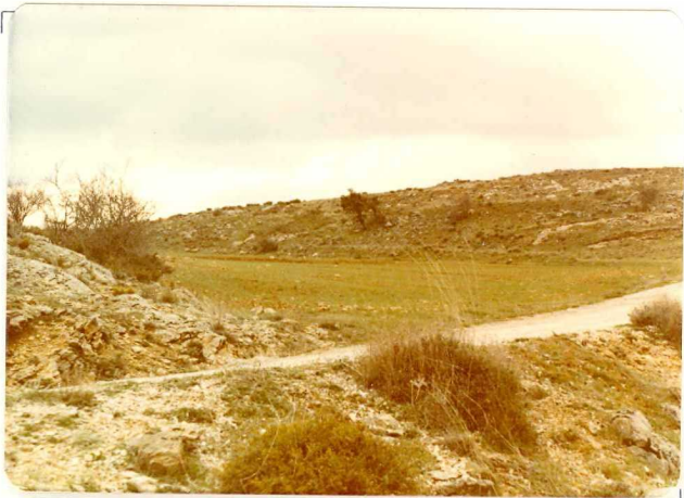
FA. 512. Margas del Pez y Calizas bioclásticas (J 12-23 13-13 )