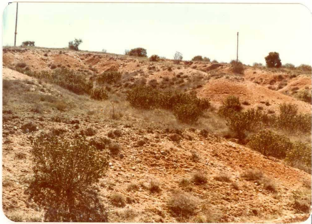
FA. 522. Vista general de la Raña ( T_{C-2}^B ) en los alrededores de Rebollosa de Jadraque.