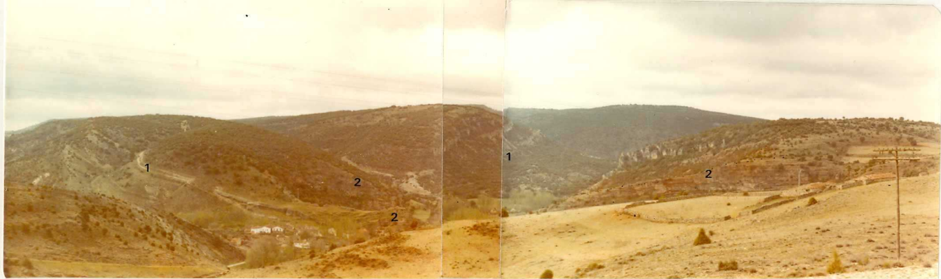
FA. 517. Vista general de la discordancia entre los materiales cretácicos (1) y Miocenos ( T_{C1-1}^{Bb-Bc} ) (2) en los alrededores de la Cabrera.