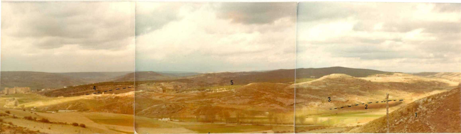
FA 501 Vista del flanco Sur del Anticlinal de Sigüenza: 1) Dolomias tableadas de Imón ( T_{G3-J_1} ). 2) Marga, limolitas y yesos versicolores ( T_{G3} ). 3) Dolomias, margas y calizas dolomíticas ( T_{G2-3} ). 4) Dolomias ( T_{G2} ) y 5) Areniscas y arcillas rojas ( T_{G1-2} ).