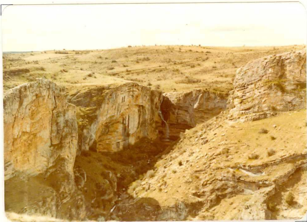
FA. 506. Vista general de la formación. Cuevas Labradas, calizas y dolomias tableadas ( J_{1-13}^{0-12} ) en la Hoz de Pelegrina.