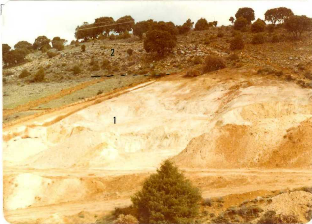
FA. 513. 1) Arenas arcósicas versicolores ( C_{16-21} ) en facies Utrillas. 2) Calizas y margas con fauna ( C_{21-22} ) Carretera de Sigüenza a la Cabrera.