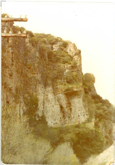
FA. 516. Dolomias, caliza dolomiticas en bancos grue s sos ( C_{23-25} ) en las cerca- nias de la estación de Cuta m illa.