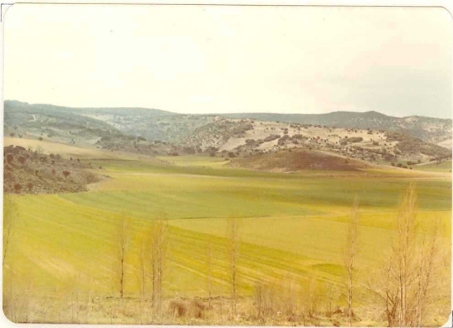
FA. 525. Fondo de Valle (Q)