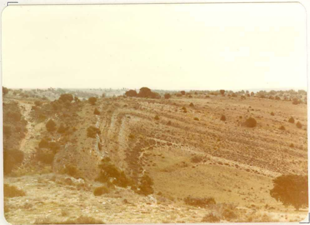
FA. 515. Sinclinal en el tramo Cretácico de calizas y calizas margosas ( C_{22-23} ). Cercanías de la Cabrera.