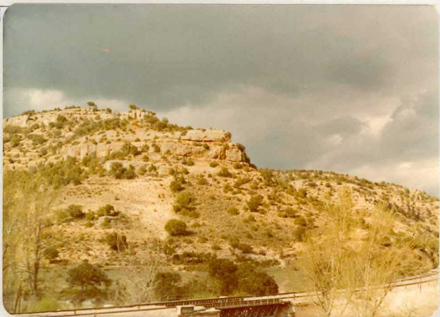
FA. 518. Arcillas y conglomerados ( T_{C1-1}^{Bb-Bc} ) subhorizontal