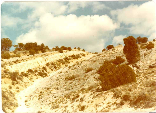
FA. 519. Detalle de las calizas y margas con fauna (T A-A C2-33 ) Viana de Jadraque