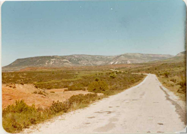
FM. 2144. Vista general de los relieves cretácicos de Somolinos. En primer término sedimentos triásicos en facies Bund- sandstein.