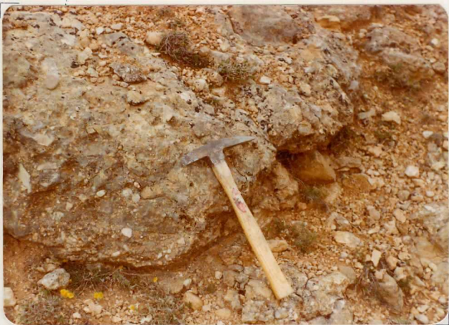
FM. 2144. Detalle de los conglomerados miocenos ( T_{C1}^B ) al Sur de la falla de Somolinos. La fotografía corresponde a un detalle de la anterior (FM. 2143)