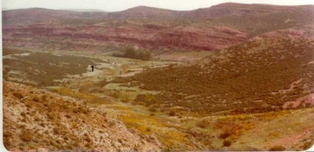
PM. 2135. Vista general de los materiales triásicos en facies Bundsandstein ( T_{G1-2} ) en las proximidades de Manzanares. En primer término (1) sedimentos pérmicos - ( P_{11-12} ) formalmente cubiertos por derrubios.