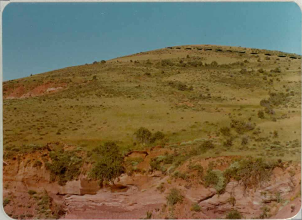
FM. 2131. Vista parcial de la serie permica ( P_{11-12} ) en el Alto del Pino. En la parte alta se puede observar la discordancia Triásica.