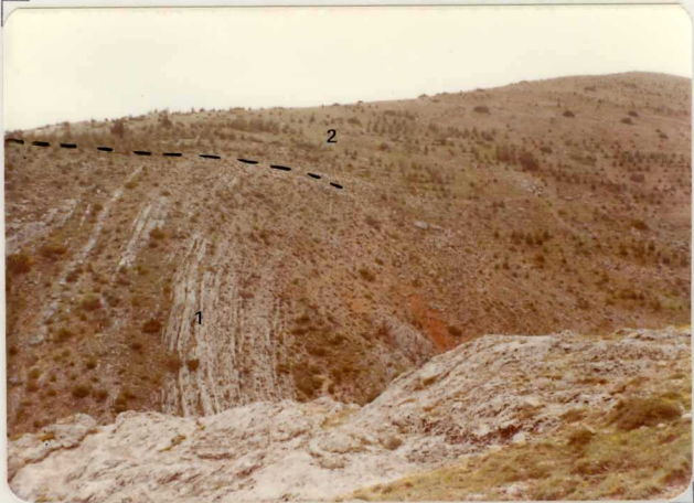
FM. 2143. Vista parcial del Cretácico superior (1) en las proximidades de la falla de Somolinos. Observase la clara discordancia de los sedimentos miocenos (2) ( T_{C1}^B )