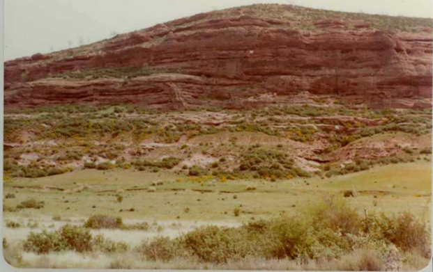
M. 2136. Vista parcial de un afloramiento Triásico en facies Bundsandstein ( T_{G1-2} ) en las proximidades de Manzanar res.