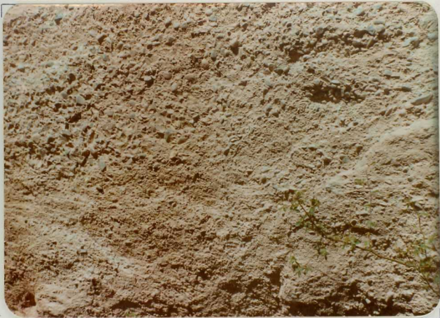
FM. 2134. Detalle de un nivel de brechas cuarcíticas del Pérmico (P 11-12 )