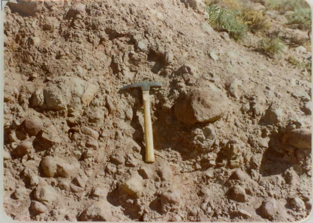
FM. 2130. Vista parcial de los Andesitas pérmicos en un afloramiento próximo a la localidad de Cañamares (a)