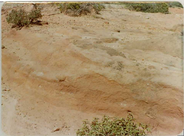
FM. 2138. Detalle de arenas triásicas en facies Bundsandstein ( T_{G1-2} ) cerca del techo de los mismos, en las proximidades de Albendiego.