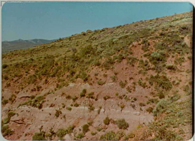
FM. 2133. Vista parcial de niveles detríticos pérmicos ( P_{11-12} ), al Norte de Cañamares.