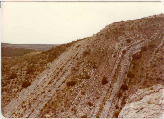
FM. 2142. Vista parcial de la disposición subvertical del Cretácico superior en la falla de Somolinos.