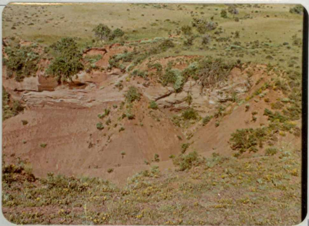
FM. 2132. Vista más detallada de un afloramiento pérmico ( P_{11-12} ), reflejado en la fotografía anterior.