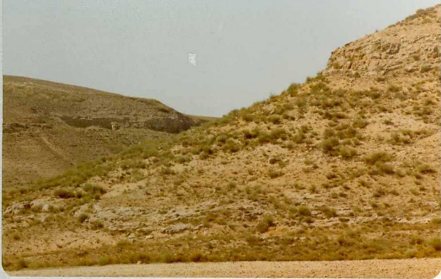
14/17-IB-EJ-629. Vadillo de Guareña (Arroyo de Antanilla) Aspecto del Paleógeno.