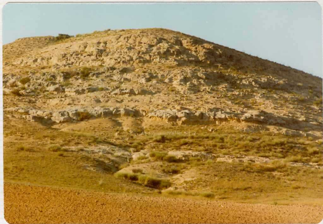
14/17-IB-EJ-603.- Los Regatones.- El Grupo Superior Paleógeno aparece con diferente inclinación bajo las series de Valdefinjas.