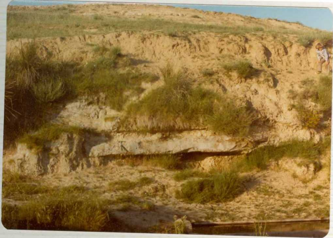
14/17-IB-EJ-621. Fuentesauco. Fuente de Carrevenialbo. Alternancia de areniscas de distinta compacidad. Lute--ciense.