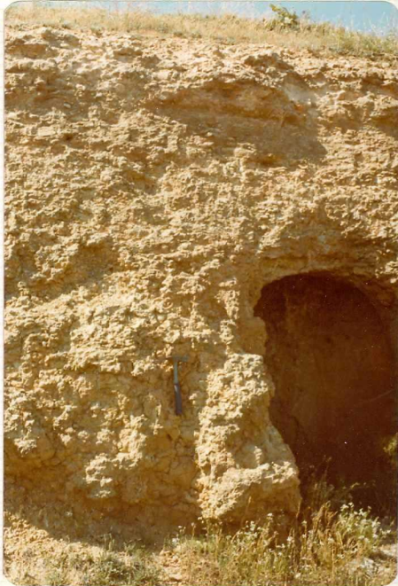
14/17-IB-EJ-628. Km 8 carretera Alaejos-Fuentelapeña. Mar gas arenosas ("Series de Valdefinjas")