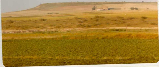
14/17-IB-EJ-633. Alaejos. Cerro de Nuestra Señora de La Ca sita. Desde la cumbre afloran sucesivamen te materiales cuaternarios ( Q_1T_1 ), "arenis cas de Cantalapiedra" (Vindobóniense-Va-- llesiense) y Grupo Superior Paleógeno.