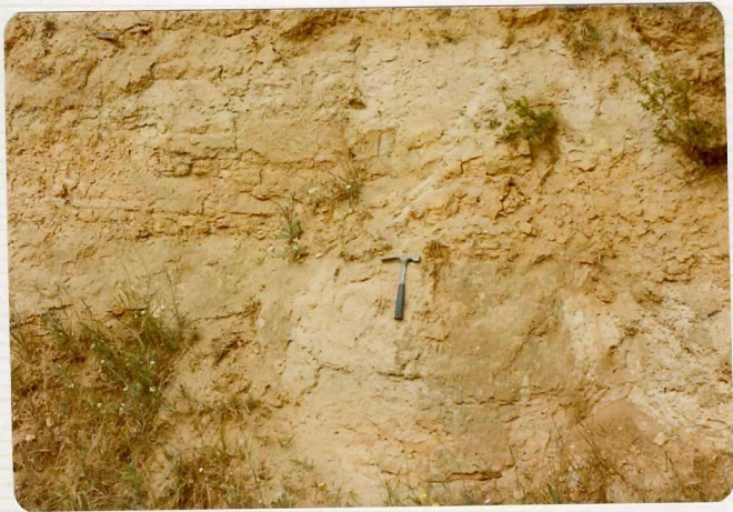
14/17-IB-EJ-622. 0,5 kms al NO de Fuentesauco. Laminaciones en - el Luteciense,