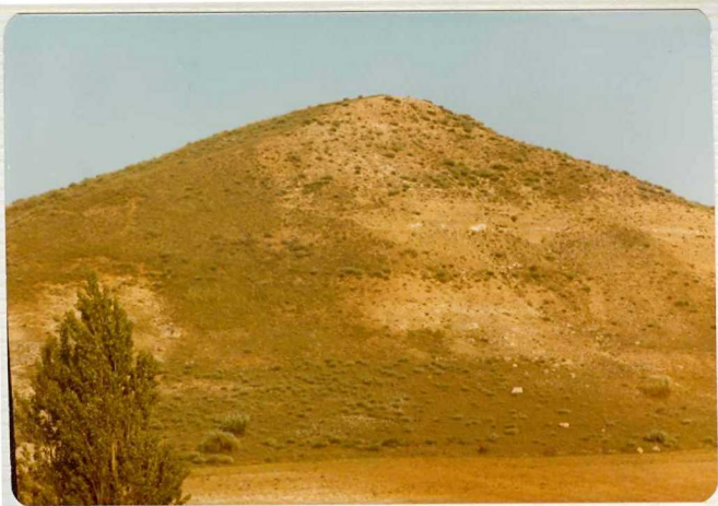
14/17-IB-EJ-631. Carmona. Aspecto general del Grupo Superior Paleógeno.