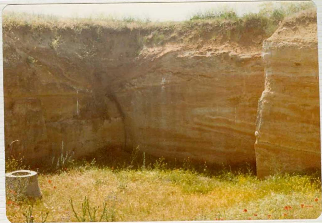
14/17-IB-EJ-618. Fuentesauco. Cantera fosilífera (Transición Luteciense-Bartoniense). Estratificaciones cruzadas.