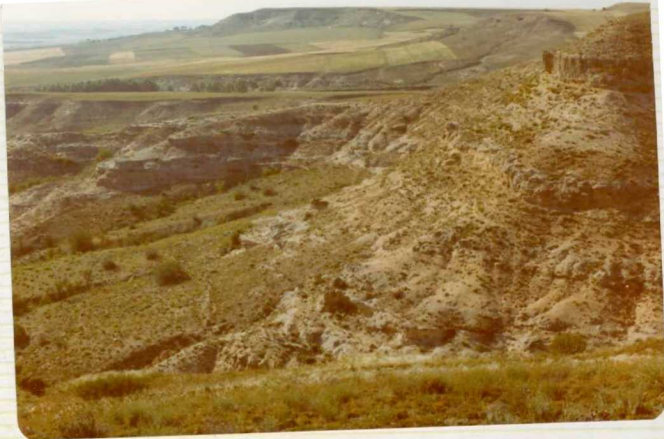
14/17-IB-EJ-608. Desde el cerro del Molino del Pico hacia el NO. En segundo término, el barranco de "La Ventosilla" con tres niveles fosilíferos. Al fondo, Valhondo.