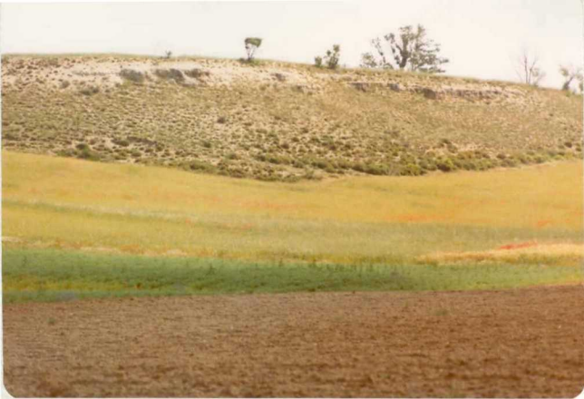
14/17-IB-EJ-623. Fuentesauco (El Rodeo).- Escarpes formados por conglomerados compactados. Base del Grupo Superior Paleógeno.