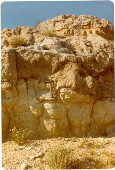
14/17-IB-EJ-611. Molino del Pico. Superficie erosiva. Oligoce no.