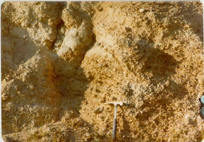
14/17-IB-EJ-602 En el camino de Carretarazona, entre - los Regatones y Tarazona de Guareña. - Niveles de conglomerados en el Grupo Superior Paleógeno.