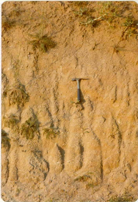
14/17-IB-EJ-632. Carretera Alaejos-Castronuño. Afloramiento de las "areniscas de Cantalapiedra" (Vindoboniense-Vallesiense).