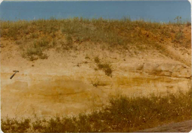
14/17-IB-EJ-615. 1 Km al SE de Fuentelapeña. Estratificación cruzada laminada. Paleógeno.