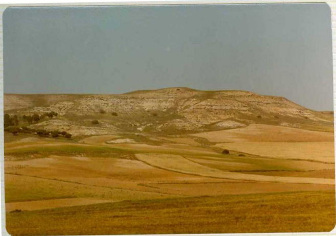
14/17-IB-EJ-613 Valhondo desde Castrillo de La Guareña. El - Grupo Superior Paleógeno parece buzar discon forme bajo las series de Valdefinjas.