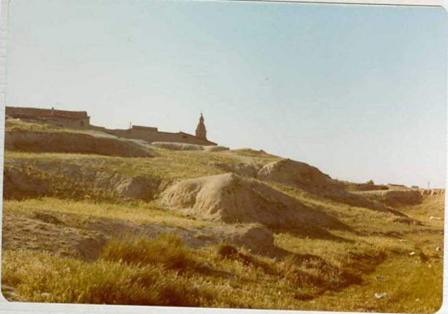
14/17-IB-EJ-601. Torrecilla de La Orden. Aspecto de las "areniscas de Cantalapiedra" (Vindoboniense Inferior), al SE de la población