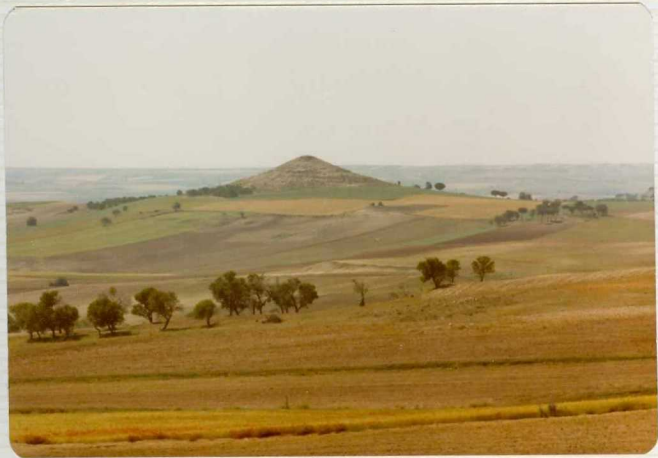
14/17-IB-EJ-630 Vadillo de Guareña. Chozo. En la cumbre - afloran los conglomerados basales del Gru p o Superior Paleógeno.