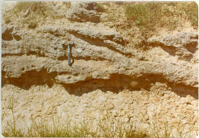
14/17-IB-EJ-617. Cañizal. Paleocanales en el Paleógeno.