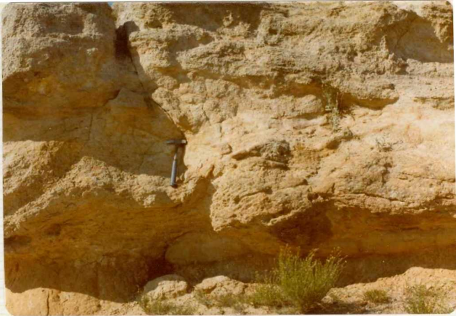
14/17-IB-EJ-610. Molino del Pico. Estratificación cruzada festoneada con huellas de carga. Oligoceno Inferior.