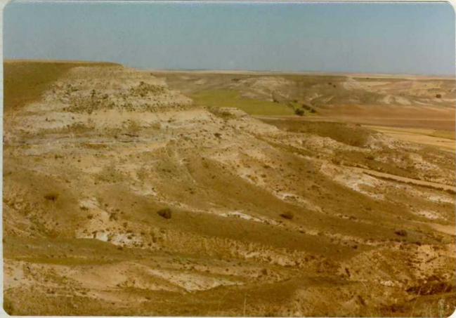
14/17-IB-EJ-609. Desde el cerro del Molino del Pico hacia el SE.