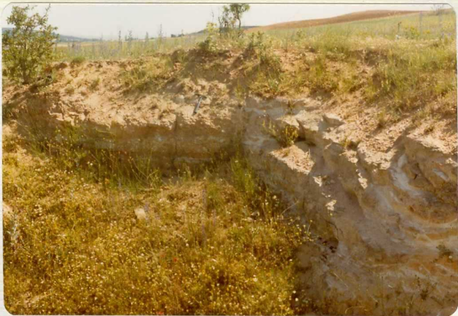
14/17-IB-EJ-619. Fuentesauco. Cantera de Los Silos. Pequeña frac tura en el Luteciense.