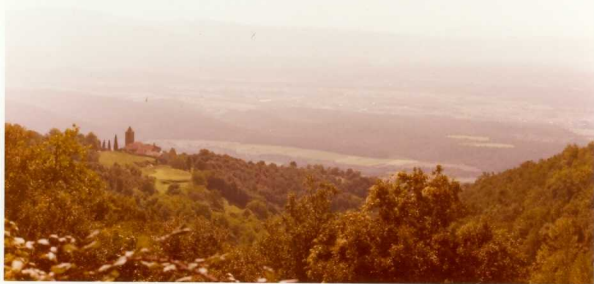
IM/FA/265 .- (Fuera de hoja) Una vista desde la carretera de Santa Fe del Montseny, de la Depresión del Vallés . Al fondo la Cordillera Litoral.