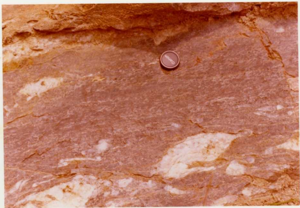
IM/FA/136 .- Gneis de cuarzo y feldespató al N. de Mataro.