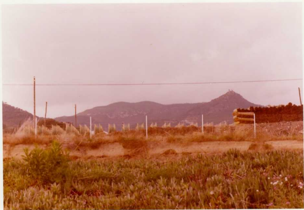
IM/FA/135 .- Cabrera de Mataro. Vista del dique porfídico de Cirera.