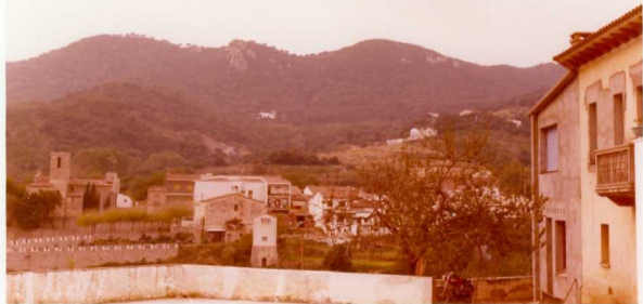
IM/FA/137 .- Vista desde Orrius del complejo leucogranítico de Castell Sellus.