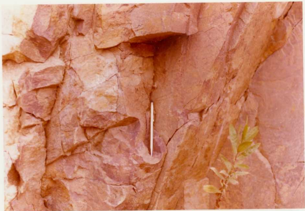
IM/OV/2082 .- Col del Bosch. Martorellas. Un aspecto de los materiales Ordovícicos.