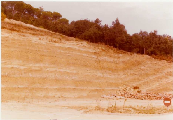
IM/FA/134 .- Un aspecto del Mioceno del Vallés, en la carretera Granollers - San Celoni.