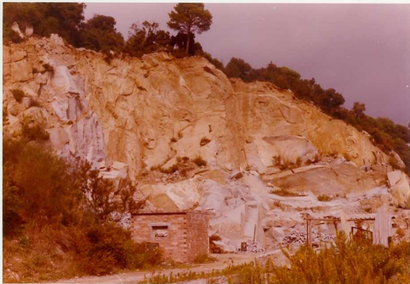
IM/FA/138 .- Orrius. Cantera de granito cerca de la hermita de S. Bartomeu.