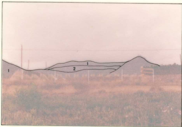
IM/FA/135 .- Cabrera de Mataro. Vista del dique porfídico de Cirera.