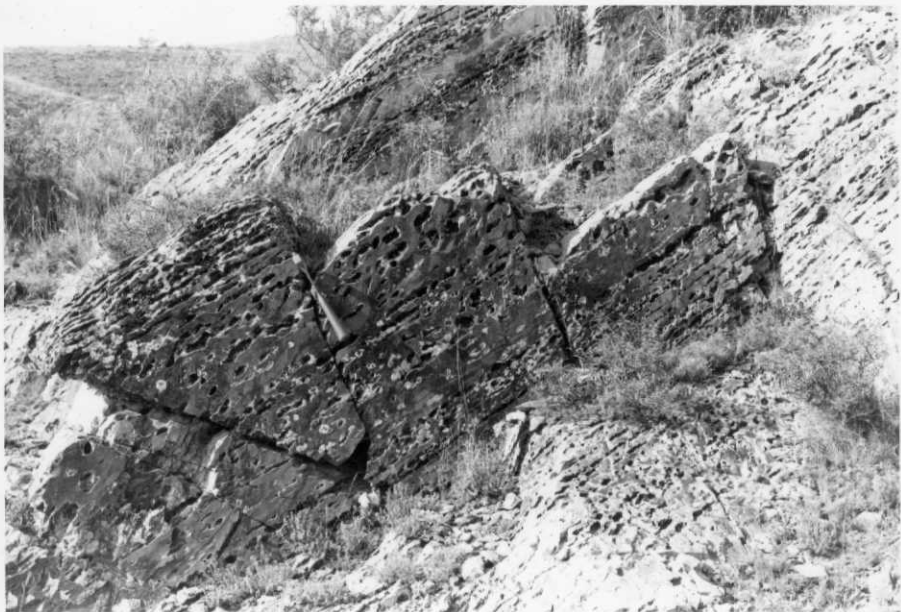
FOTO 12-EA-6802.- Aspecto noduloso de las pizarras de Murero, en las proximidades de Jarque.