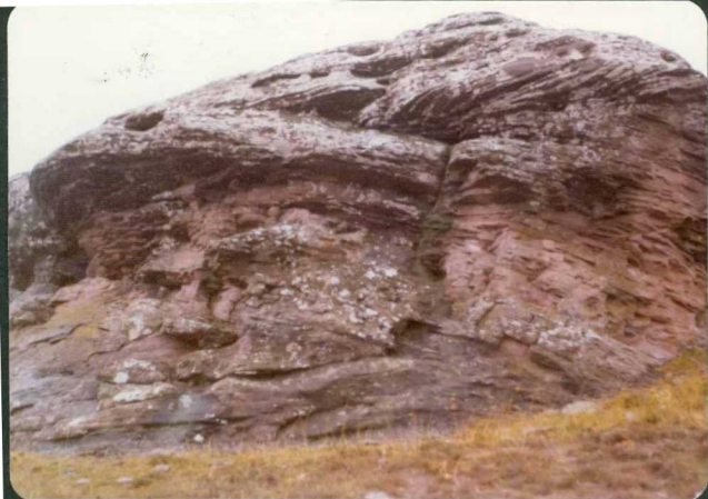
FOTO 8-JR-8.- Estratificación cruzada en las areniscas del Buntsandstein, al Norte de - Aranda de Moncayo.