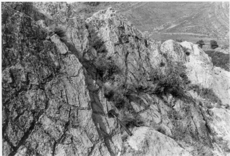
FOTO 11-EA-6801.- Grietas de retracción en las - margas del Muschelkalk inferior, en las proximidades de Illueca.