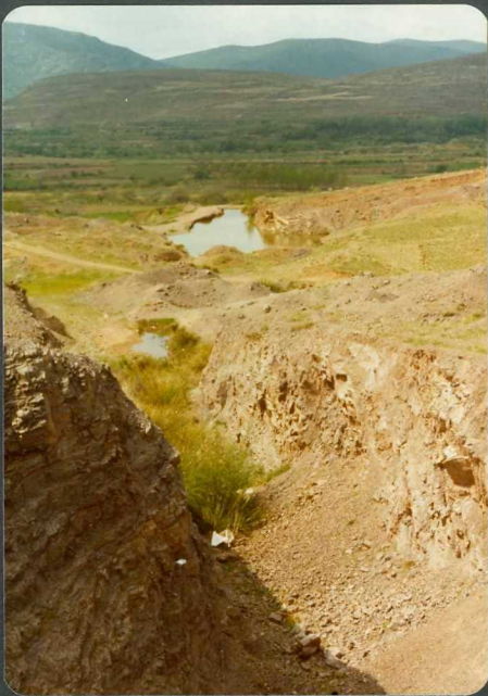
FOTO 13-EA-6803.- En primer término pizarras y cuar- citas del Cámbrico superior expuestas en - una corta de una pequeña mina de hierro. Al N.E. de Aranda de Moncayo.