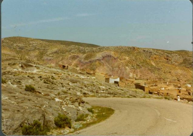
FOTO 19-EA-6809.- Panorámica del Triásico medio y superior, en la zona de Trasobares. Destacan las ofitas dentro del keuper.