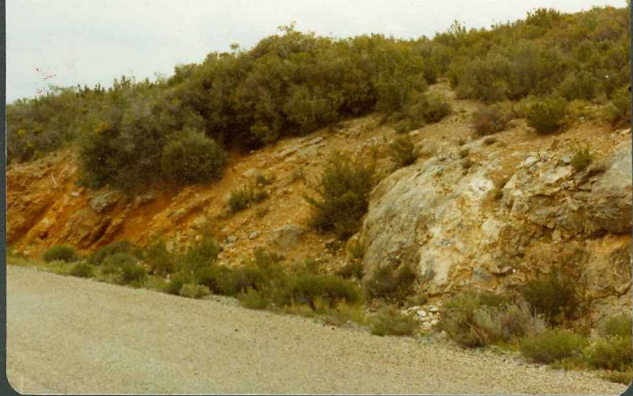
FOTO 20-EA-6810.- Discordancia entre los conglomerados terciarios y las calizas liásicas. Ctra. Tabuenca-La Tierga