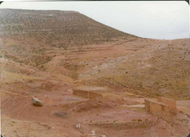
FOTO 4-JR-4.- Panorámica de la discordancia del Terciario sobre la Facies Keuper y las dolomías del Rethiense, en las proximidades de La Tierga.