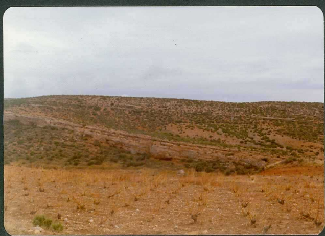
FOTO 1-JR-1.- Vista parcial de la discordancia - progresiva en los conglomerados terciarios Ctra. de Tabuenca -La Tierga.