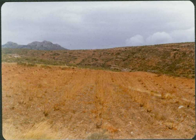
FOTO 2-JR-2.- Panorámica de la discordancia progresiva en los conglomerados terciarios. Ctra. de Tabuénca - La Tierga.