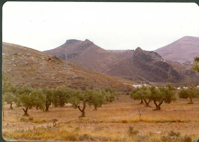
FOTO 6-JR-6.- Panorámica del Sinclinal fallado - de Illueca.