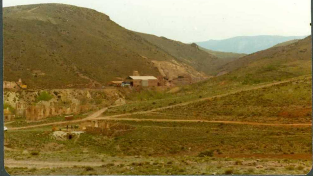
FOTO 17-EA-6807.- Mina de hierro en el Cámbrico inferior, en las proximidades de La Tierga - (Mina Sta. Rosa).