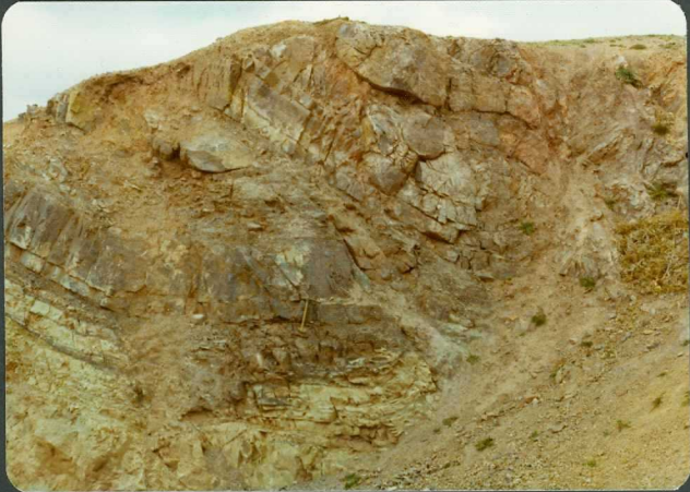
FOTO 14-EA-6804.- Estructuras en los materiales del Cámbrico Superior al N.E. de Aranda de Mon- cayo.