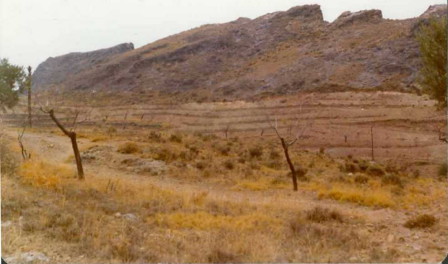
FOTO 7-JR-7.- Vista parcial de las dolomías del Muschelkalk en las proximidades de Illueca.