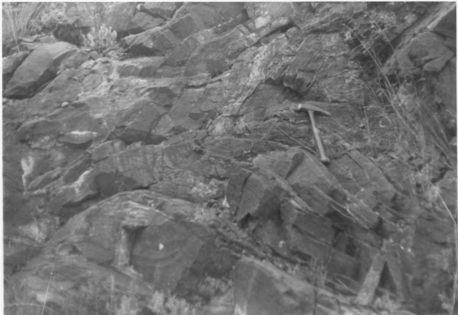
FOTO 10-AT-1001.- Detalle de los micropliegues en las dolomías del Cámbrico inferior (dolomías de Ribota), al Oeste de Nigüella.