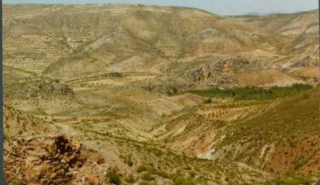
FOTO 18-EA-6808.- Panorámica del Terciario discor-- dante sobre el Triásico superior, en las - proximidades de La Tierga.