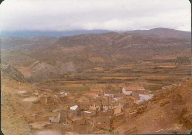
FOTO 5-JR-5.- Facies Keuper y Rhetiense al S.O. de La Tierga. En primer término La Tierga.