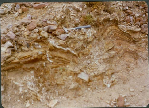
FOTO 9-JR-9.- Detalle de los micropliegues en las pizarras devónicas, en las proximidades de Nigüella.