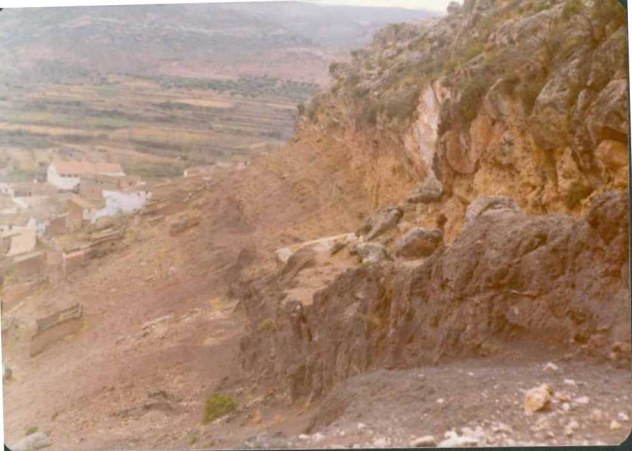
FOTO 3-JR-3.- Vista parcial del contacto de las dolomías del Rethiense con la Facies Kuiper, en las proximidades de La Tierga.