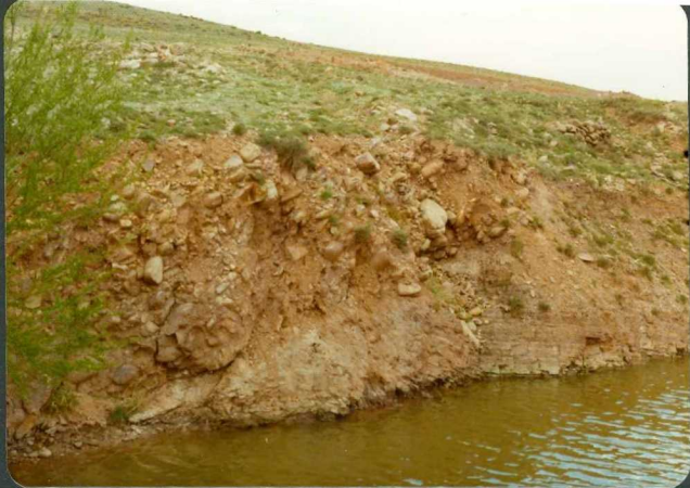
FOTO 16-EA-6806.- Conglomerado basal del Buntsandstein, dicordante sobre las pizarras del Cámbrico superior, al N.E. de Aranda de Moncayo.