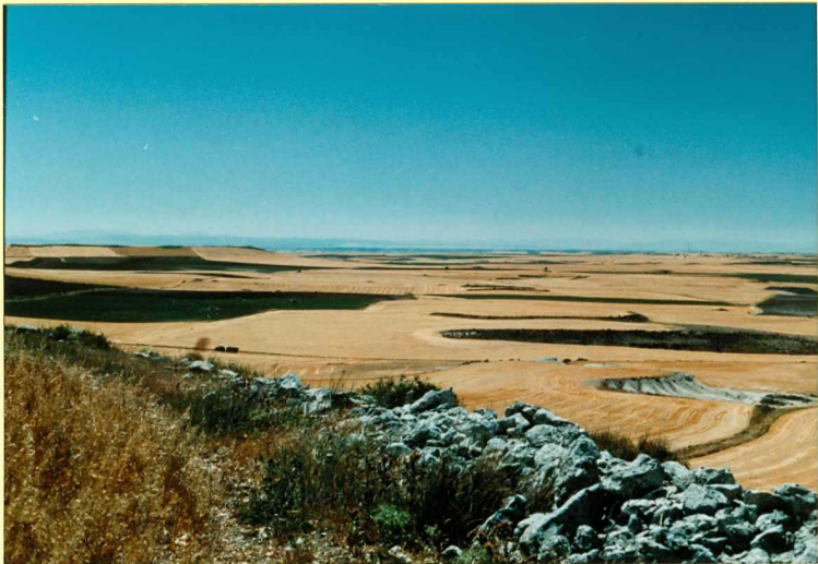
F-9120 Superficie de las Calizas inferiores del Páramo encajada en la Superficie del Páramo desde el Pico de la Virgen (Tórtolos de Esgueva) Cuaternario .