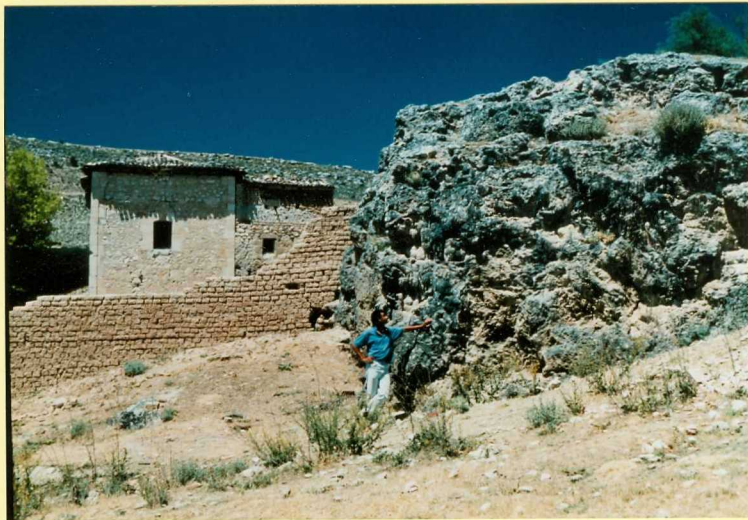
F-9104 Escarpe morfológico de la terraza de tobas y travertinos de Tórtoles. Puede observarse la presencia de "facies barrera" Cuaternario