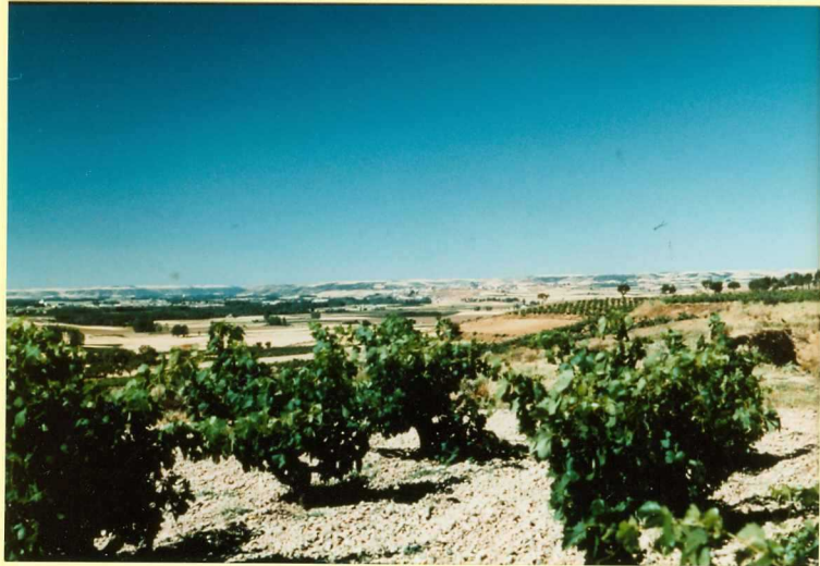
F-9118 Cultivo de vid en la campiña de La Horra sobre las arenas y gravas de los cuerpos canalizados de la unidad 2 Astaracense