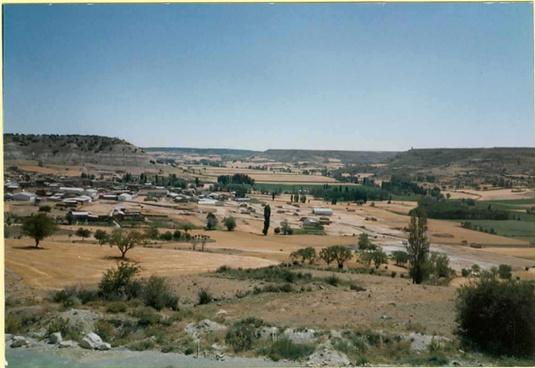
F-9101 Valle del Esgueva en Tórtoles, al fondo se observa la Superficie del Páramo