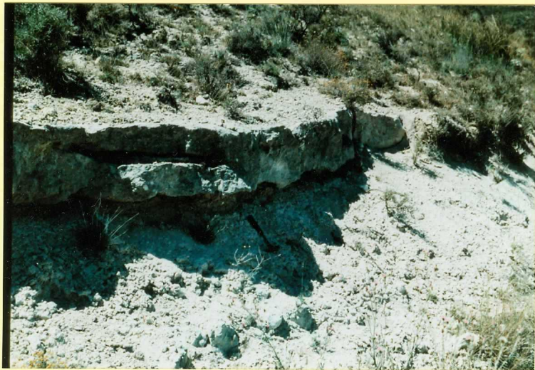
F-9109 Intercalación carbonatada (unidad 6) dentro de las Facies Cuestas (unidad 4) al sur de Tórtolos de Esgueva Astaraciense sup.