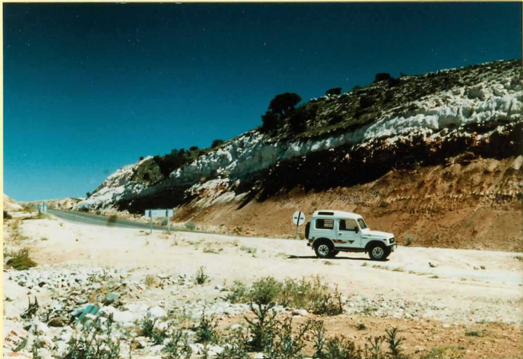
F-9107 Calizas superiores del Páramo (unidad 11) y Unidad detrítica basal del Ciclo superior (unidad 9) en la C.N. 619 al noroeste de Tórtolas de Esgueva Vallésense