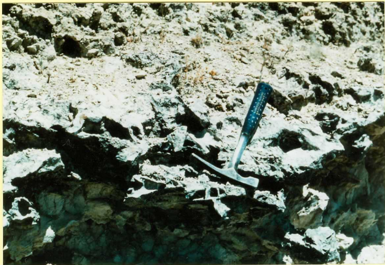
F-9111 Detalle de las carniolas y brechas del nivel carbonatado (unidad 7) situado al norte de Canillas de Esgueva Astaraeus sup - Vallensis inf?