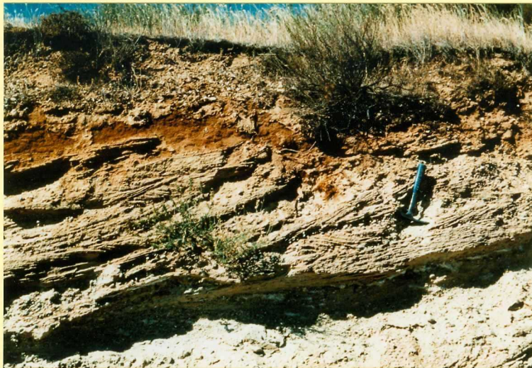
F-9116 Detalle de un canal (unidad 2) arenoso-conglomerático intercalado en la Unidad detrítica de Aranda al norte de Olmedillo de Roa. Se observa base canalizada neta y estratificación cruzada en surco y tabular Asteroceras ruy.