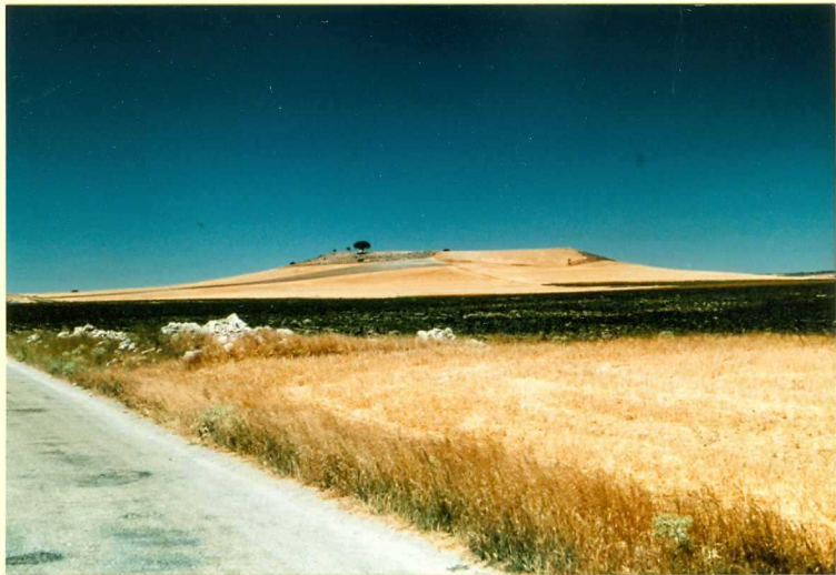
F-9112 Cerro del Otero (Encinas de Esgueva), relieve residual de la Superficie del Páramo Anterior