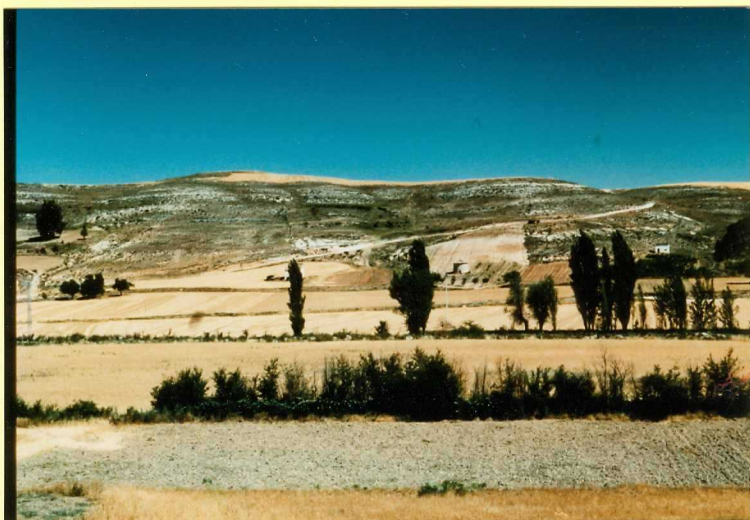
F-9113 Panorámica de la Unidad detrítica de Aranda (unidad 1) y de las Facies Cuestas (unidad 4) al norte de Villatuelda Astaraeense sup - Vallesense inf?