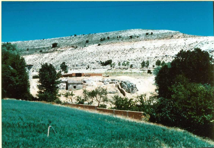
F-9103 Terraza colgada de tobas y travertinos (unidad 13) en Tórtoles de Esgueva Cuaternario