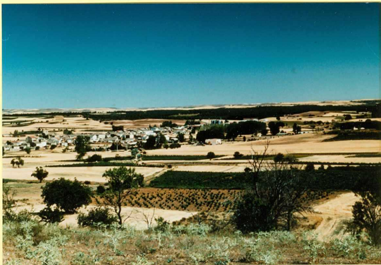
F-9117 Panorámica de la campiña de La Horra, modelada sobre materiales de la Unidad detrítica de Aranda