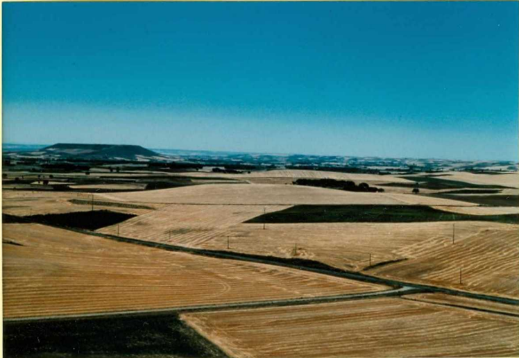
F-9119 Panorámica del Cerro Manvirgo desde el norte. Relieve residual de la Superficie del Páramo. Cuaternario?