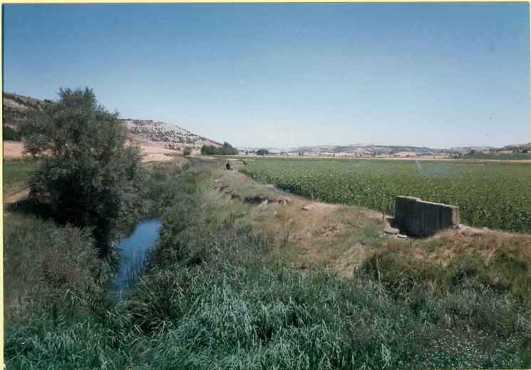
F-9100 Vista del Valle del Esgueva y su llanura de inundación en las inmediaciones de Encinas de Esgueva Cuaternario y Pleoceno.