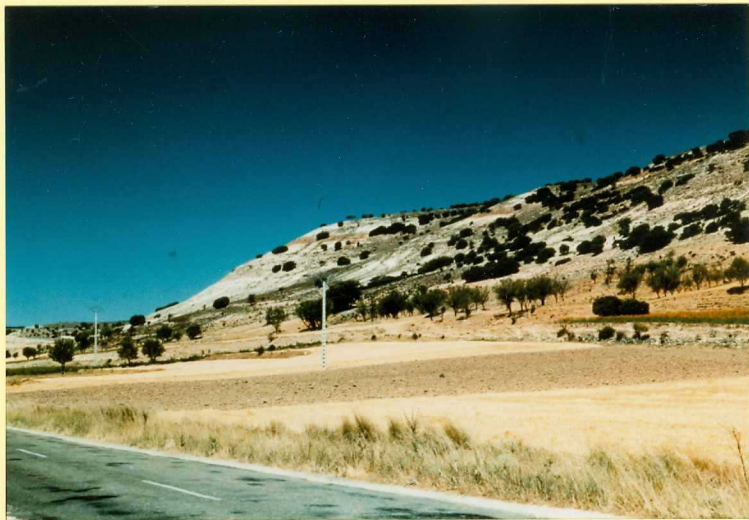
F-9106 Sucesión miocena de la Hoja en el Valle del Esgueva. De muro a techo: Unidad detrítica de Aranda (1), Facies Cuestas (4), Calizas inferiores del Páramo (7 y 8), Unidad detrítica basal del Ciclo superior del Páramo (9) y Calizas superiores del Páramo Astaracense - Vallesense