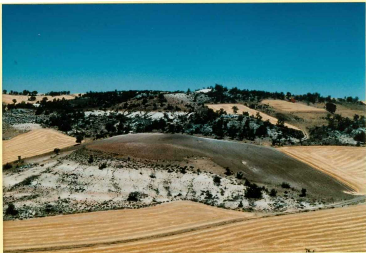
F-9114 Vista de las intercalaciones detríticas (unidad 5) de las Facies Cuestas (unidad 4) al norte de Olmedillo de Roa Astarcuense sup - Vallerense inf?