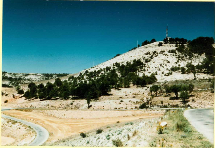
F-9115 Unidad detrítica de Aranda (unidad 1) y Facies Cuestas (unidad 4) en Encinas de Esgueva Actaronea nsp.