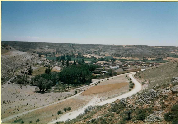
F-9105 Panorámica desde el norte de la terraza travertínica de Tórtoles. Al fondo se observa la superficie de las "Calizas superiores del Páramo" Cretácico y Mioceno sup.