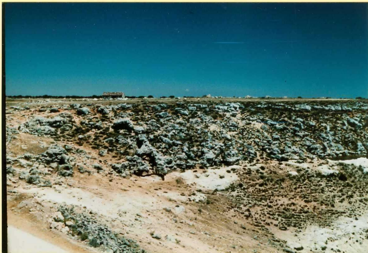
F-9102 Calizas (unidad 11) y unidad detrítica basal (9) del Ciclo superior del Páramo al norte de Tórtoles de Esgueva Vallésense