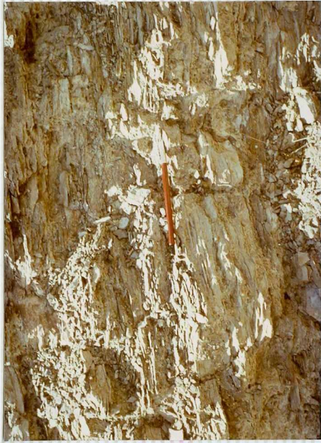
F-262. Detalle de la fotografía nº 1. Limolitas con laminación paralela.