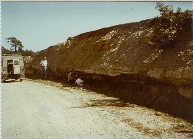
F - 261 Areniscas y Limolitas de la formación de Urbión al norte de Regumiel.