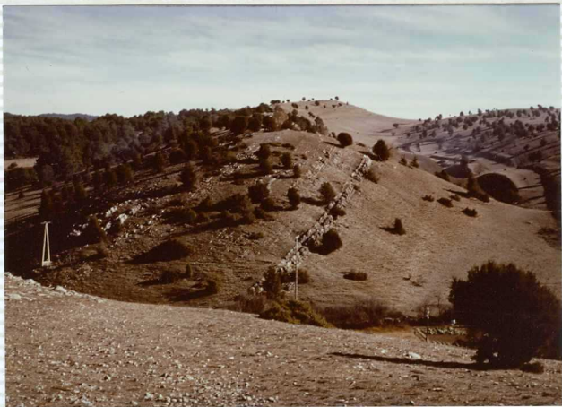
F-273. Calizas del Dogger sobre margas del Toarciense.