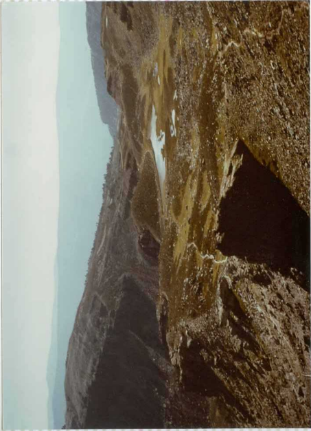
F-270. Vista de la Laguna Helada.