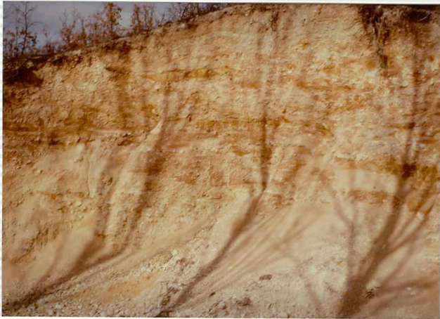
F-280. Terraza cuaternaria al Sur de Palacios de la Sierra.