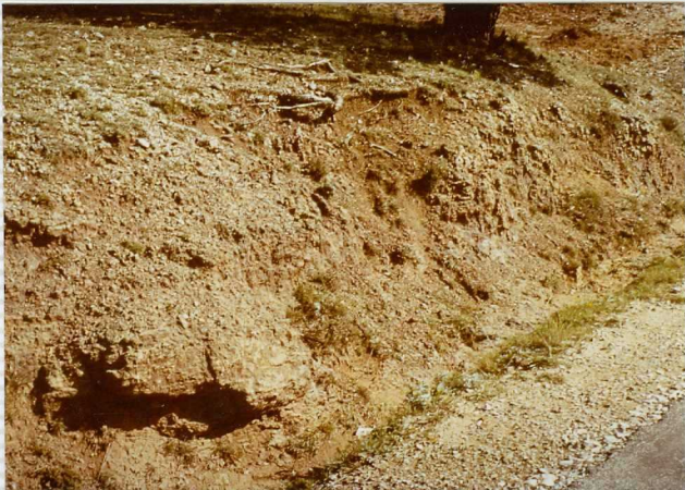
F-267. Limolitas de la formación Urbión.