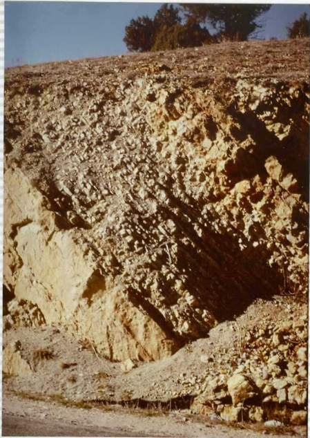
F-274. Margo-calizas del Aalenienense.