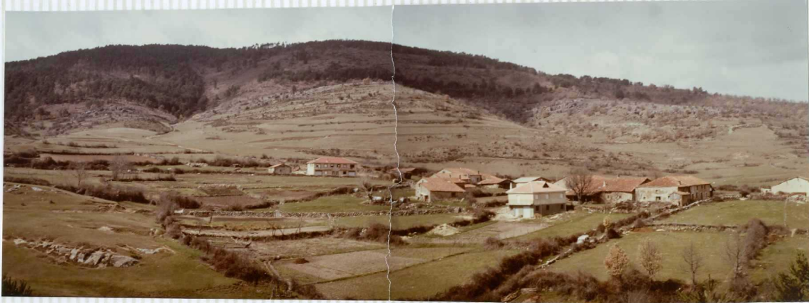
F-276. Panorámica del Jurásico de Canicosa de la Sierra.