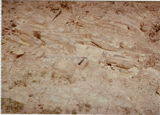
F-277. Pizarras silíceas del Cambriano.