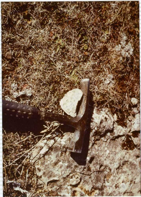
F-271. Dolomías brechoides del Rethiense-Hettangiense.