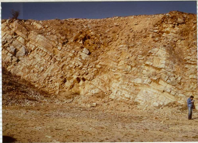
F-272. Calizas tableadas del Pliensbaquiense