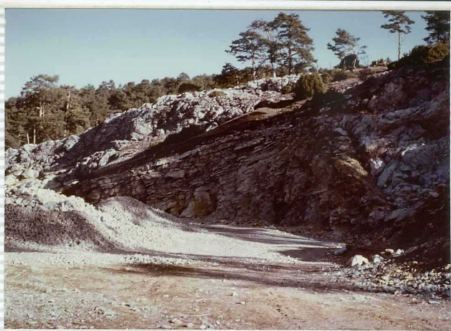
F-279. Cantera de calizas del Bajociense.