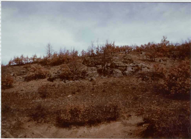
F-278. Afloramiento de bancos cuarcíticos cámbricos.