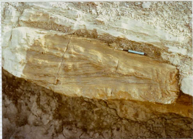
F-264. Detalle del banco arenisco de la fotografía nº 1: Estratificación cruzada de bajo ángulo.