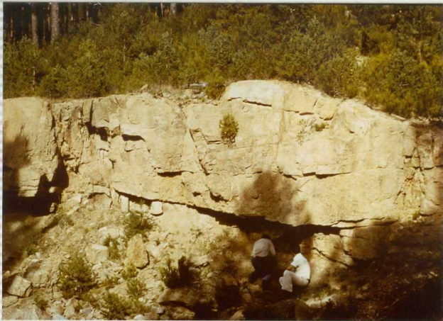
F-266. Estratificación lenticular de la for mación Urbión al Norte de Duruelo. Banco areniscoso.