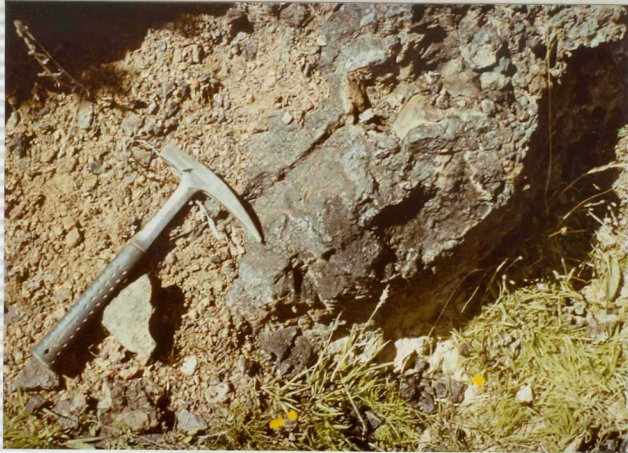
F-268. Detalle de la impregnación asfáltica en las limolitas de la formación Urbión.