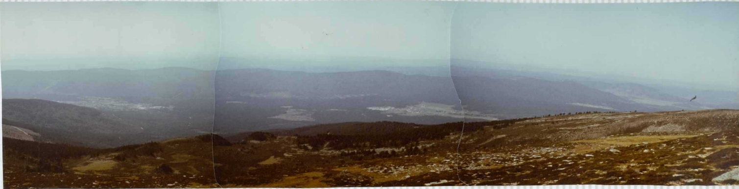
F-265. Panorámica del valle Duruelo-Regumiel- Covaleda.