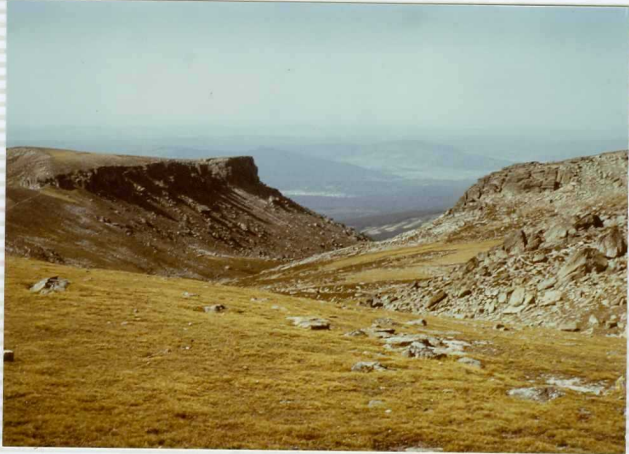
F-269. Morrena y circo glacial al sur de los Picos de Urbión.