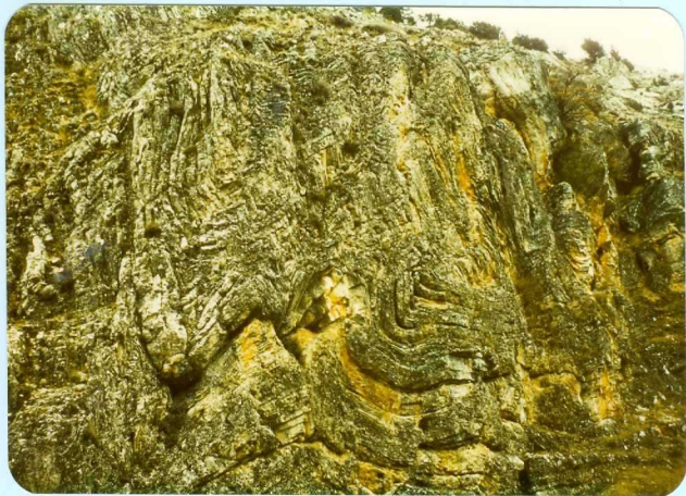
304 Dogger replegado al Sur de la ermita de Ntra. Sra. de Brezales.