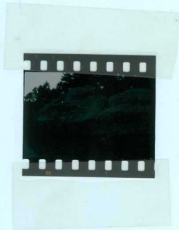
305 Areniscas y gravas del "Grupo Urbión" al Norte de la ermita de La Pinareja.