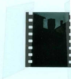
307 Juniperus silicificado del Weald terminal, en el pueblo de Hacinas.