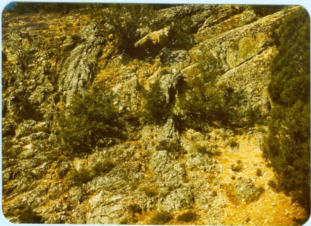
309 Pliegue en rodilla del Santoniense en Arauzo de Miel.