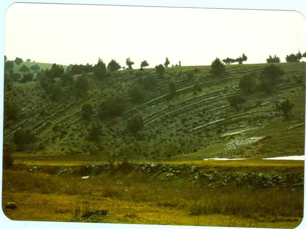
301 Pliensbaquiense margoso de Moncalvillo.