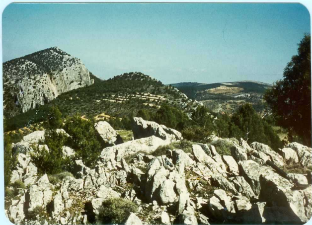
310 Senonense vertical de La Yecla.