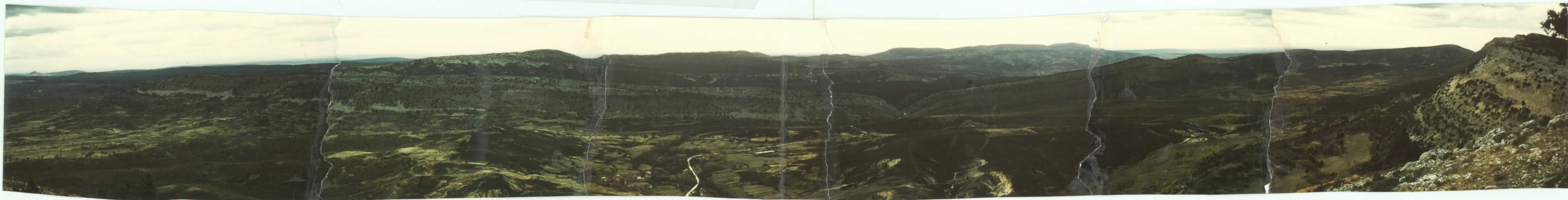
312 En primer término la Formación Utrillas y al fondo el Neocretáceo de la meseta del Carazo.