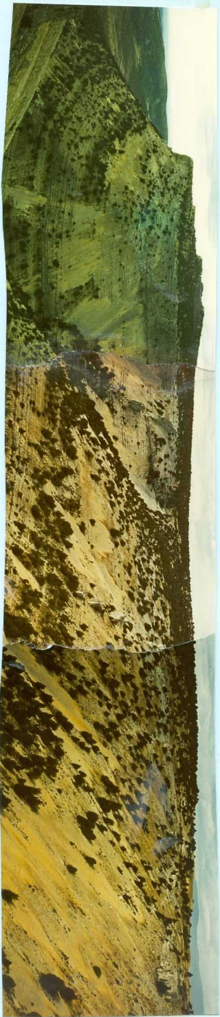
311 Suave sinclinal cretácico en la meseta de San Carlos.