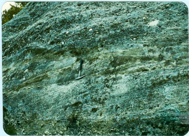
306 Estratificación cruzada en las areniscas del "Grupo de Urbión".