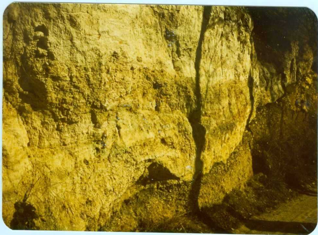
315 Terraza travertínica del río Mataviejas al Norte de La Yecla.