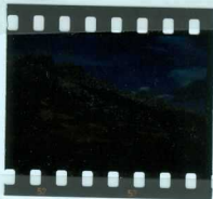
308 Serie cretácica coronada por calizas del Santoniense al Norte de Peñacoba