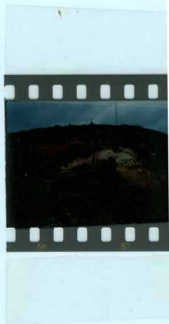
314 Mioceno discordante conglomerático sobre Garumnense blanquecino, próximo al vértice de San Martín.