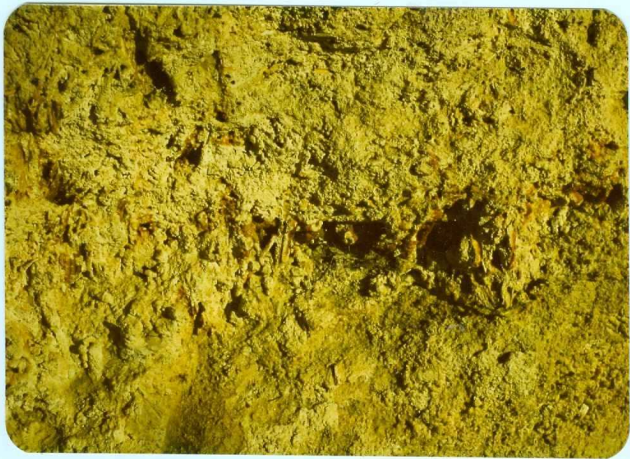
316 Detalle del travertino.