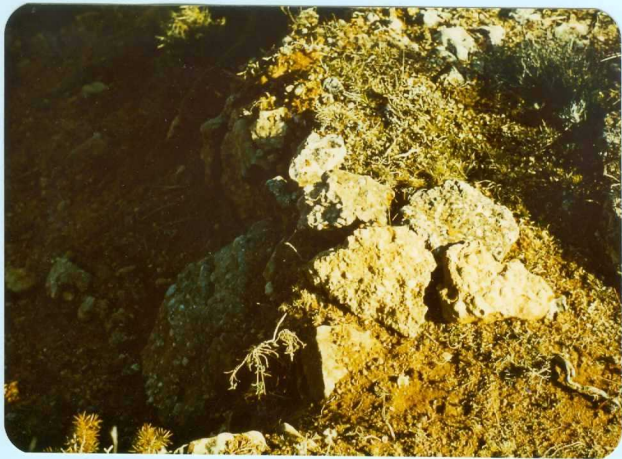
313 Pisolitos del Garumnense cerca de Arauzo de Miel.