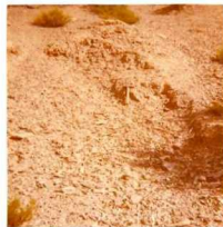
08-12/IB-JZ-773.- Pizarras azules, muy trituradas, de la Serie Verde (S-D), al E de Campobeceros.