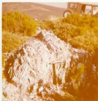
08-12/IB-JZ-769.- Repliegues que presenta un pequeño lentejón de cuarcitas, en el tramo de ampelitas y li ditas (S-D p,ld) de la base del Silúrico.