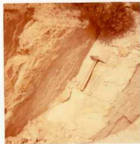
08-12/IB-JZ-782.- Metavulcanita (Traquita v^T ) al NE de la loca lidad de Pedroso.