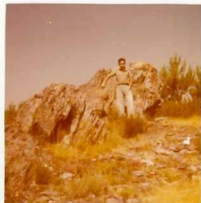
08-12/IB-JZ-764.- Crestón de Liditas, (S-D 1d) dentro de la Serie Verde Silúrica-Devónica