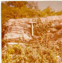
08-12/IB-JZ-767.- Caliza Silúrica-Devónica (S-D c), que forma el pequeño lentejón al SE de Cerdedelo.