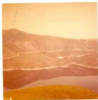
08-12/IB-JZ-780.- Panorámica de las alternancias del Arenig (O 1 q) en el lodo Norte de la Presa de las Portas.