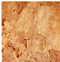
08-12/IB-JZ-776.- Metaconglomerado (S-D cg) Silúrico-Devónico, a 100 m al Este del anterior.