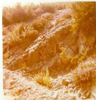
08-12/IB-JZ-774.- Grauvacas verdes, muy típicas de la Serie Verde Silúrico-Devónico (S-D), con disyunción paralelepípedica "patatas fritas" al -- Oeste de Venta de la Capilla.