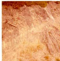
08-12/IB-JZ-781.- Kink-band, en las pizarras gris-azuladas del Ordovícico Medio-Superior ( O_{2-3} ), cerca de la fractura que separa el Ordovícico del Silúrico-Devónico, en el lugar de "Da Figueira - de burro".