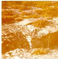
08-12/IB-JZ-770.- Grauvacas verdes de la Serie Verde (S-D) -- con disyunción paralepipédica "Patatas fritas" al NO de Porto Camba.