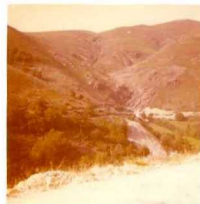
08-12/IB-JZ-778.- Panorámica tomada de NE al SO del contacto del granito con las alternancias de cuarcitas y pizarras del Arening ( O_{10}q ) cerca de la Presa de la Edrada.