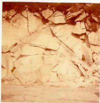
08-12/IB-JZ-777.- Granito de dos micas \begin{matrix} b \\ 2-3 \end{matrix} \begin{matrix} 2 \\ 6 \text{ m} \end{matrix} en el extremo NE de la Hoja, al N de la presa de las Portas.