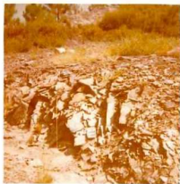
08-12/IB-JZ-763.- Pizarras azules (S-D) de la Serie Verde Si lurica-Devonica.