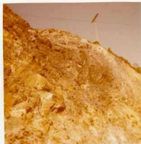
08-12/IB-JZ-765.- Tramo de pizarras ampelíticas (S-D ld) con algunos bancos centimétricos de líditas, - en el flanco oriental del gran Sinclinorio de Verín.