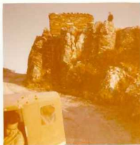
08-12/IB-JZ-771.- Cuarcitas (S-D q_3 ) de la Serie de pizarras con cuarcitas lentejonares.