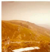
08-12/IB-JZ-768.- Panorámica desde el N de la Hoja, en la que se aprecian las Pizarras gris-azuladas del Ordovícico Medio-Superior ( O_{2-3} ) formando crestones encima de las alternancias de cuarcitas y pizarras del Arenig ( O_1 ), que no destacan en el relieve.