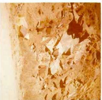
08-12/IB-JZ-766.- Metabasita (E) en la carretera de Laza a Cerdedelo.