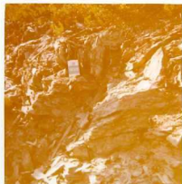
08-12/IB-JZ-772.- Pliegues de tercera fase en las grauwacas de la Serie Verde (S-D), al S de Porto Cam ba .