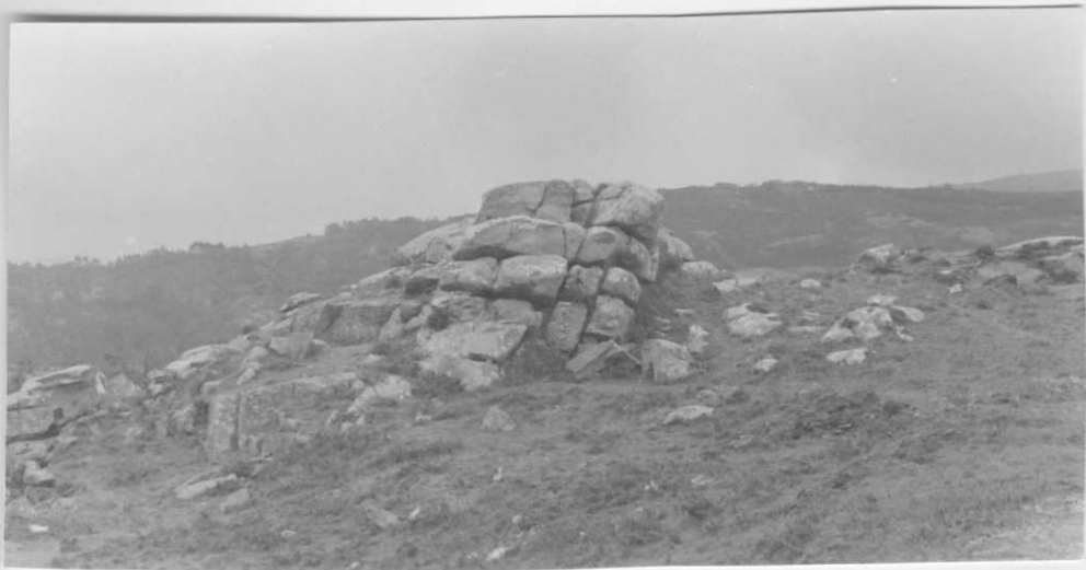
Estación 89, Hoja 03-12 (OYA) Diaclasado típico de los granitos de dos micas deformados W a la izquierda.