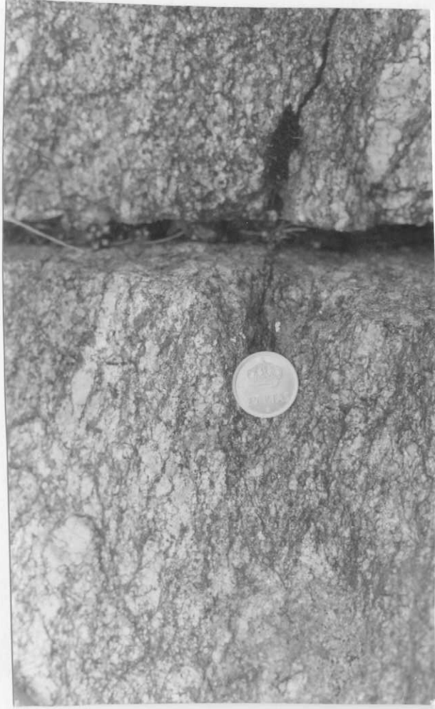
Estación 12. Hoja 03-12 (OYA) Aspecto neísico en los granitos orientados