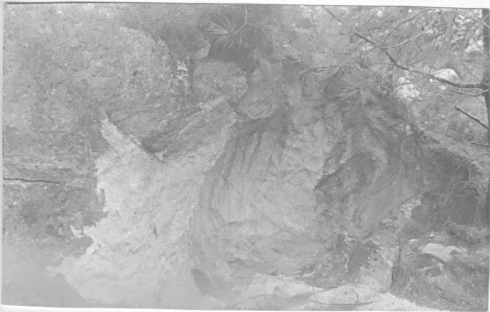
Estación 43. Hoja 03-12 (OYA) Explotación de un lehm granítico para arenas.