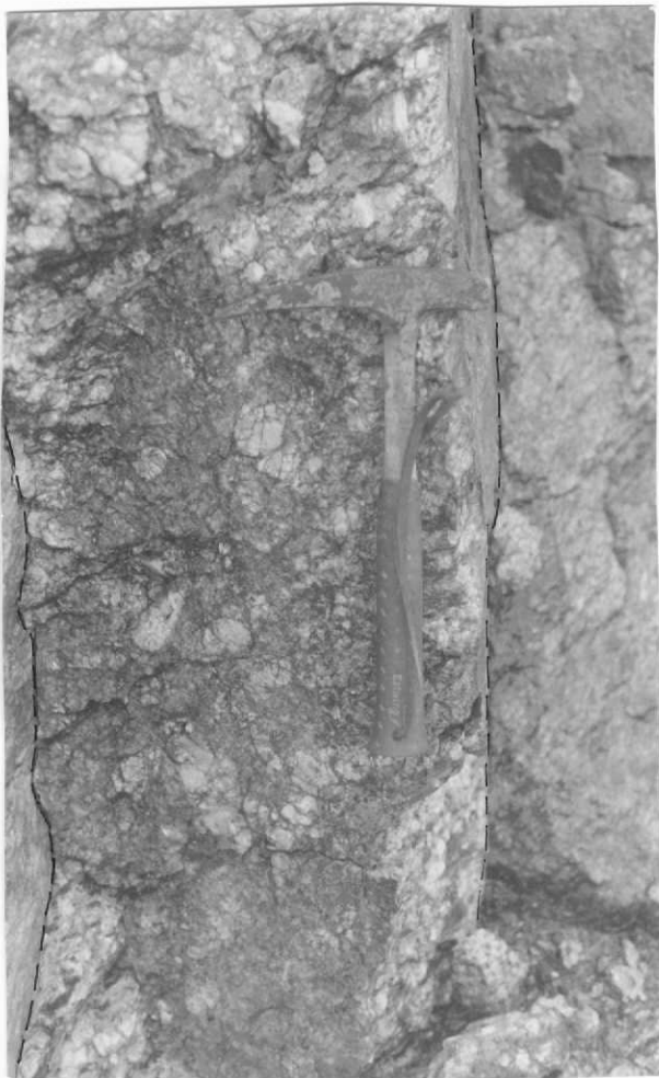
Estación 65. Hoja 03-12 (OYA) Dique de pegmatita afectado por S 1