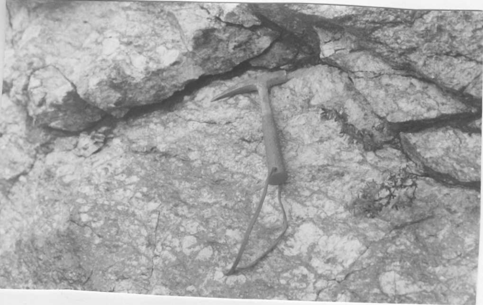
Estación 58. Hoja 03-12 (OYA) Vena pegmatítica filonitizada por F 1