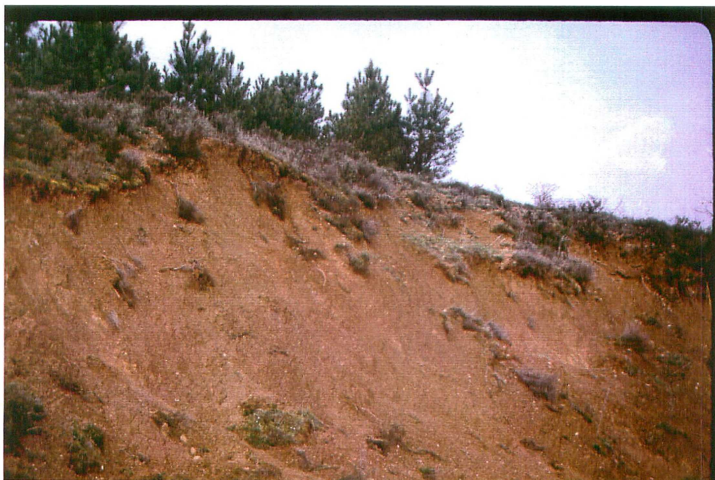
F. 9069. Detalle de la foto anterior. Astaracense sup - Vallense inf