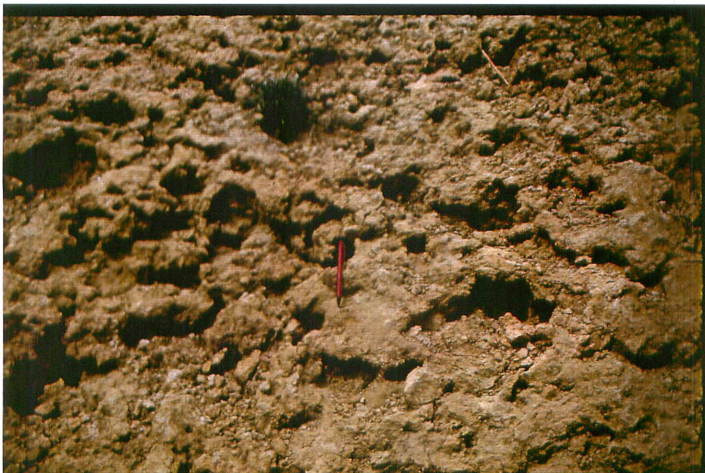
F. 9061. Detalle del proceso de edafización anterior. Astaroscience