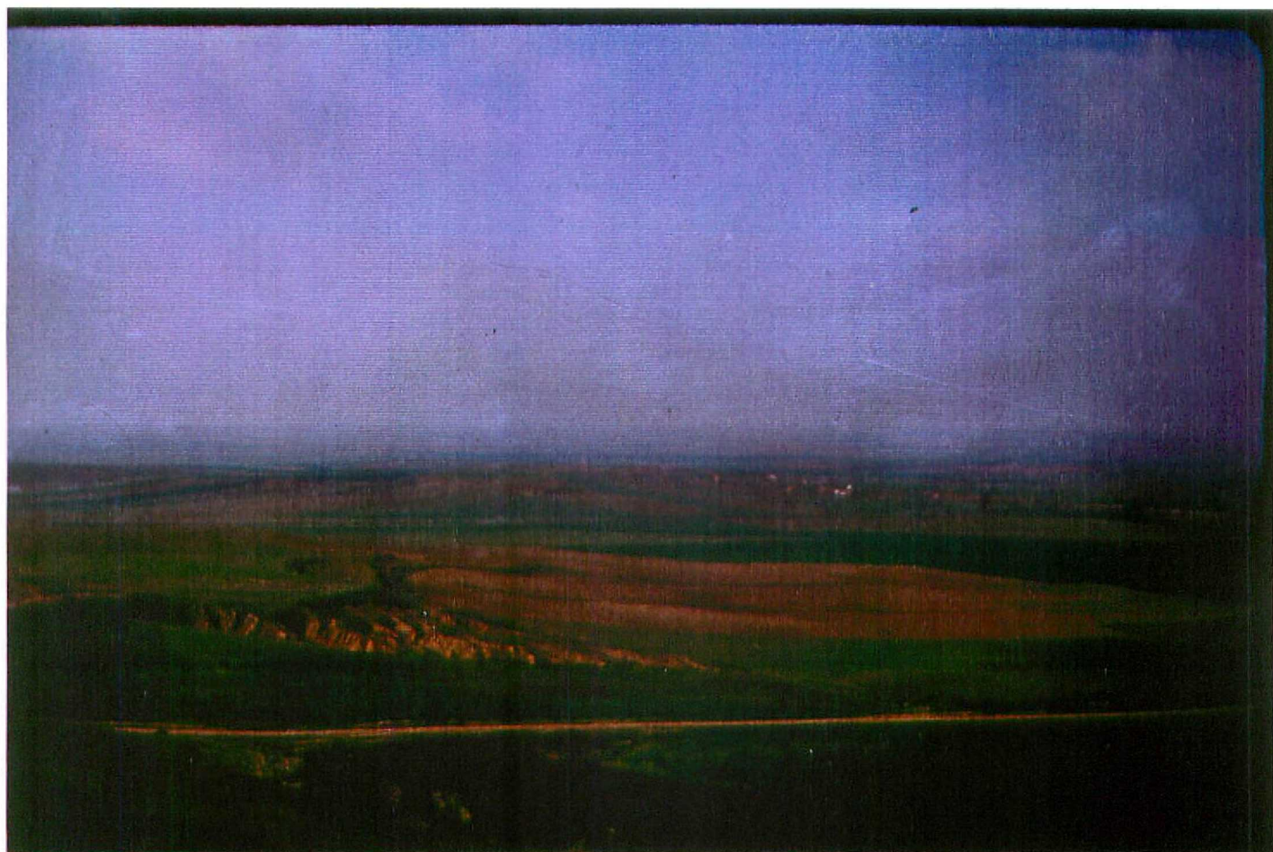
F.9058. Valle del Pisuerga. Vista general de las "Facies Tierra de Campos" (Unidad 1). Astavaciense .