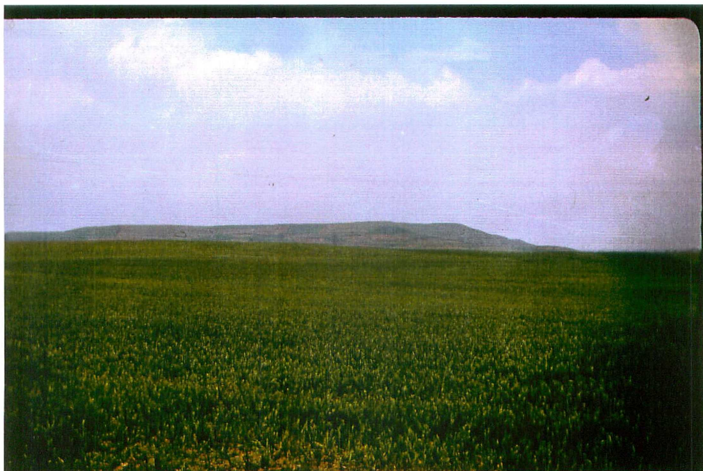
F. 9078. Vista general de los niveles de terrazas medias y altas en la confluencia del Pisuerga y Valdavia. Cuaternario