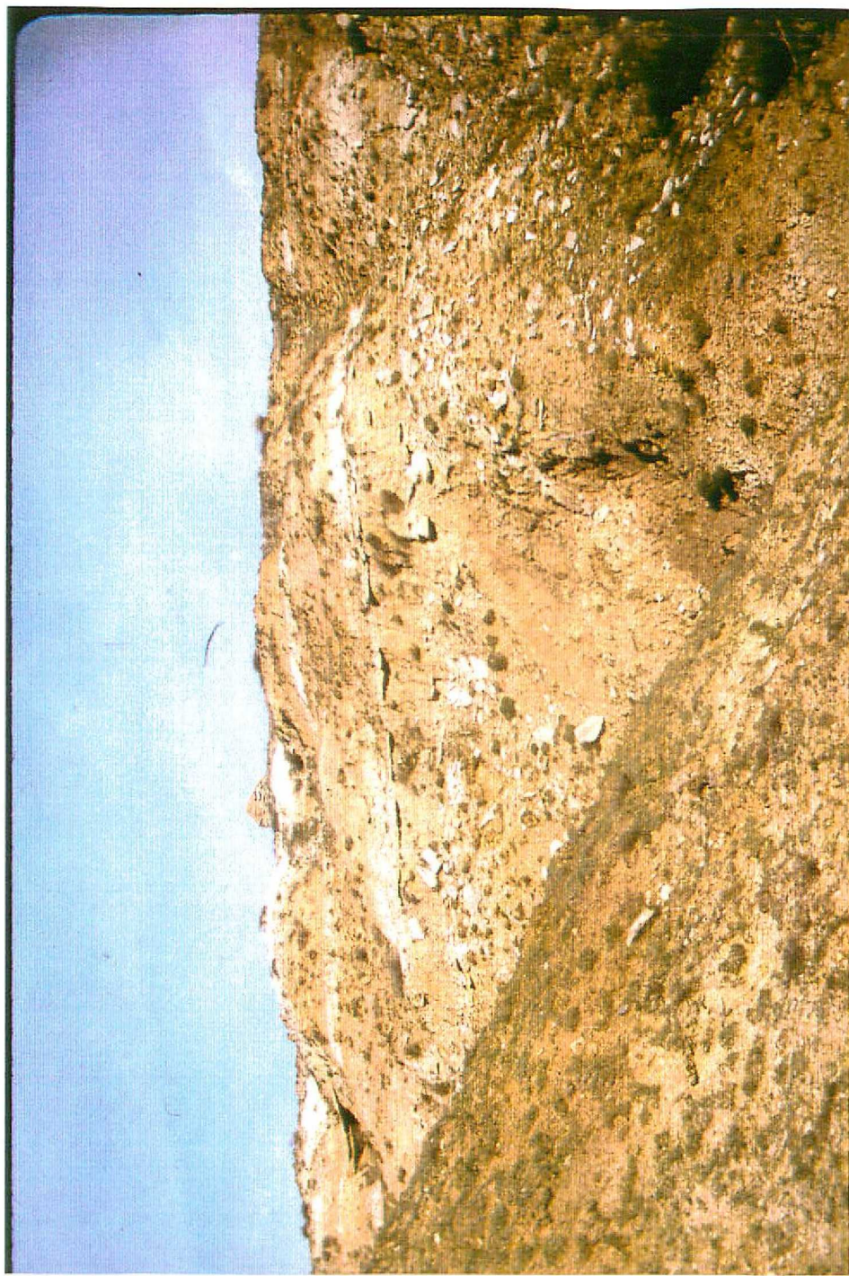
F. 9074. Secuencias detrítico-carbonatadas. Unidad 6. Astavanan sup-Vallesana inf