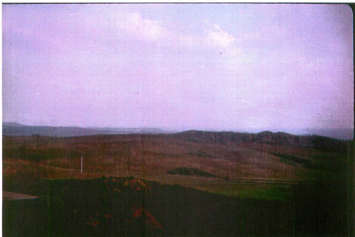
F. 9068. Vista general de los fangos ocres de las "Facies de la Serna" al norte de la Hoja. Astaracense mf. - Vallesiense mf.