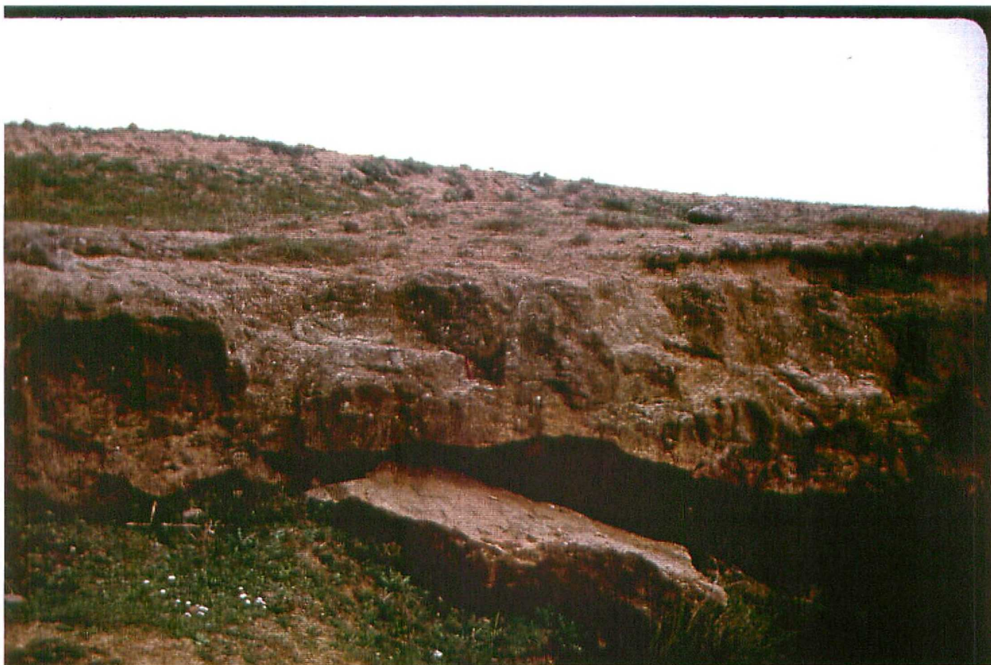
F. 9067. Canal Cementerio de Osorno. Unidad 5. Astavaciense sup.