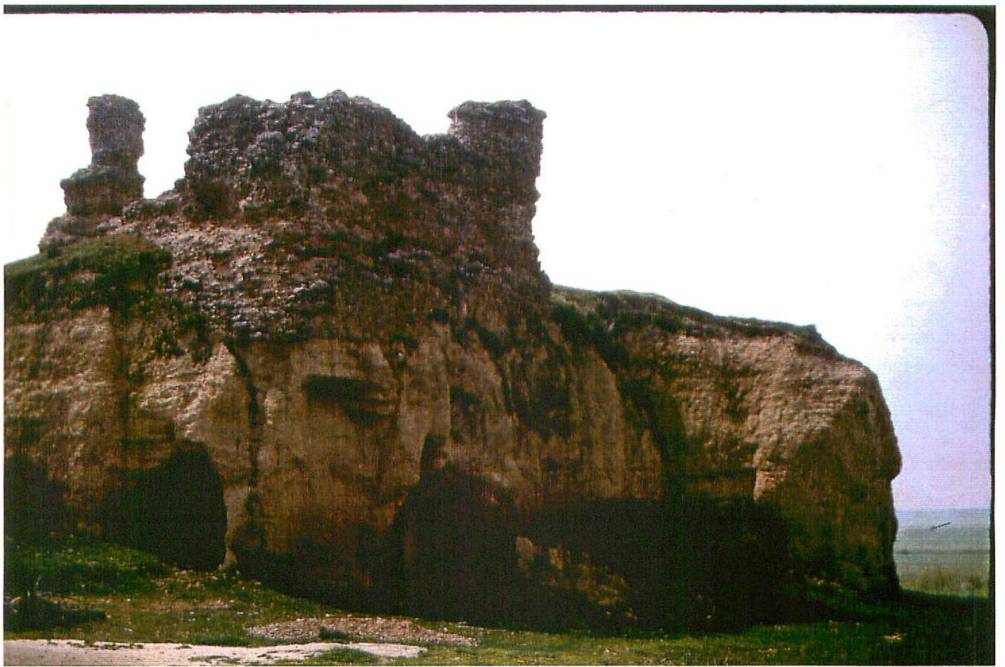
F. 9065. Canal de base de la Unidad 5. Castrillo de Villadiego. Astavacense sup.