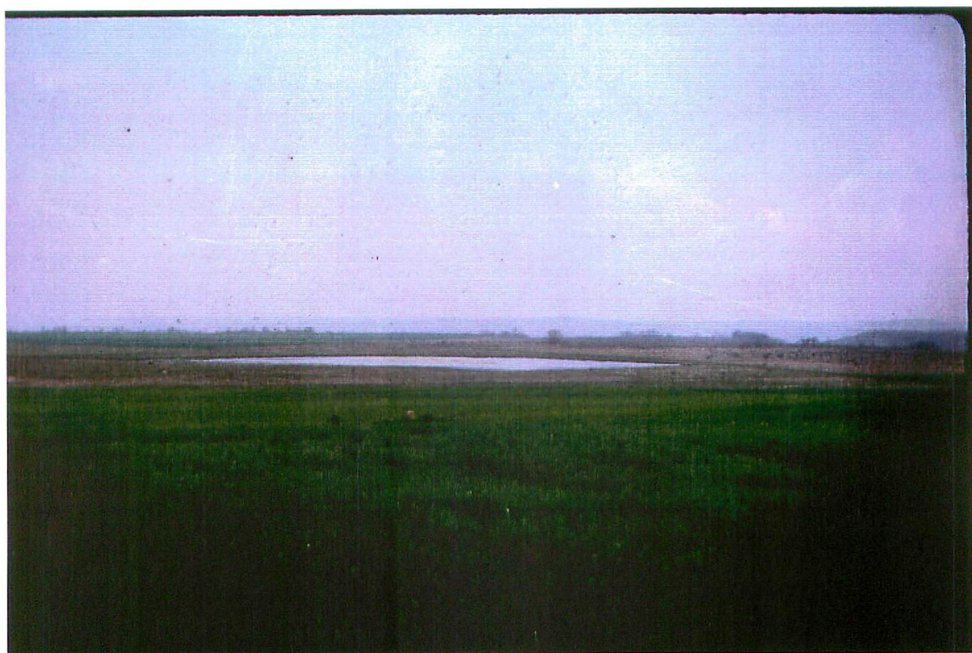
F. 9084. Zonas con drenaje deficiente desarrolladas en las terrazas altas de la margen derecha del río Pisuerga. Cuaternario