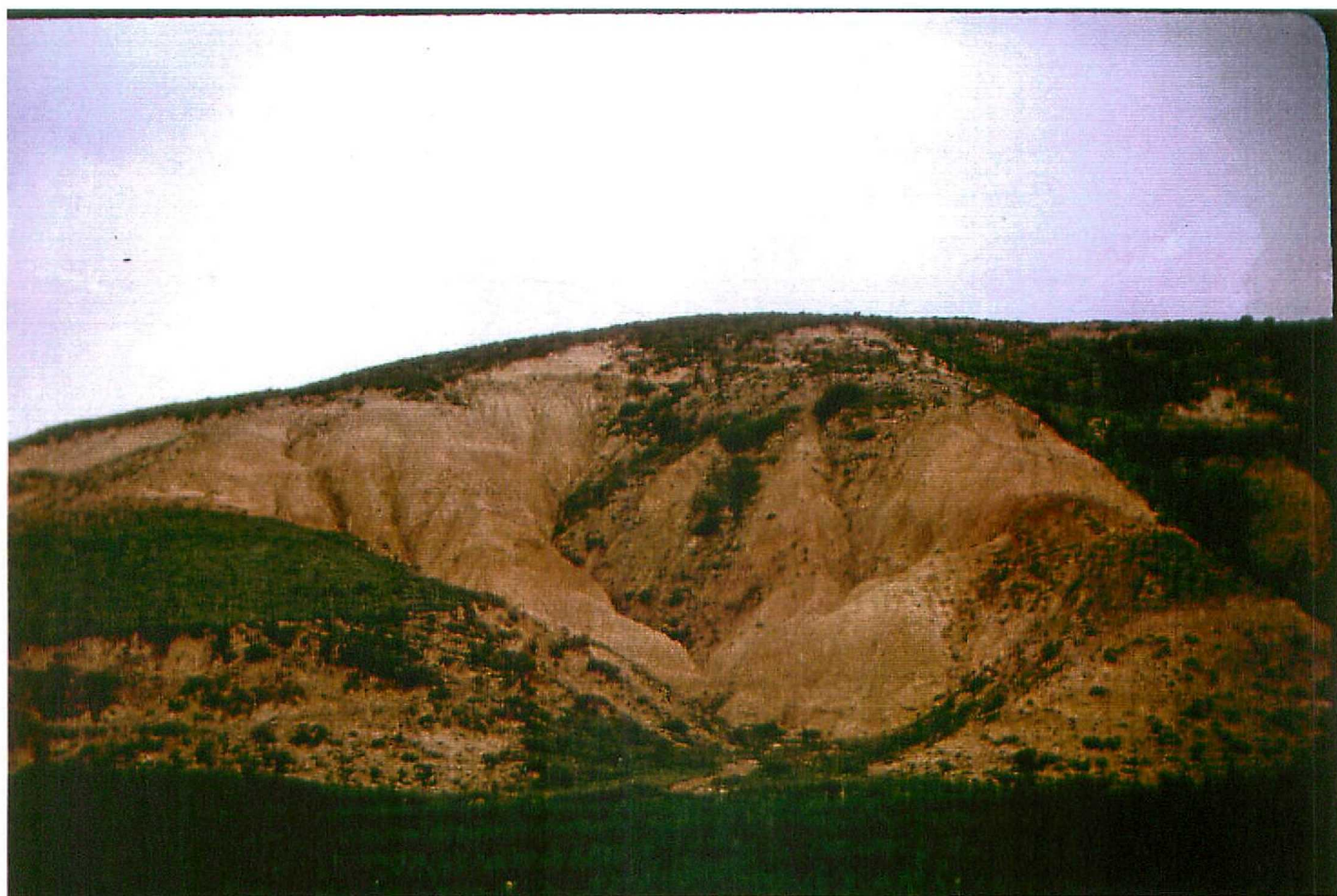
F. 9063. Aspecto característico de las "Facies de la Serna" (Unidad 5). Abia de las Torres. Astavaciense sup - Vallesiense inf