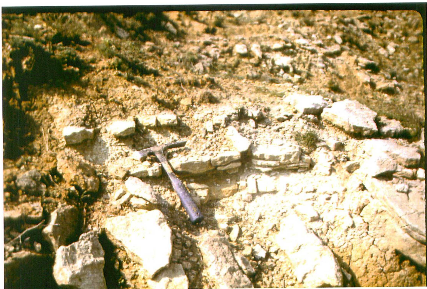
F. 9075. Detalle de las calizas de la foto anterior. Astaraceras rep - Vallesense inf