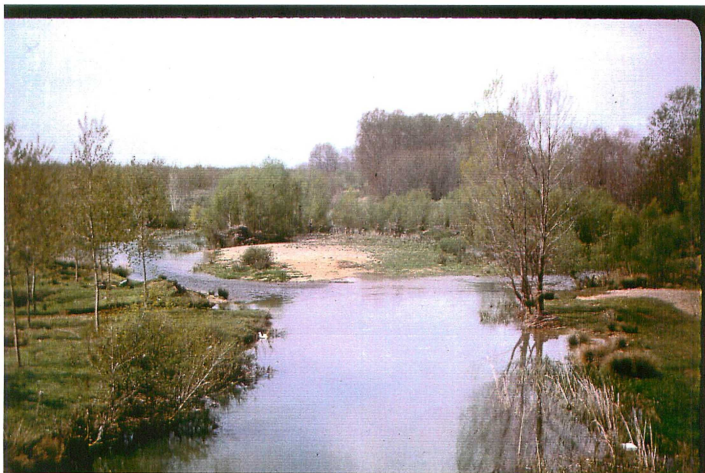
F. 9085. El Valdavia a su paso por Osorno. Holoceno (Cuaternario)