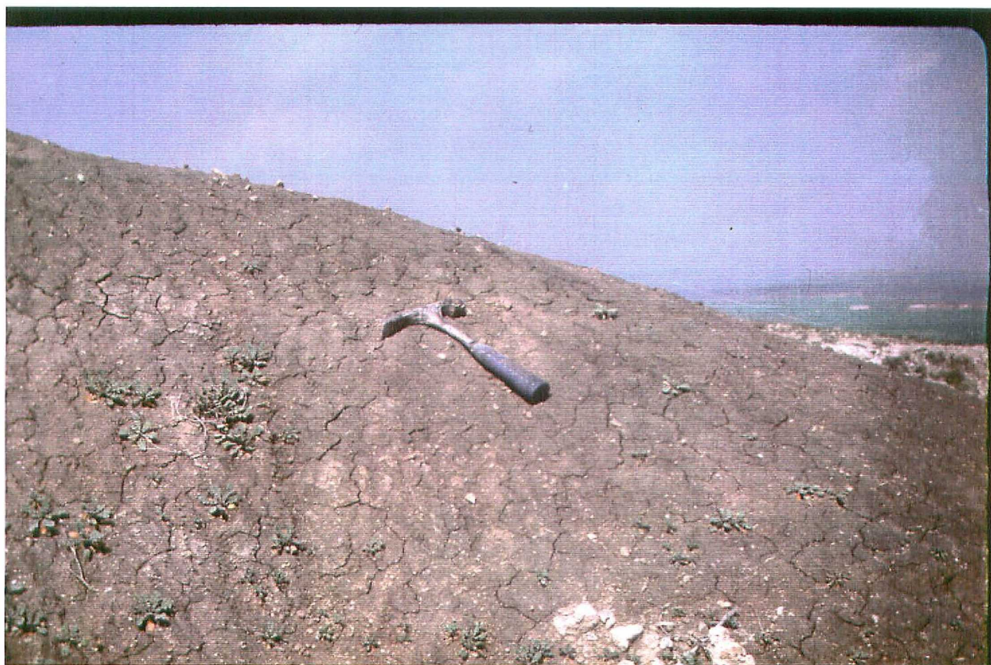
F. 9073. Arcillas carbonosas en la Unidad 6. Astaraceras nup.