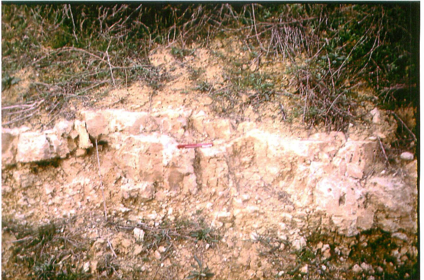
F. 9060. Procesos edáficos afectando a un relleno de canal Castrillo de Villadiego (Unidad 1). Astaraciense