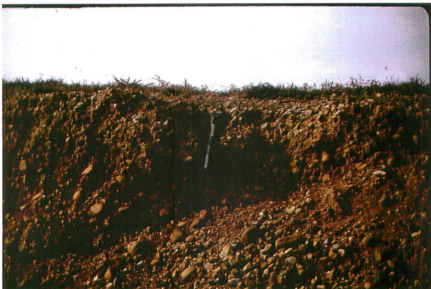
F. 9083. Detalle de las gravas de las terrazas bajas. Holoceno (Cuaternario)