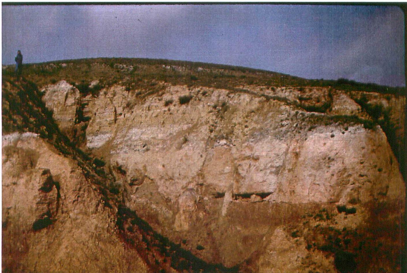
F. 9071. Detalle de la parte inferior de la Unidad 6. Lóbulos deltaicos. Astaracense superior.