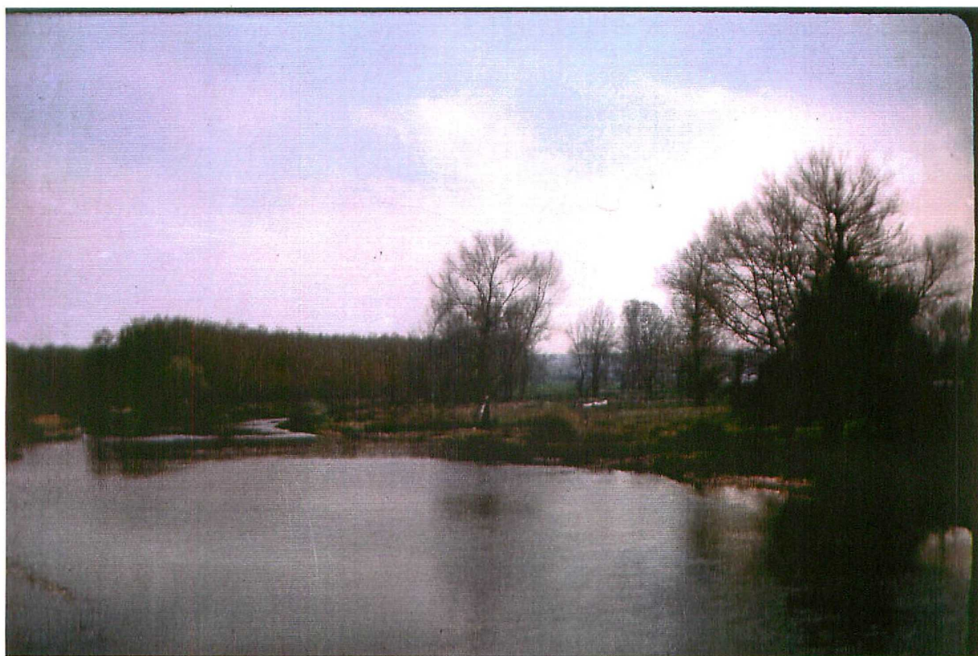
F. 9086. Curso medio del Pisuerga. Holoceno.