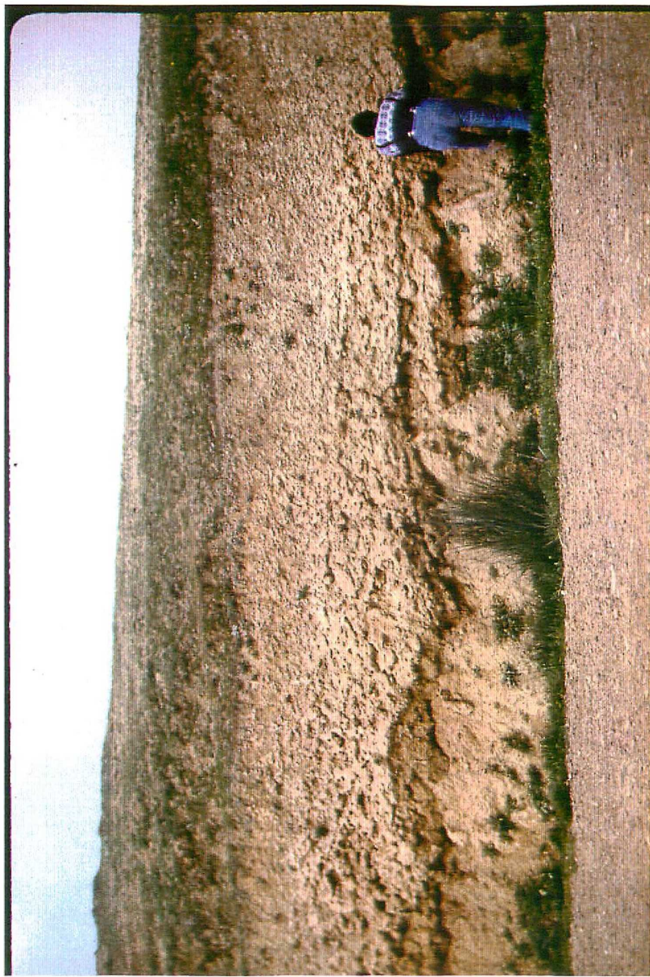
F. 9059. Suelos calcimorfos desarrollados a techo de "Facies Tierra de Campos" (Unidad 2). Astavaciense