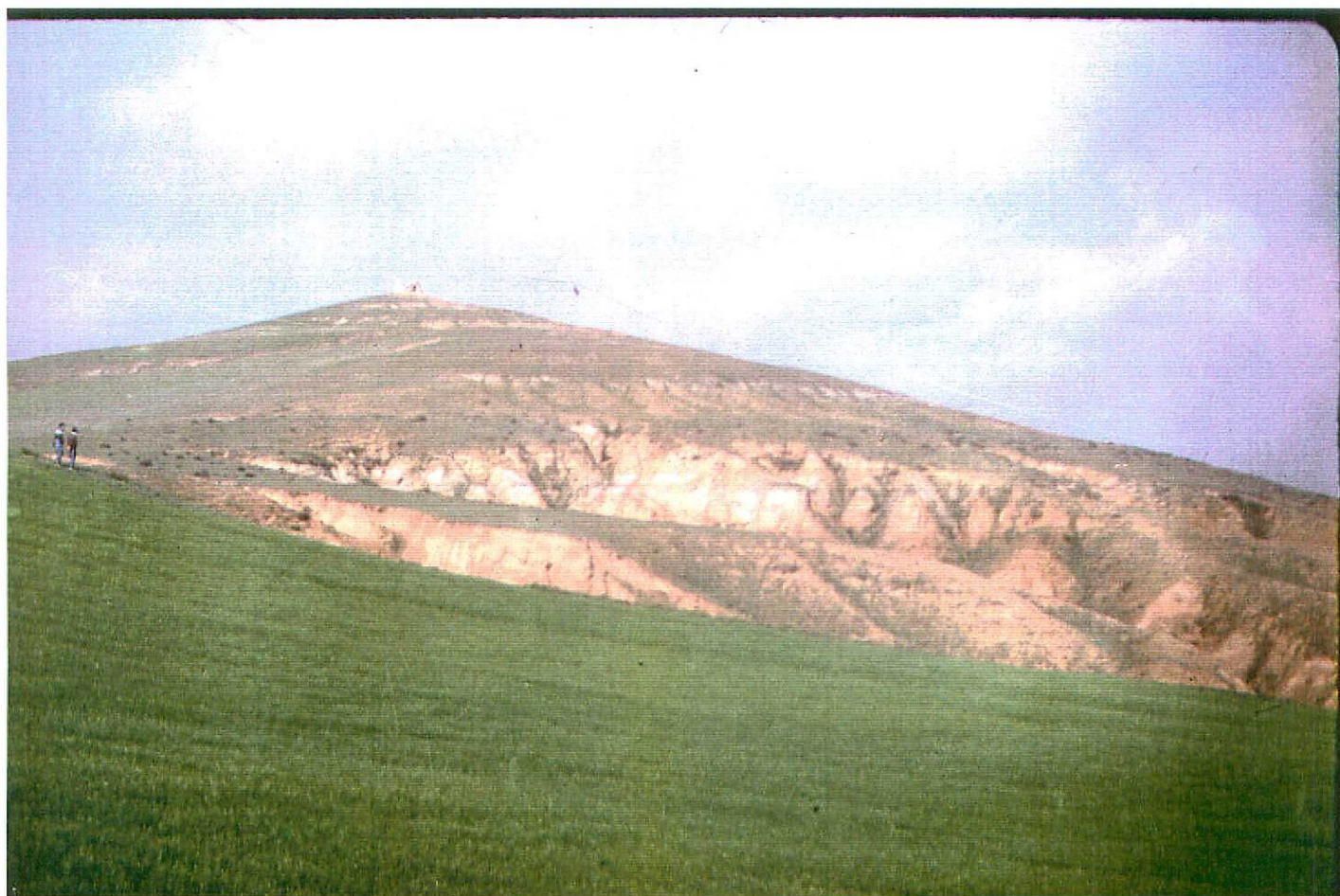
F. 9070. Vista general del Cerro de Santa Olalla. "Facies Cuestas" (Unidad 6). Astavacene sup - Vallesiana inf