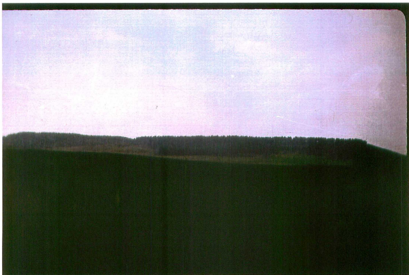
F. 9076. Vista general de Cerro Terrazo (Unidad 6 y 7). Pleistoceno