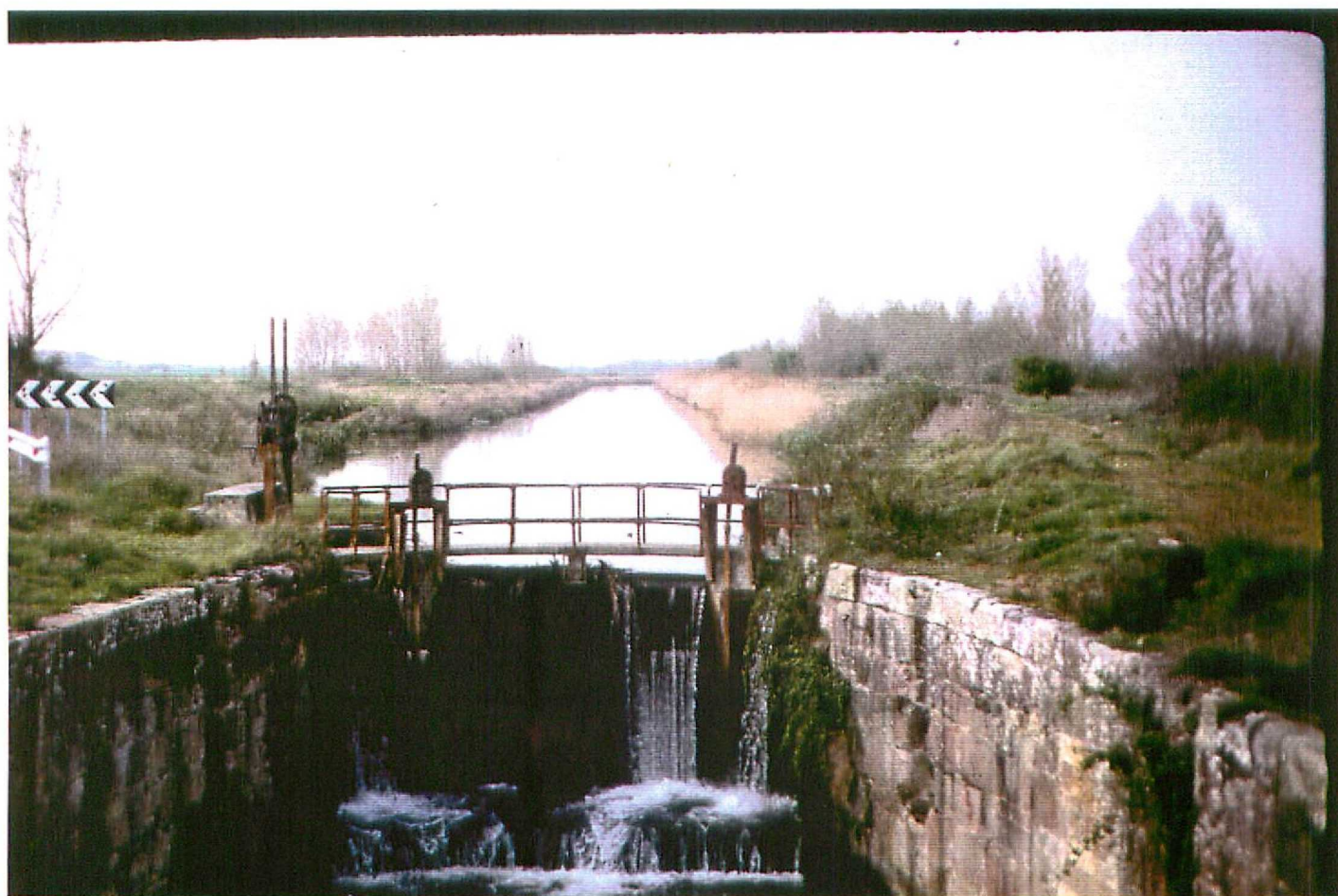
F. 9087. El Canal de Castilla. Holocene