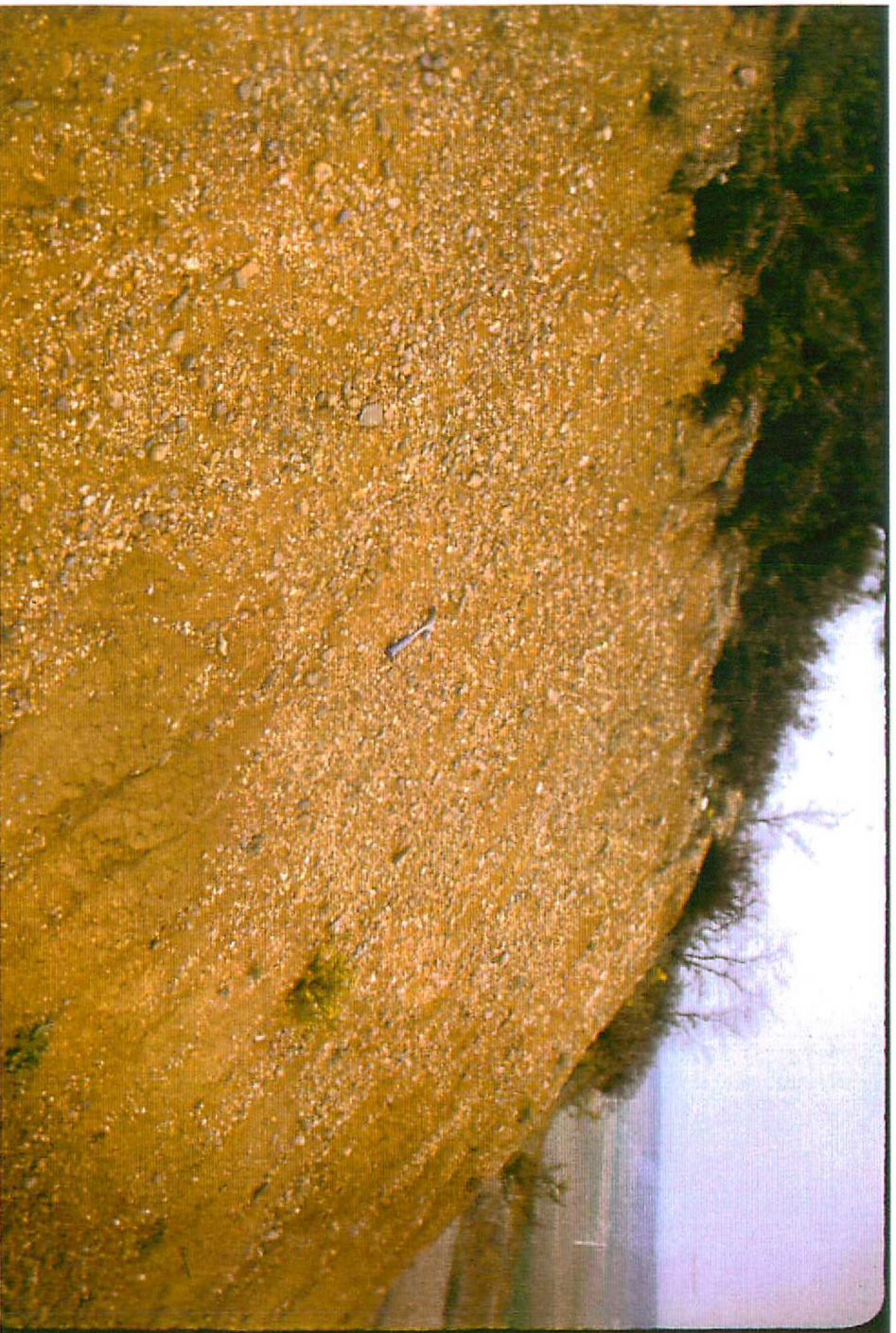
F. 9077. Detalle gravas Unidad 7. Cerro Terrazo. Pleistoceno.