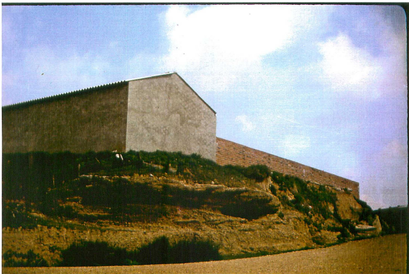
F. 9080. Terraza baja algo cementada en Castrillo de Villavega. Ceatornario