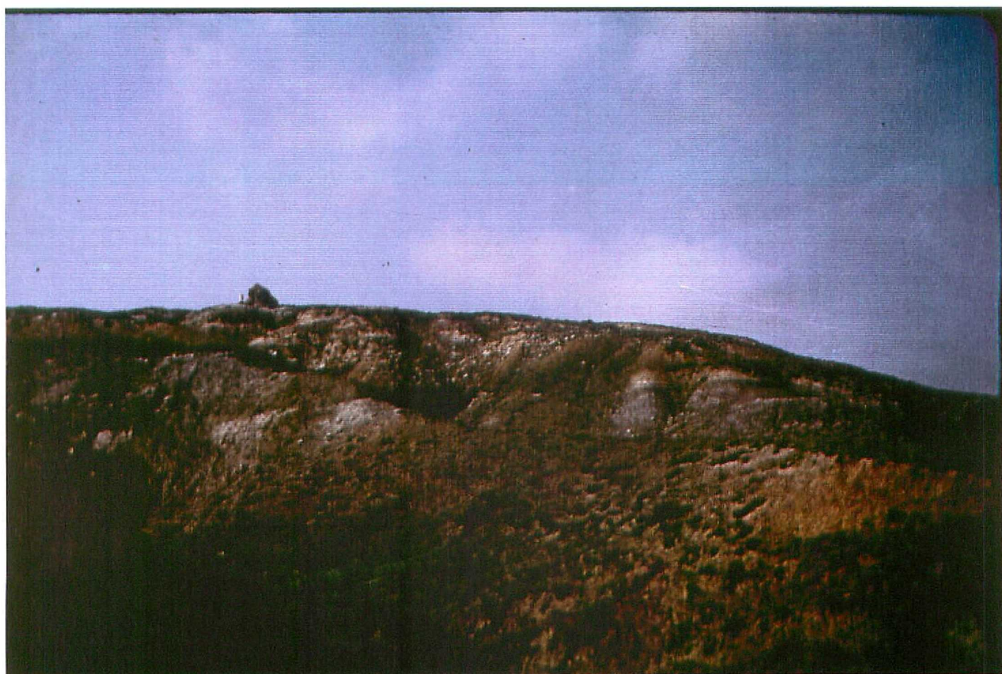
F. 9072. Parte superior del Cerro Santa Olalla. Asociación de facies de ambientes lacustres proximales. Astaraucaria sup - Vallesiana inf