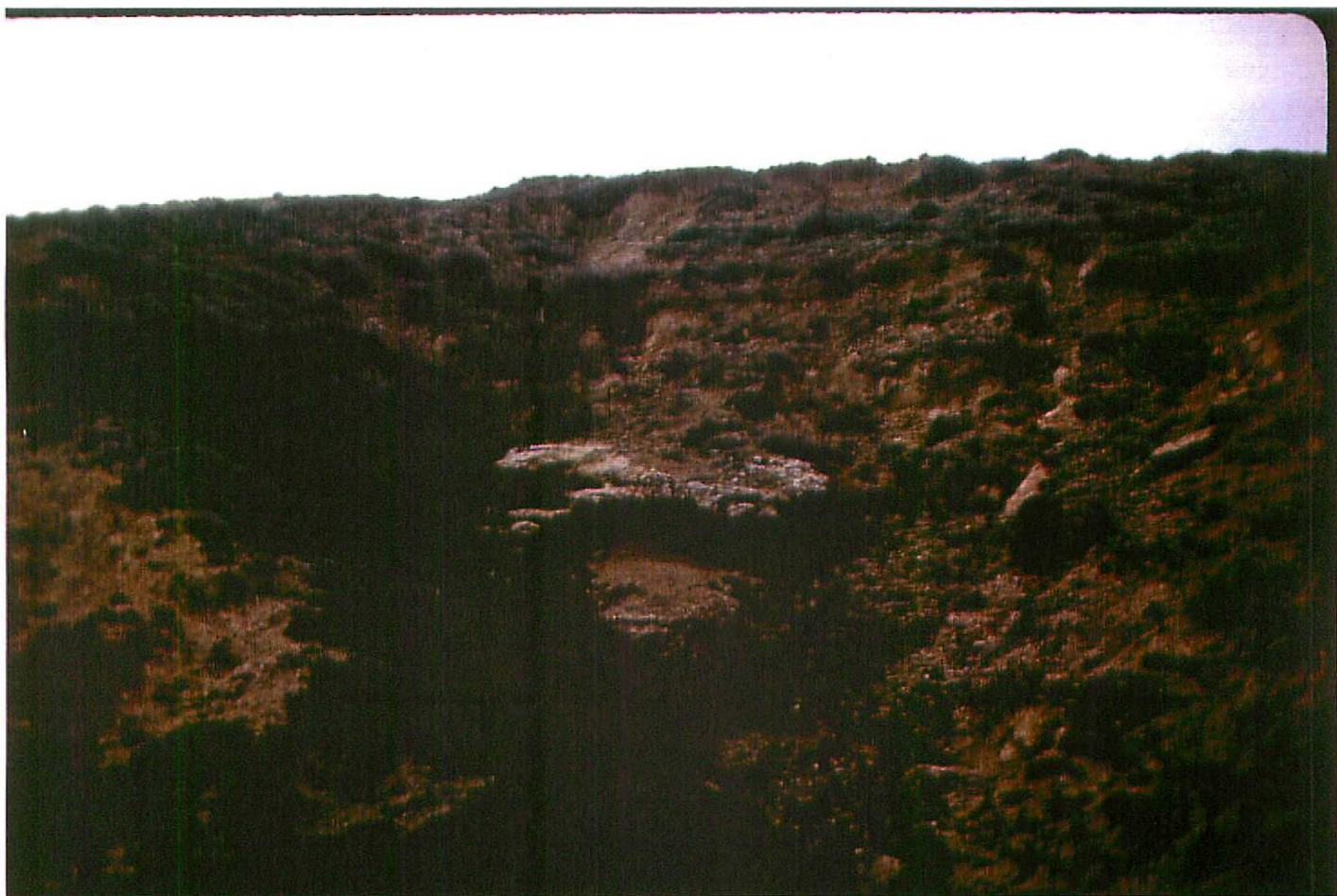
F. 9064. Canales conglomeráticos intercalados en fangos. "Facies de la Serna" (Unidad 5). Abia de las Torres. Astavacense sup-Vallesense inf