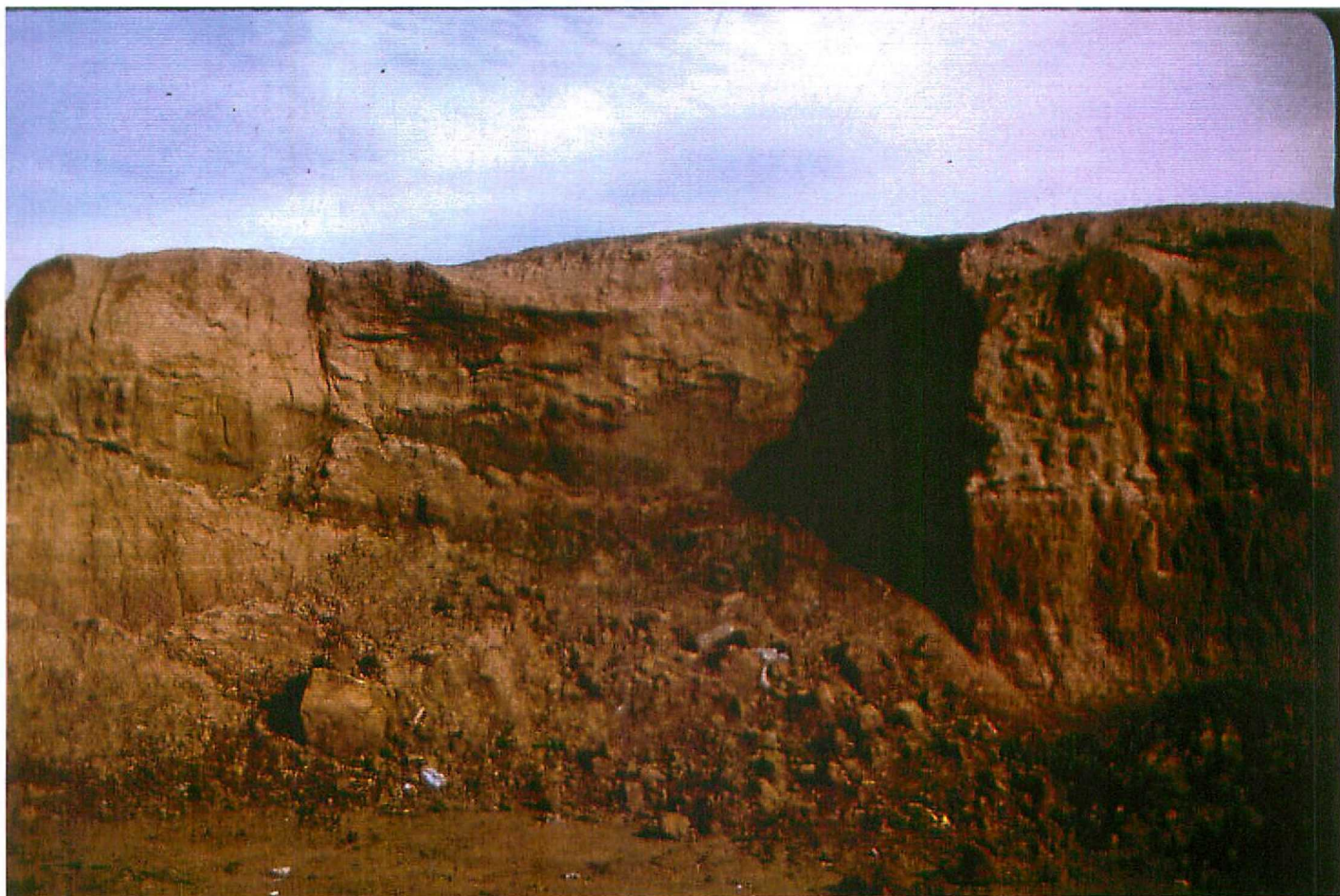
F. 9066. Fangos edafizados. Cementerio de Osorno. Unidad 5. Astatacuense nyp.