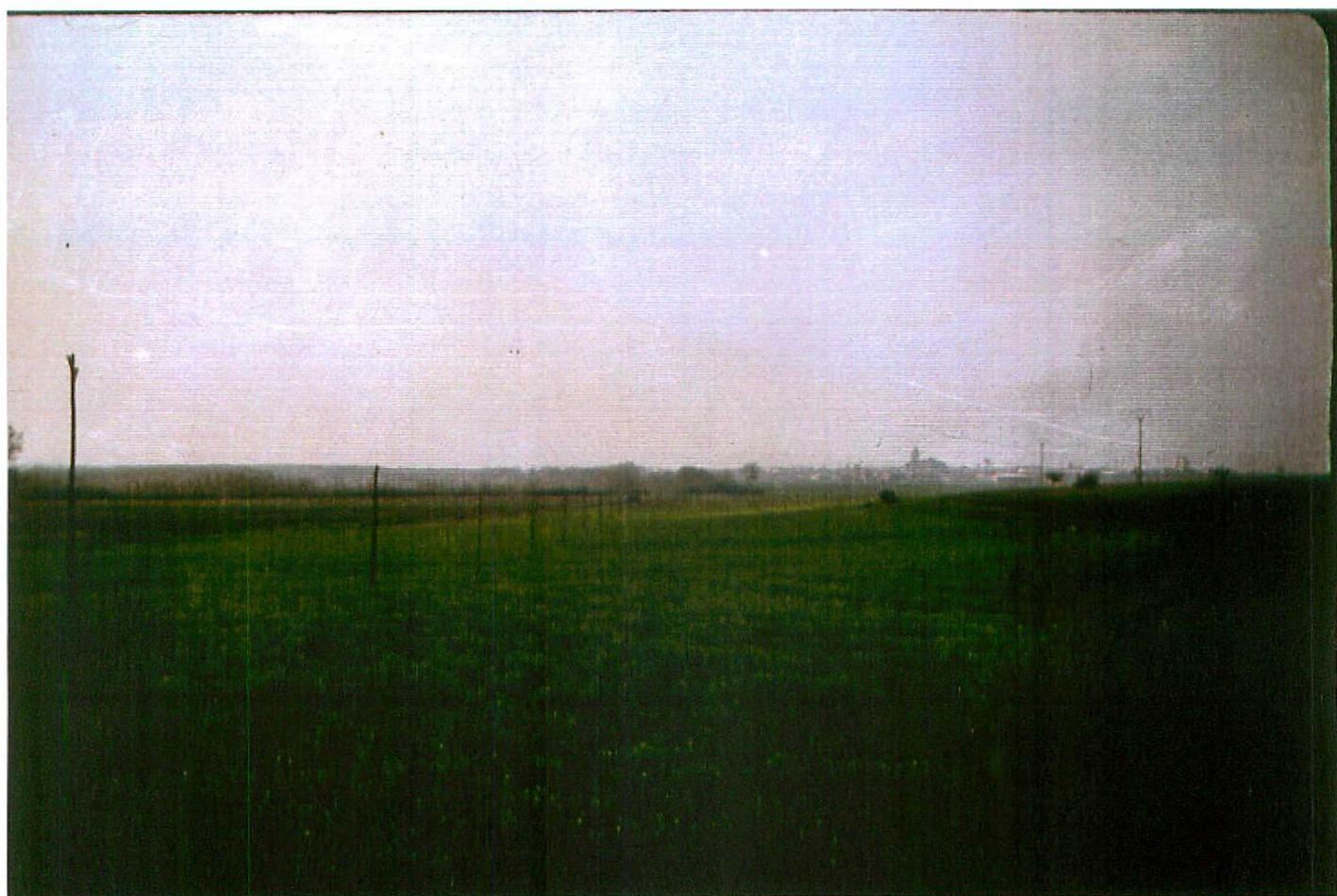
F. 9079. Terrazas medias en las proximidades de Melgar de Fernamental. Cuaternario