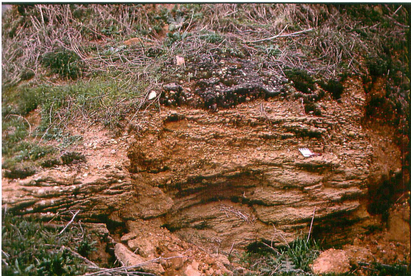
F. 9062. Canal de las "Facies Grijalba-Villadiego" (Unidad 3). Astaracense