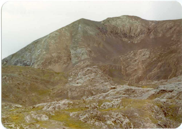
FOTO 226. Flanco SE del circo. Circo de Armeña. A la izquierda en tonos claros caliza C 23 . En el resto de la foto Maciños C 24a con un tramo de color claro.