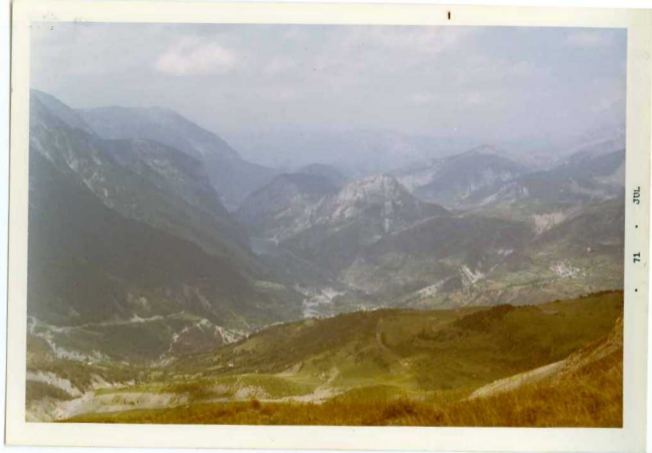
FOTO 215 Vista desde la Sentina ,desde las proximidades del Collado de Sahún. Se ve el embalse de Plan de Escún y el pueblo de Gistain.