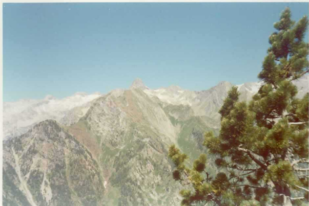
FOTO 261 El Devónico de la Espigantosa. Lo rojizo es Silúrico. Al fondo la granodiorita de Millares.