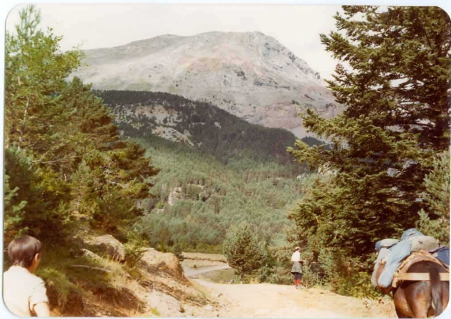
FOTO 251 Cerca de Barbaruens, camino de la fuente de Riancés. Al fondo el manto del Cotiella.