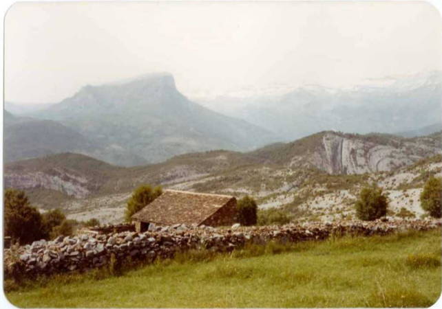
FOTO 256 Desde cerca de la Spuña hacia el NO. En primer término estructuras en las margas Ilerdenses. Al fondo el castillo Mayor (Hoja de Broto), Klippe de la unidad de Cotiella.