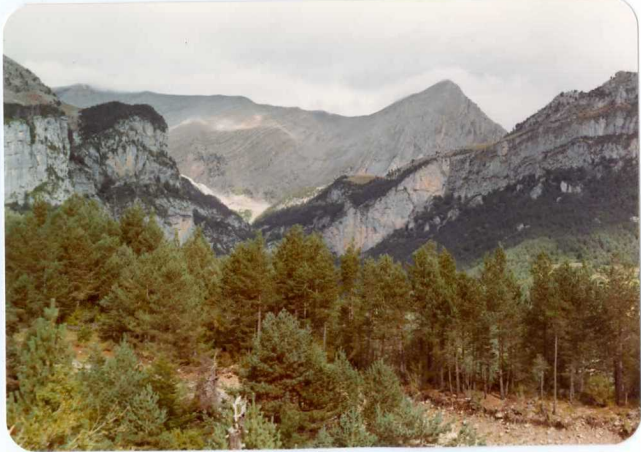
FOTO 252 Foto desde las cercanías de Barbaruens. Los escarpes son la caliza del Paleoceno en cuya base se encuentra la "Arenisca de Aren". Al fondo aparece la escama de Armeña.