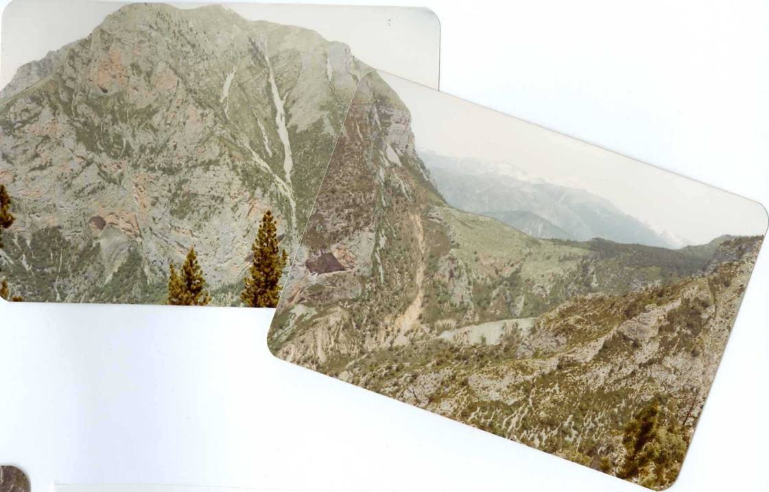
FOTO 234 El collado de Santa Isabel con derrubios cementados (QL 0-1 ) y la cara Sur de Punta LLerga en caliza de Aguasalenz.