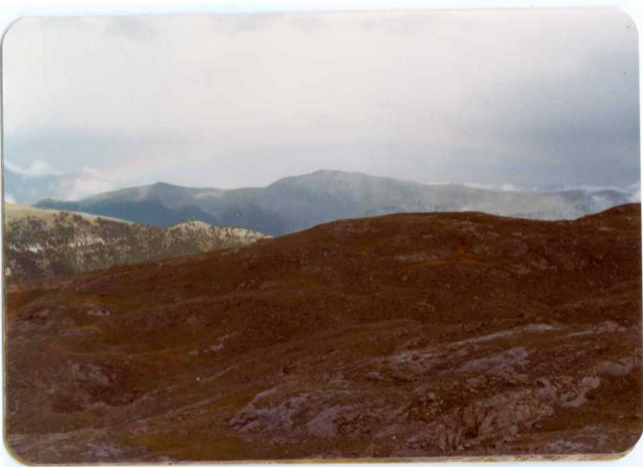
FOTO 220 y 221 (Desde el circo de Armeña hacia el Norte). El cenomano-Turonense C 21-25 del nucleo del anticlinal sinforme del circo de Armeña. Al fondo la escama de la Sierra de Chia.