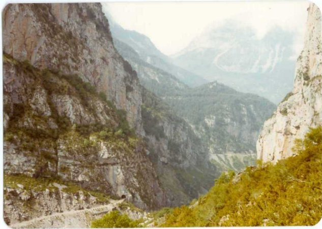
FOTO 246 Carretera de Plan, paso de la Inclusa. En el tunel dolomia en la base del escarpe del Paleoceno.