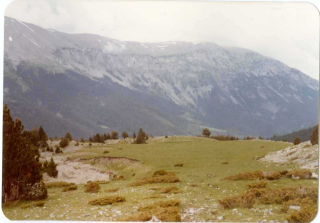
FOTO 239 Ladera occidental de la Sierra de Chia. Es una escama con la formación (C 23-24 ) en el escarpe y sobre ella la caliza de Aguasalenz (C 24 ).