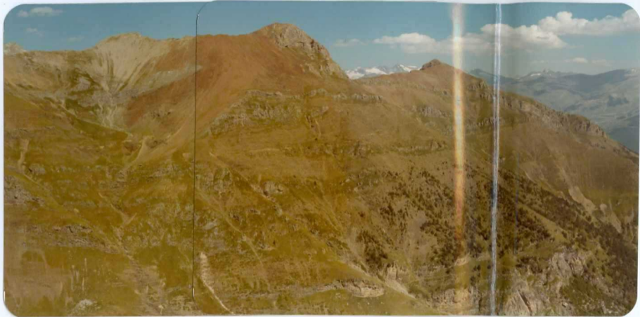
FOTO 210 Ladera Sur del Pico Box. Se observa el estilo de los pliegues tum- bados en Caliza ( D_2^C ). En la zona del metamorfismo mas próximo al granito las pizarras toman un color rojizo.