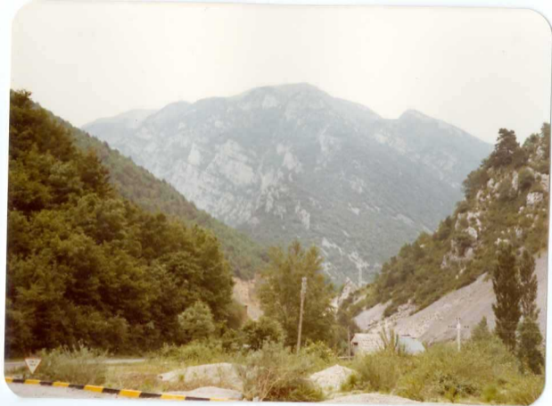
FOTO 245 Fotografía sacada desde la gasolinera de Salins. En el fondo las Pegueras en la que destaca la caliza del Paleoceno.