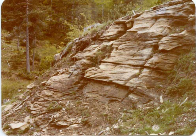
FOTO 242 En la formación C 25-26 detalle de esquistosidad anastomosada N 170 E. Estación 23.