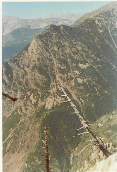
FOTO 262 y 263 Pico Eriste. Al fondo la sierra de Chia. Entóno claro el granito de Millares. De color salmón las pizarras de la formación D 1 -2-3 .