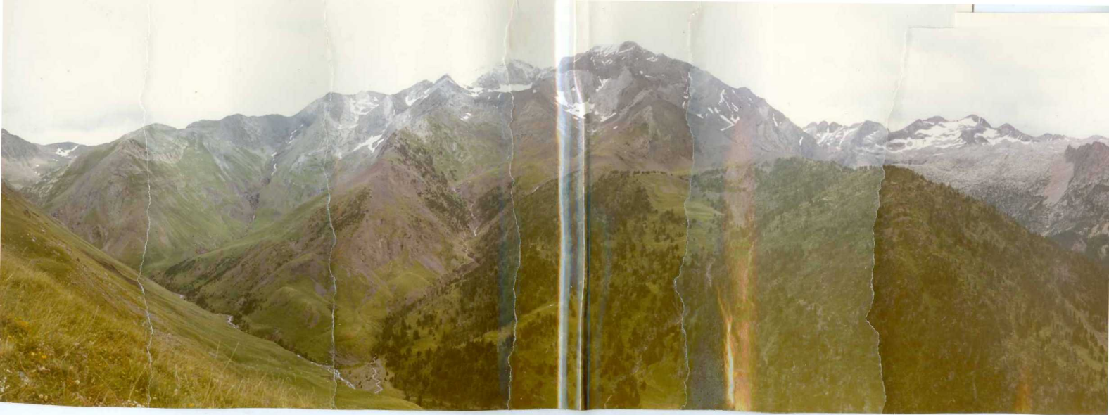
FOTO 269 Panorámica de la ladera O del macizo de Posets. Hay que resaltar en primer plano la diferencia entre las pizarras (OS) del techo del Ordovícico (Zona con pinos) ,y el Silurico a la izquierda, este último mucho más blando. En blanco caliza D 1 c .A la derecha al fondo el granito de los Millares.