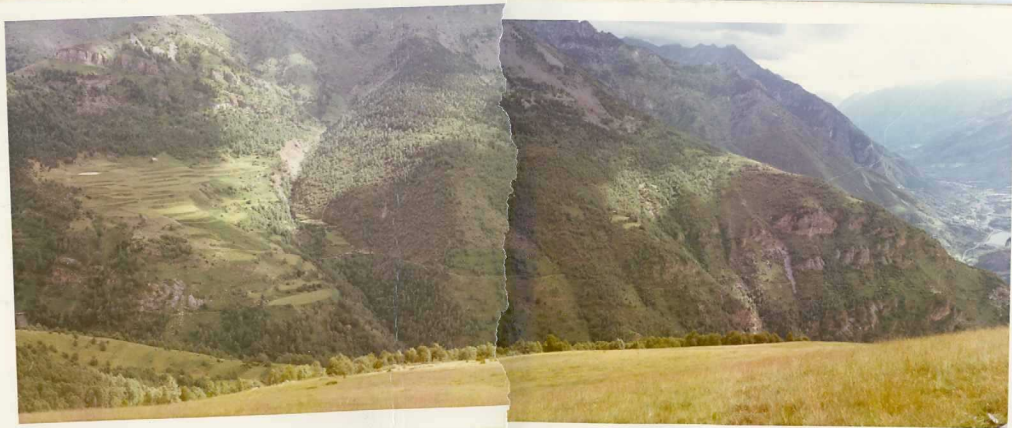
FOTO 214 Detalle del camino de Plan a Sahún cerca de este último. A la derecha se ve Eriste (Hoja de Benasque).