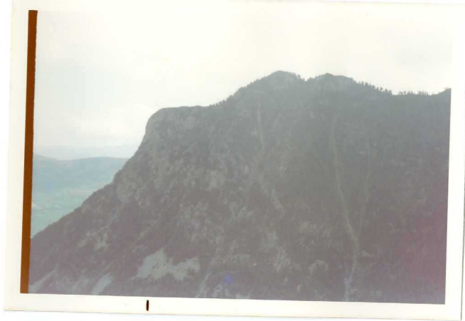
FOTO 260 Zona del P.Eriste. El escarpe es granodiorita ( de Millares).