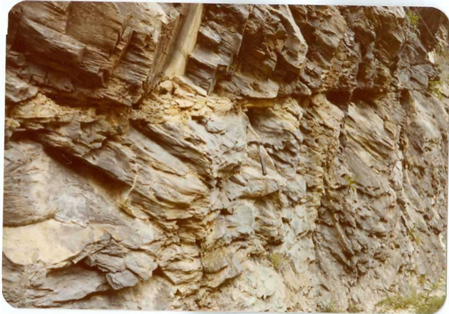
FOTO 253 Aguas abajo del tunel de las devotas. Detalle de las margas calcáreas y margas del Ilerdense medio-superior. Esquistosidad N-160° a N-175° con buzamiento al E.