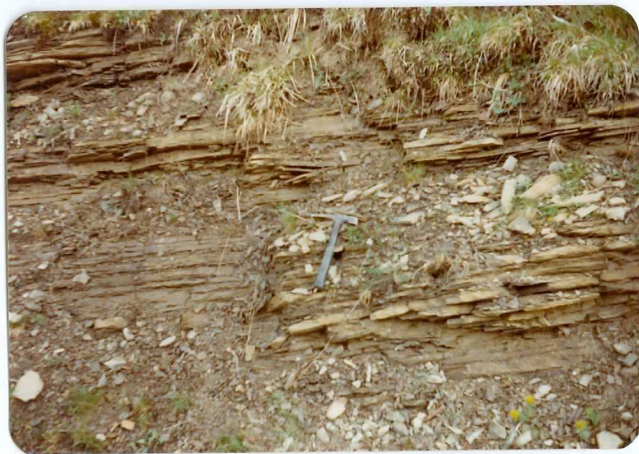
FOTO 241 En la formación C 25-26 alternancia de caliza finamente arenosas y margas . Estación 21.