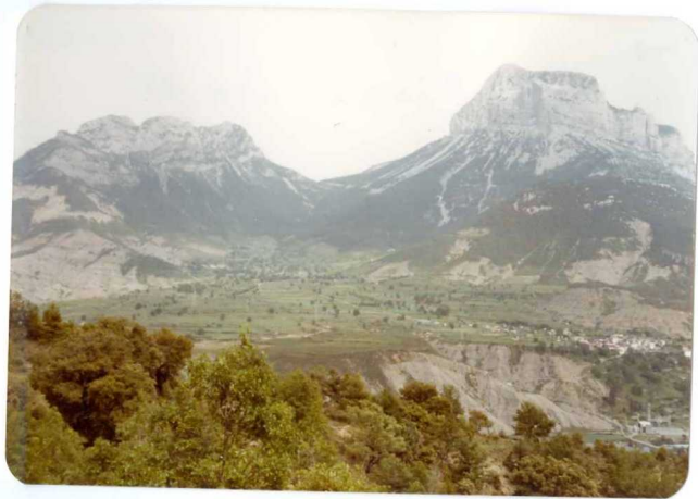
FOTO 258 Vista de Peña Solana y Peña Montañesa. El pueblo es Laspuña.