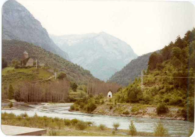
FOTO 232 La Ermita de Badoin en las proximidades de la Fortunada en margas ilerdenses y el valle del rio Irués en el manto del Cotiella al fondo.