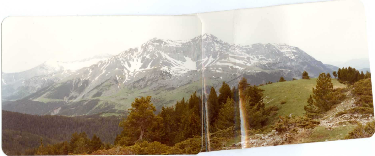
FOTO 267 Panorámica de la parte posterior de la escama de Armeña. A la derecha con nieve el circo de Armeña con el P. Cotiella. En el centro el peña las Once y el P. Mediodía.