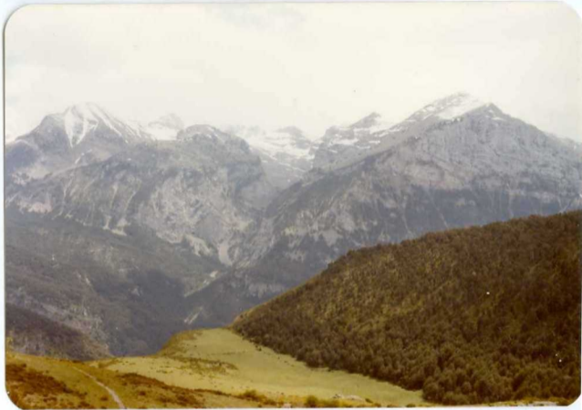
FOTO 237 Vista del macizo de Cotiella desde las Pegueras.