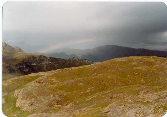
FOTO 220 y 221 (Desde el circo de Armeña hacia el Norte). El cenomano-Turonense C 21-25 del nucleo del anticlinal sinforme del circo de Armeña. Al fondo la escama de la Sierra de Chia.