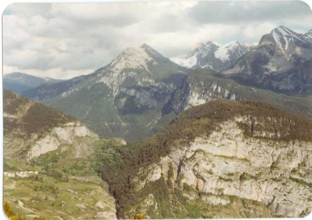
FOTO 247 En primer término Serveto y la Peña del Sin (Paleoceno). Detrás el pico Mediodía, P. Llosal y Lavasar.