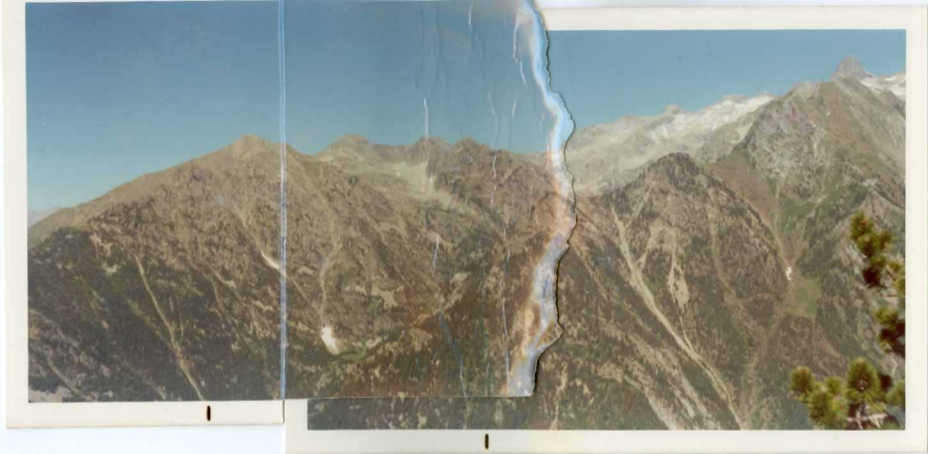
FOTO 264 Panorámica de La Vall y el valle de Eriste. Al fondo en blanco el granito de los Millares