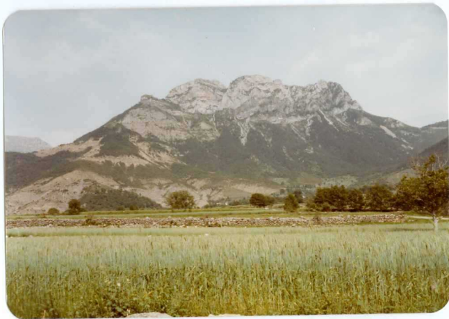
FOTO 259 Detalle del Klippe de Peña Solana en Paleoceno. En la base del Klippe, escama de las margas Ilerdenses y debajo en tonos amarillentos el Cuisiense con pasadas turbiditicas. Este a su vez sobre las margas ilerdenses en gris.