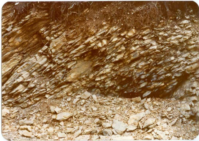
FOTO 243 En la subida hacia el Plan de Cotiella .Afloramiento de la escama en la base del manto del Cotiella.Margo-calizas C 25-26 mequivalentes a las "margas de Seira" con esquistosidad noroesteada, buzamiento oeste.