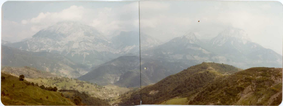
FOTO 266 Panorámica de Punta Llerga, Peña Solana y Peña Montañesa, (esta última en la hoja de Campo) desde el O. Pertenecientes a la unidad del Cotiella, sobre el Eoceno del río Cinca.