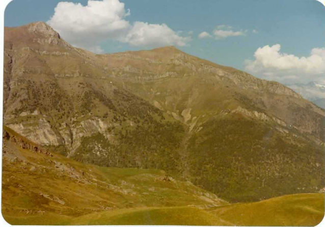
FOTO 211 Otra vista de la misma zona