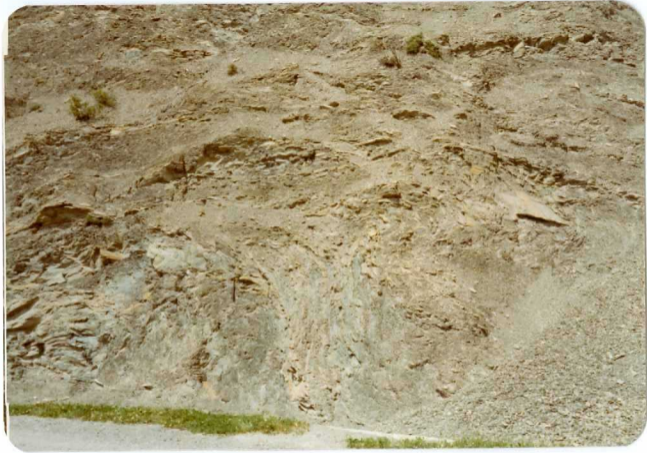
FOTO 257 En la carretera junto a Las Spuña. Detalle de Turbiditas en el flysch Cuisiense. Probable slumping.