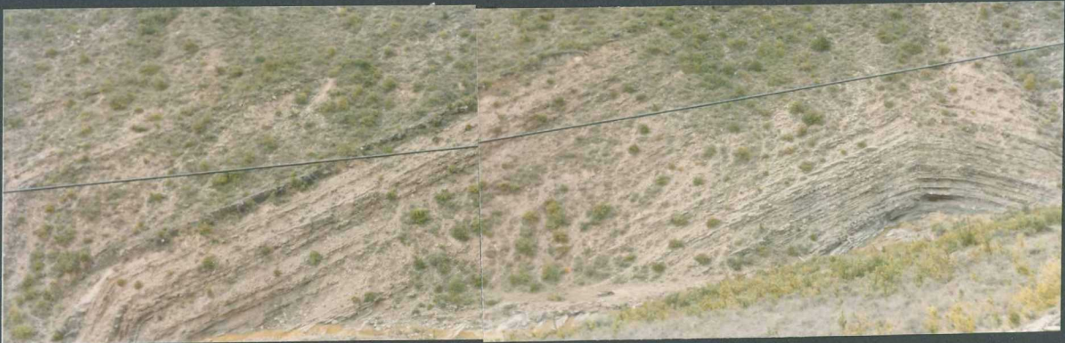
(9102) FOT. 9.- Pliegues en las areniscas del Headoviense-Sueviense en Undués de Lerda (hoja de Sigües - 175)