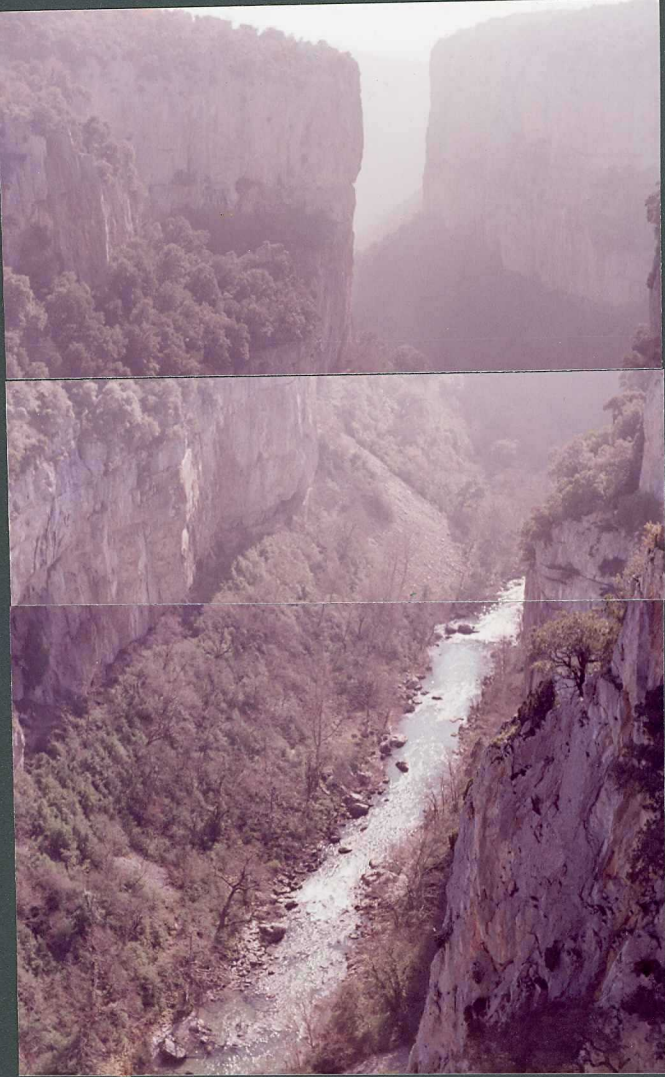
(9094) FOT. 1.- Panorámica de la Foz de Arbayun (en la hoja de Navascués 143).