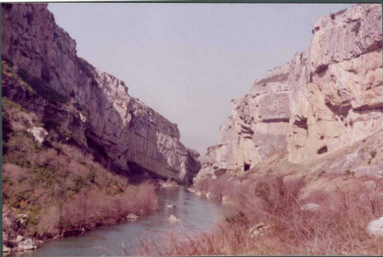
(9045) FOT. 22.- Los crestones corresponden a las calizas con Alveolinas - del Ilerdiense y las calizas del Luteciense en la Foz de Lumbier