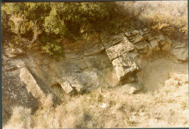
(9112) FOT. 19.- Aspecto de los canales de la unidad de Allo en la carretera de Cáteda a Carcastillo.