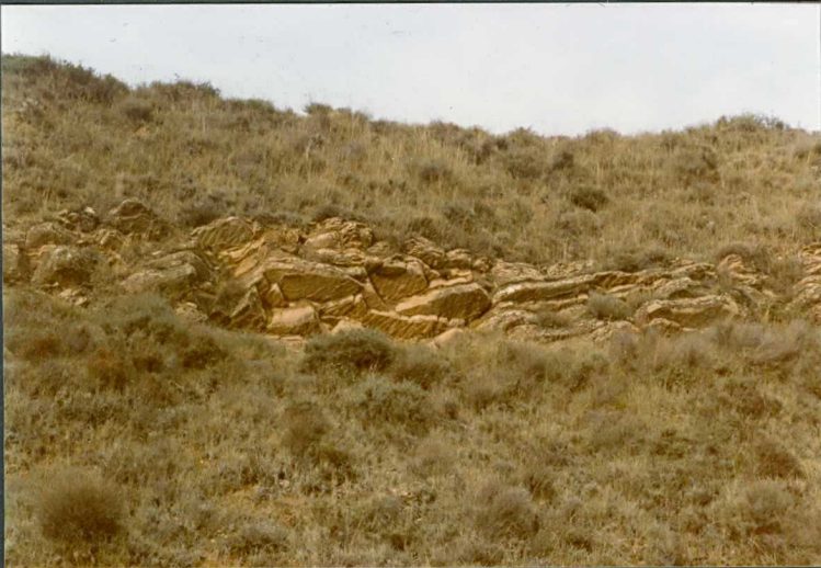
(9111) FOT. 18.- Marcas de ripples y grietas de desecación en las areniscas de la unidad de Leoz en la zona de Lerga.