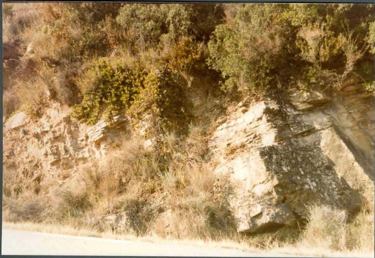
(9113) FOT. 20.- Aspecto de los canales de la unidad de Allo en la carretera de Cáseda a Carcastillo