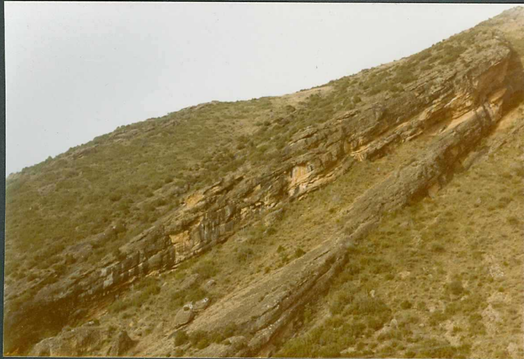
(9115) FOT. 22.- Vista de la unidad. Conglomerados de Gallipienzo en la - localidad del mismo nombre.