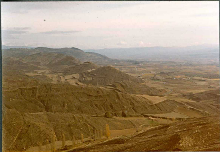
(9110) FOT. 17.- Panorámica de la unidad de Leoz en la zona de Lerga.