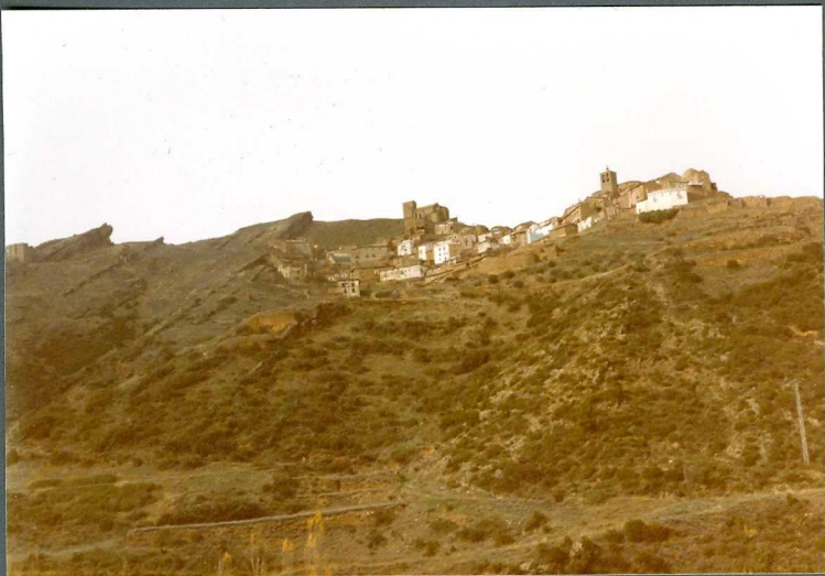
(9114) FOT. 21.- Vista de la unidad. Conglomerados de Gallipienzo en la - localidad del mismo nombre.