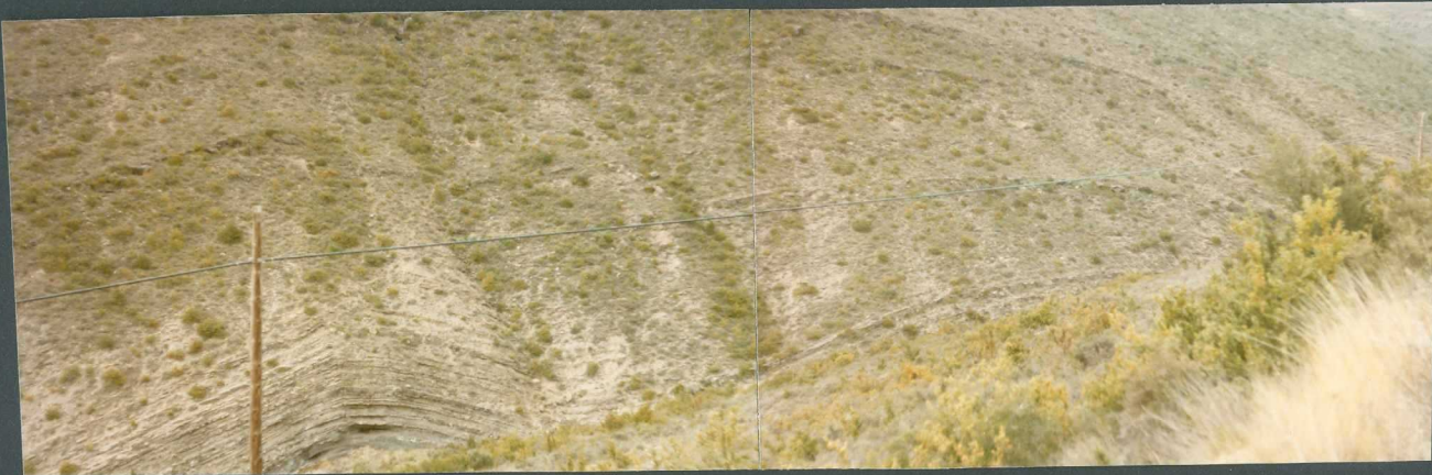
(9101) FOT. 8.- Pliegues en las areniscas del Headoviense-Sueviense en Un dués de Lerda (hoja de Sigües-175)