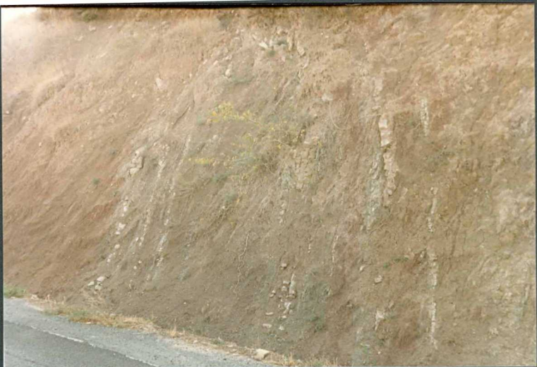
(9104) FOT. 11.- Aspecto de las margas con niveles de areniscas y calizas de Headoviense-Arverniense, en la carretera de Sangüesa a Sos del Rey Católico