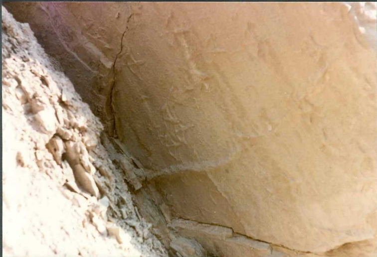
\(9099) FOT. 6.- Huellas de aves en las areniscas de la FOT. 5. Tomada en la carretera de Yesa a Javier.