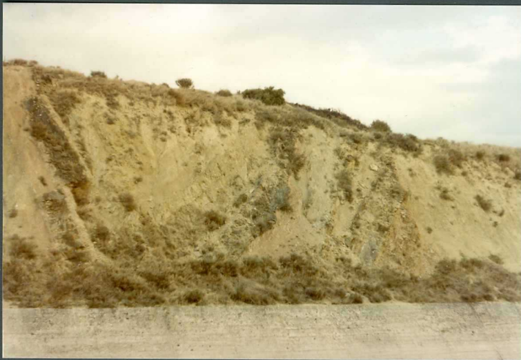
(9105) FOT. 12.- Aspecto de la Unidad de Sangüesa, por la carretera de ser vicio del Canal de las Bárdenas al E. de Cáseda