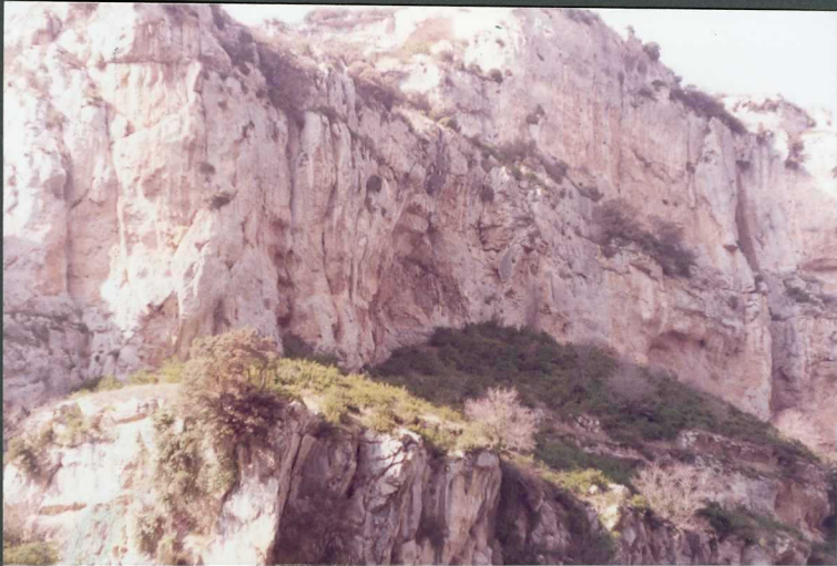
(9096) FOT. 3.- Los crestones corresponden a las calizas con Alveolinas del Ilerdiense y calizas del Luteciense en la Foz de Lumbier.