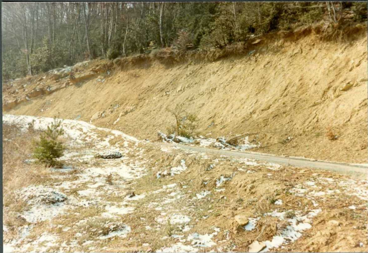
(9108) FOT. 15.- Aspecto de la Undiad de Sangüesa, por la pista de Abinza- no a Sabaiza