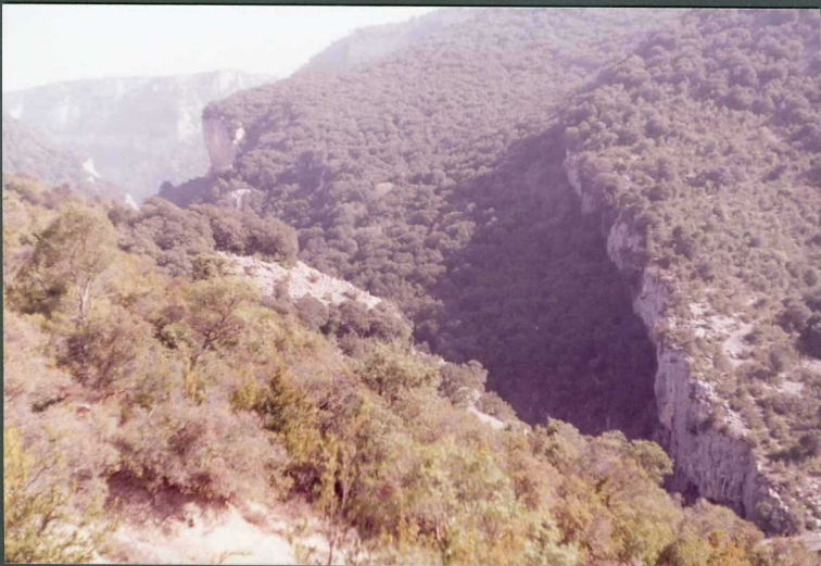
(9097) FOT. 4.- Cortado en las calizas del Ilerdiense y Luteciense en la Foz de Arbayún