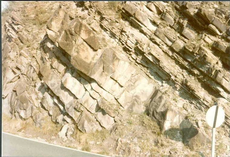
(9098) FOT. 5.- Aspecto de los bancos de areniscas de la unidad areniscas de Liédena tomada en la carretera de Yesa a Javier