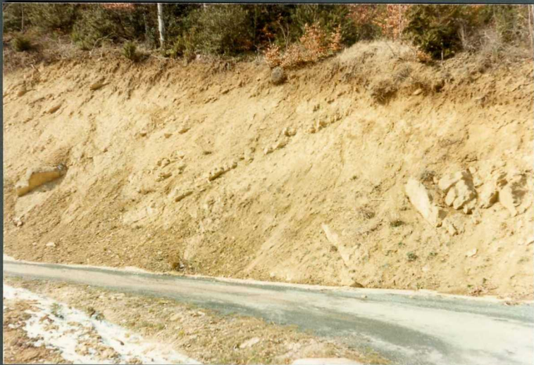
(9109) FOT. 16.- Aspecto de los canales de la Unidad de Areniscas de Rocaforte por la pista de Abinzano a Sabaiza.