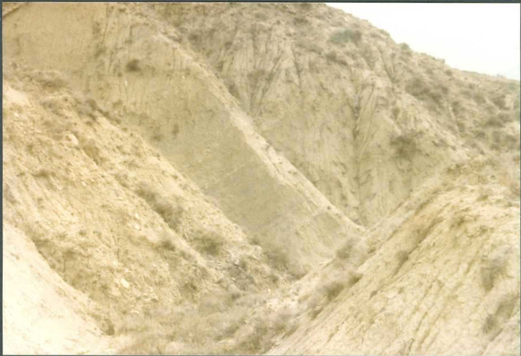
(9106) FOT. 13.- Aspecto de las margas de la Unidad de Sangüesa, al S. de Sada de Angüesa