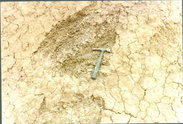
(9107) FOT. 14.- Detalle de las margas de la FOTO 13