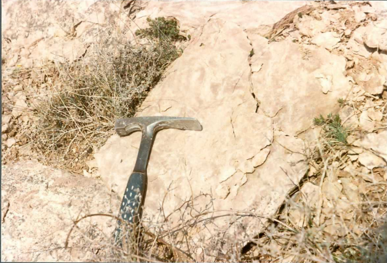
(9103) FOT. 10.- Aspecto tigreado de las areniscas del Headoviense-Suevien se en las Ventas de Izco.