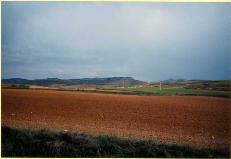
YP-FL-9133 Vista general de los relieves cretácicos de Camporredondo en contacto con los materiales neógenos de las "Facies Grijalba-Villadiego". (Astaracense)