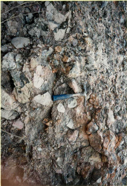
YP-FL-9137 Detalle de los conglomerados de la foto anterior. (Asta vieja)