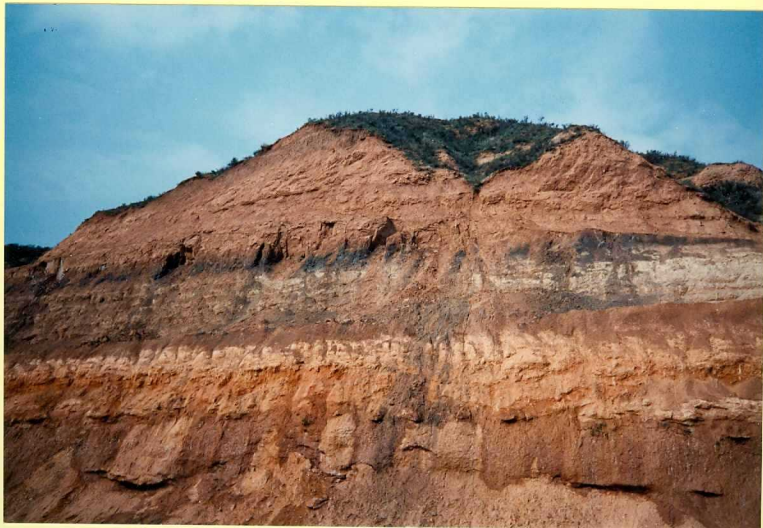
YP-FL-9140 Fangos rojos con intercalaciones de niveles carbonosos y margosos en Herrera de Pisuerga (Unidad 17). Astavaciense