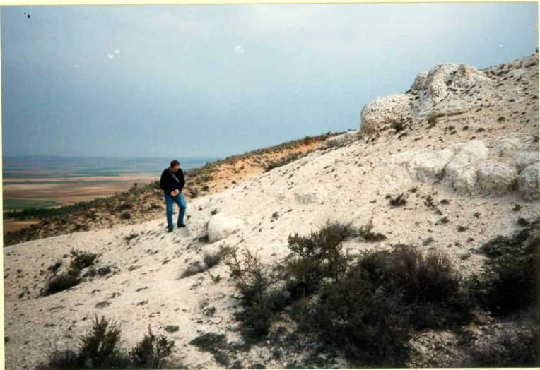
YP-FL-9144 Detalle de la secuencia anterior. Astavaciense