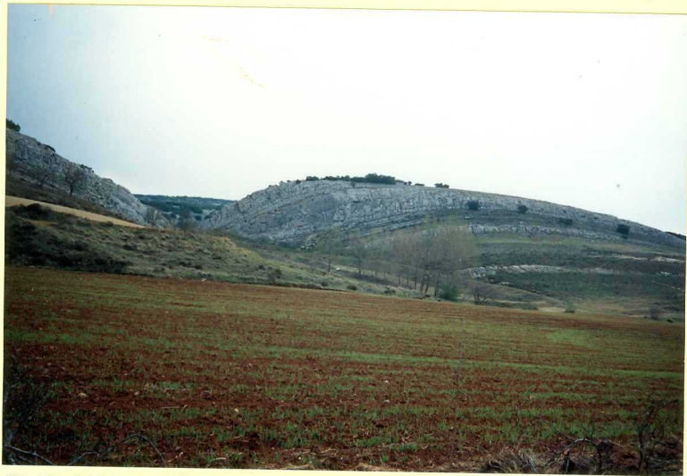
YP-FL-9135 Calizas y margas del Santoniense en las proximidades de Salazar de Amaya.