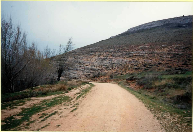
YP-FL-9136 Conglomerados neógenos de borde (Facies Alar del Rey) en Salazar de Amaya. Aragoneuse sup ( Astaresciense )