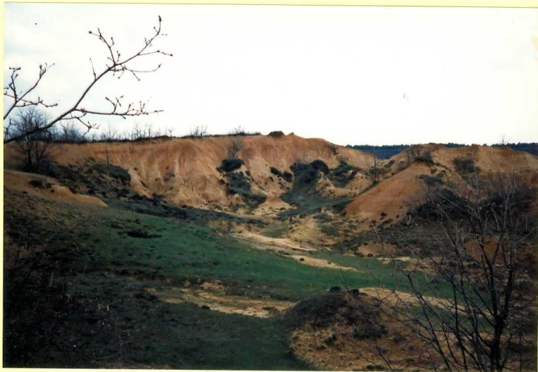
YP-FL-9152 Fangos ocre edafizados (Unidad 21) en San Martín del Monte. Proceso sup.