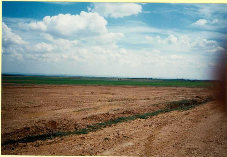
YP-FL-9157 Extensa plataforma desarrollada sobre los depósitos más antiguos de la red fluvial cuaternaria. Pleistoceno