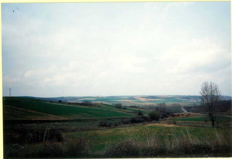
YP-FL-9148 Aspecto general de las zonas distales del Abanico de Cantoral en las proximidades de Bascones de Ojeda. Placens sup.