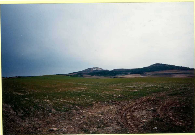
YP-FL-9142 Vista general de la serie neógena en el Cerro Oteralbo. Astarociense