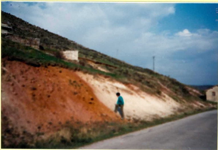
YP-FL-9134 Facies Utrillas (Unidad 6). Rebolledillo de la Orden. Albense sup - Cromacinares