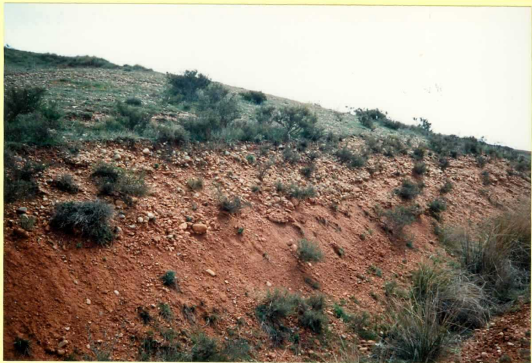
YP-FL-9145 Facies canalizadas (Unidad 16), intercaladas en los fangos rojos. Astaraciense