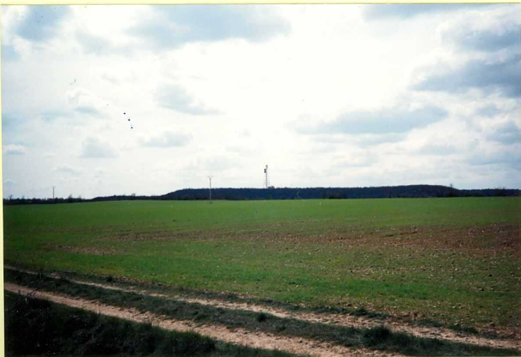
YP-FL-9156 "Ladera El Ser". Replano correspondiente a los depósitos del techo de la terraza más alta del río Pisuerga. Cuaternario