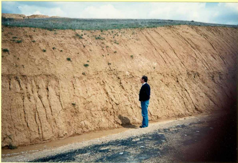
YP-FL-9153 Detalle de los fangos ocres al Sur de la Hoja (Hinojosa de Boedo). Mocero sup.