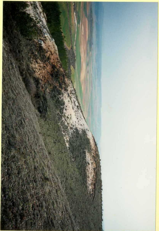
YP-FL-9143 Secuencias detrítico-carbonatadas en el Cerro Oteralbo. Astivaciunea