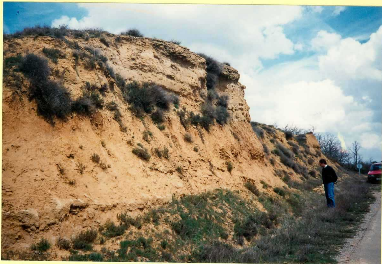
YP-FL-9149 Facies de la Serna (Unidad 21) en Villameriel. Mioceno sup.