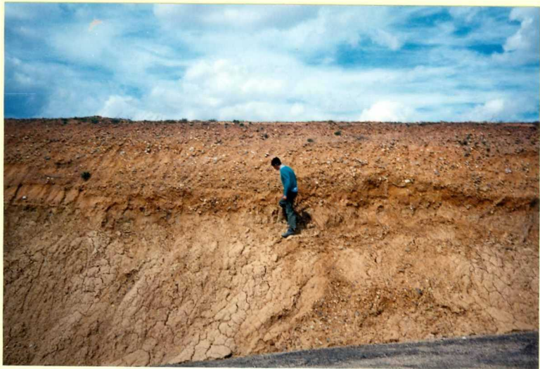
YP-FL-9155 Terrazas altas del Río Pisuerga y glacia al Sur de la Hoja. Pleistoceno (Cuaternario)