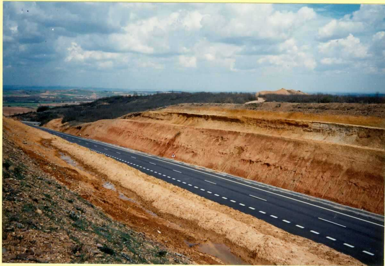
YP-FL-9150 Contacto entre las Facies de la Serna (Unidad 21) y las "Facies Grijalba-Villadiego en Hinojosa de Boedo. Cta. Nacional Km. 72. Proceso sup y Astaracense