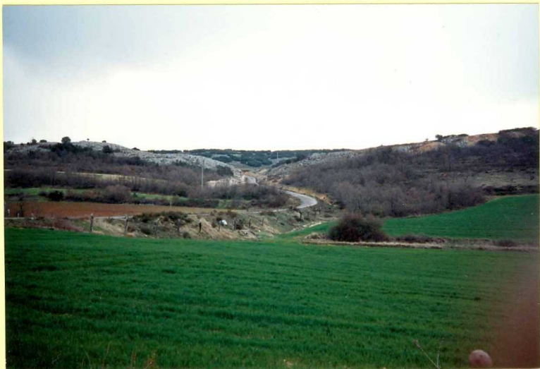
YP-FL-9132 Corte de Rebolledillo de la Orden. Cretácico superior.