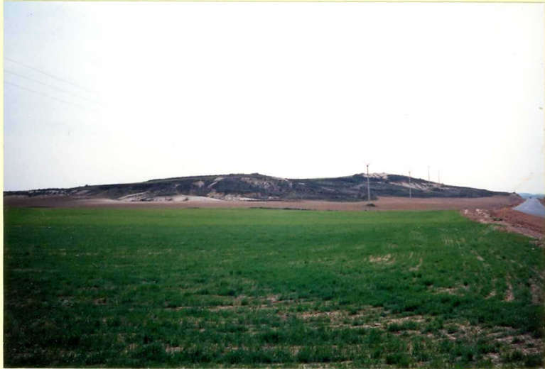
YP-FL-9141 Margas blancas en la Vid de Ojeda (Unidad 18) Astaraíense