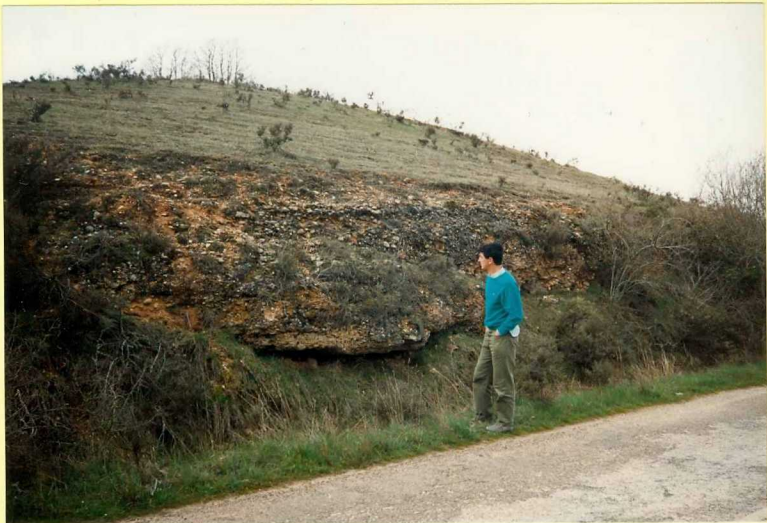
YP-FL-9139 Aspecto general de la Unidad 16 (Conglomerados) en las proximidades de Sotovellanos. Astaracense