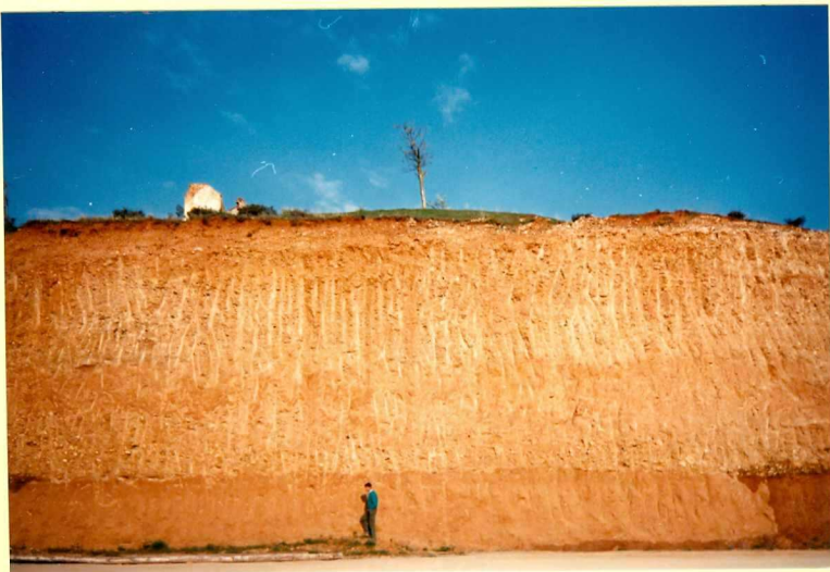
YP-FL-9138 Unidad 16 en Alar del Rey. Conglomerados y arcillas rojas. ( Actaracense )