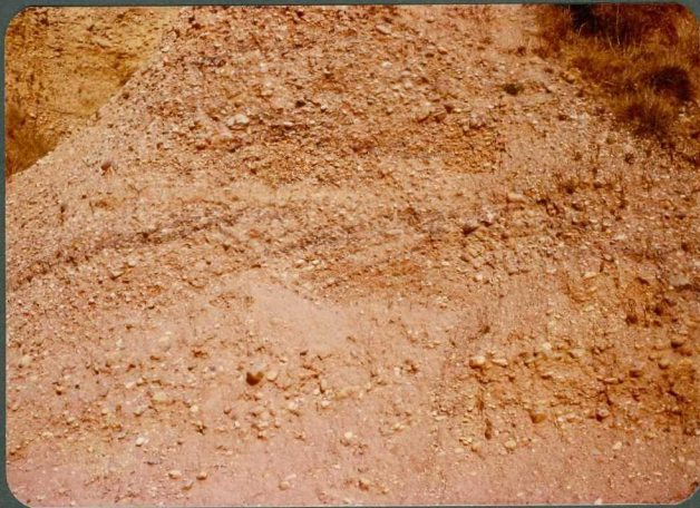
F.5: y 6: Depósitos de barras de rios trenzados. Abanico de Guar do. Celadilla del Rio.