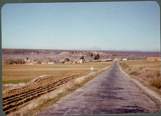
F.27: Escarpes de terraza regularizados y acarvacados. Pino del Rio.