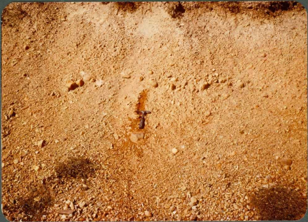
F.2: Depósitos de débris-flow. Abanico de Guardo, Pino del - Rio.