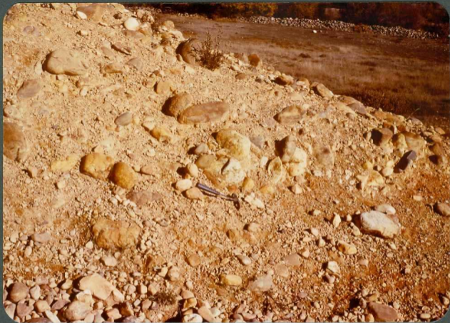
F.3: Depósitos de corriente densa. Abanico de Guardo, Pino - del Rio.