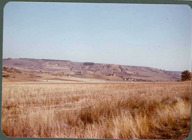
F.28: Vertientes regularizadas. Vega de Doña Olimpia.