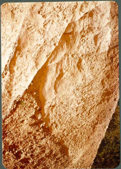
F.7: Arenas de canal. Rios trenzados. Abanico de Guardo, Cella- dilla del Rio.