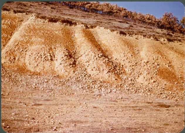
F.1: Depósitos de débris-flow. Abanico de Guardo, Villosilla de la Vega.