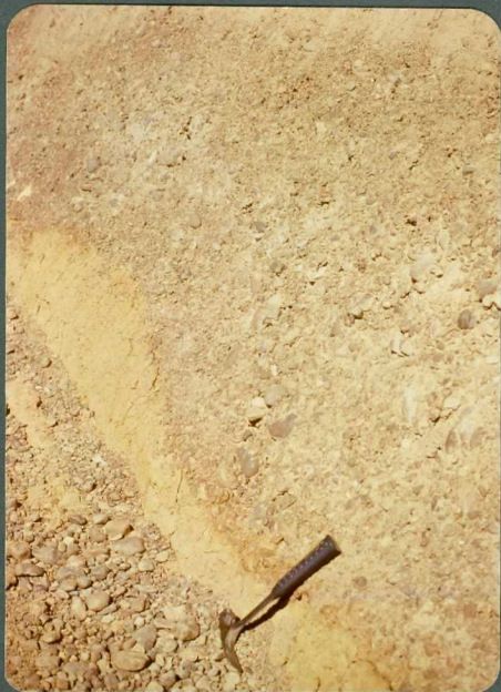
F.25: Depósitos de fondo de valle. Villaeles de Valdavia.