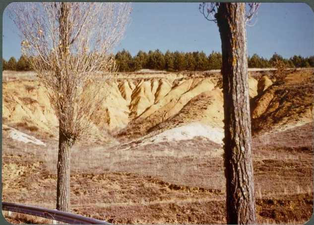
F.13: Fangos y calizas palustres. Facies de la Serna. Villanueva del Monte.