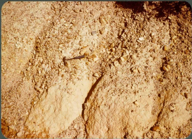
F.4: Depósitos de corriente densa. Abanico de Guardo, Tabanera de Valdavia.