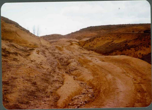
F.14: Niveles de suelos calcimorfos y calizas palustres . Facies de La Serna, Villosilla de Valdavia.