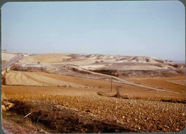
F.12: Niveles de calizas palustres, fangos y canales de conglomerados mixtos. Abanico de Aviñante. Buenavista de Val da via .