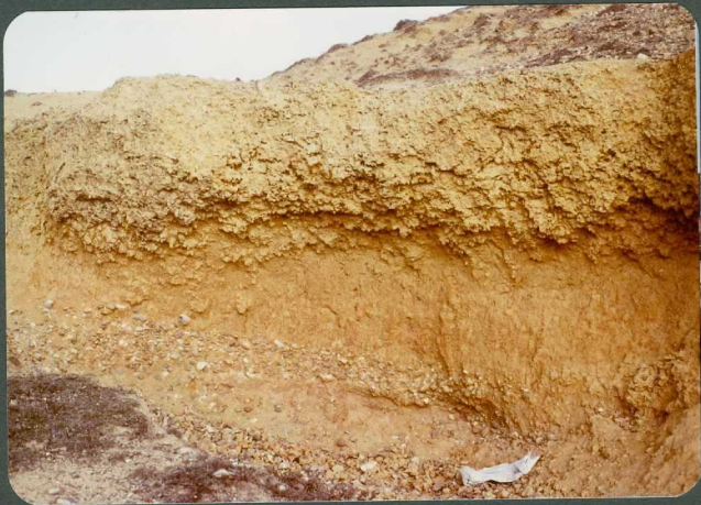
F-15: Nivel de calizas palustres. Facies de La Serna. Valderrábano.