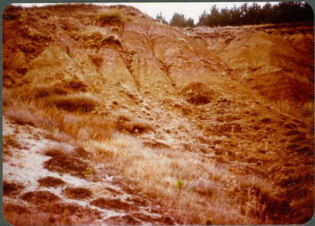
F.18: Calizas palustres y fangos de la Facies de La Serna. Va lenoso.