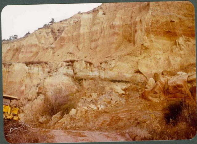
F.17: Paleocanales de grava y arena; fangos ocre y rojos de la Facies de La Serna. Saldaña.