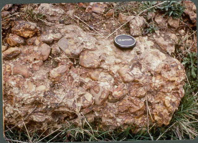
F.24: Cementación por óxidos de hierro de la Terraza 5 del Carrión. Villota del Páramo.