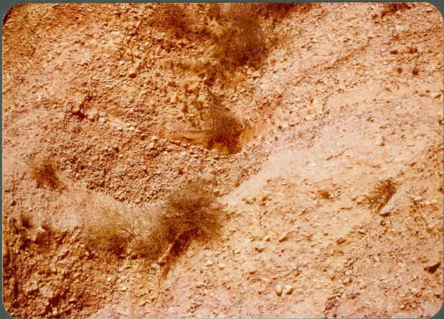
F.5 y 6: Depósitos de barras de ríos trenzados. Abanico de Guardo. Celadilla del Río.