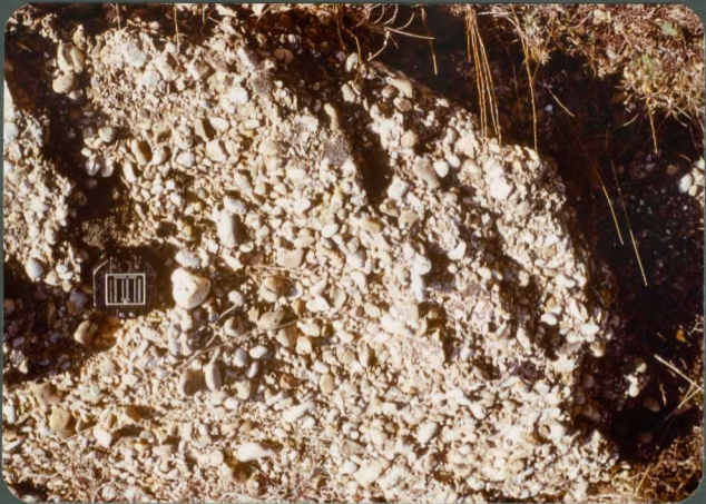
F.11: Conglomerados mixtos. Abanico de Aviñante, Renedo de Val ad avia.