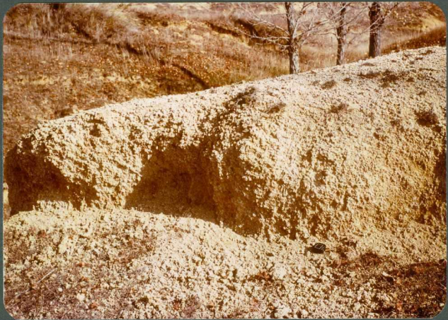
F.16: Nivel de calizas palustres. Facies de La Serna. Vega de Doña Olimpia.