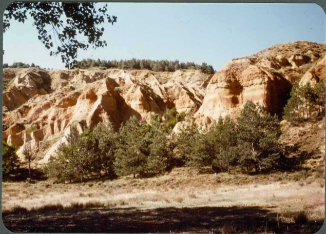
F.30: Cárcavas subactuales, desarrolladas sobre fangos de la Facies de la Serna. Saldaña.