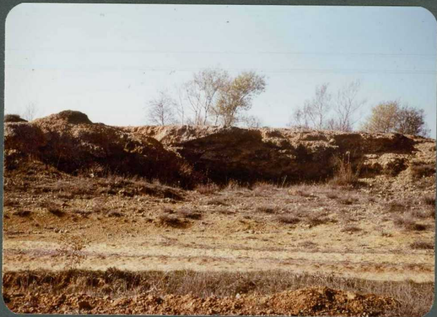
F.10: Paleocanal de conglomerados mixtos. Abanico de Aviñante, Renedo de Valdavia.