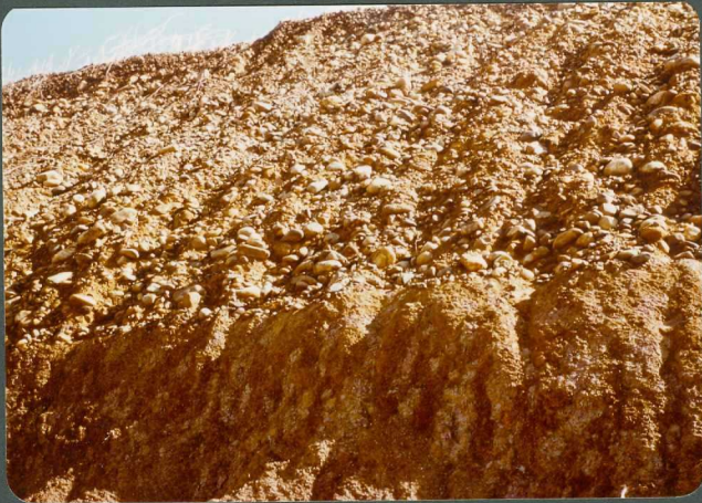
F.19: Depósitos de raña recubriendo fangos edafizados de la Facies de La Serna. Membrillar.