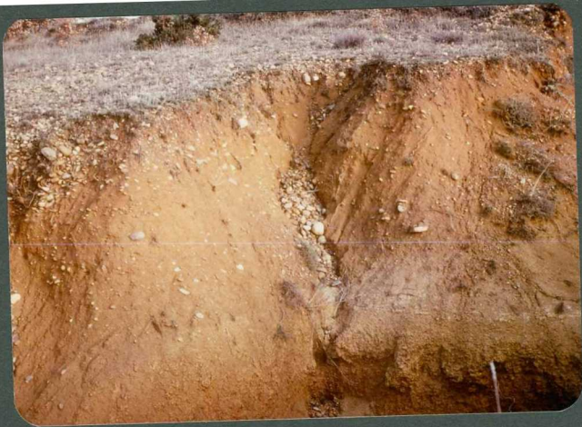
F.22: Depósitos arcillosos de vertiente. Villarquite del Páramo.