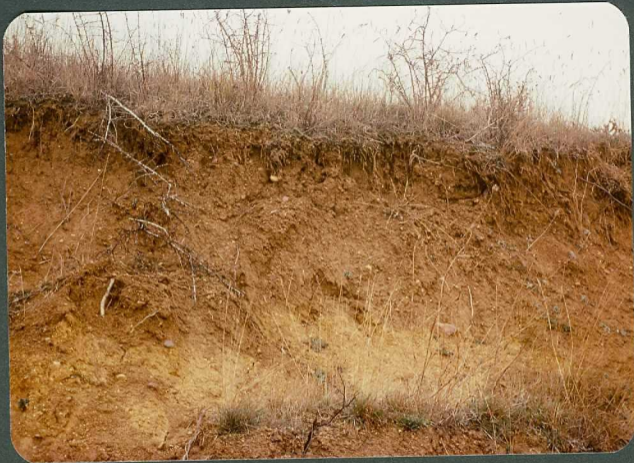
F.23: Suelo pardo calizo sobre fangos carbonatados de la Facies de la Serna. Buenavista de Valdavia.