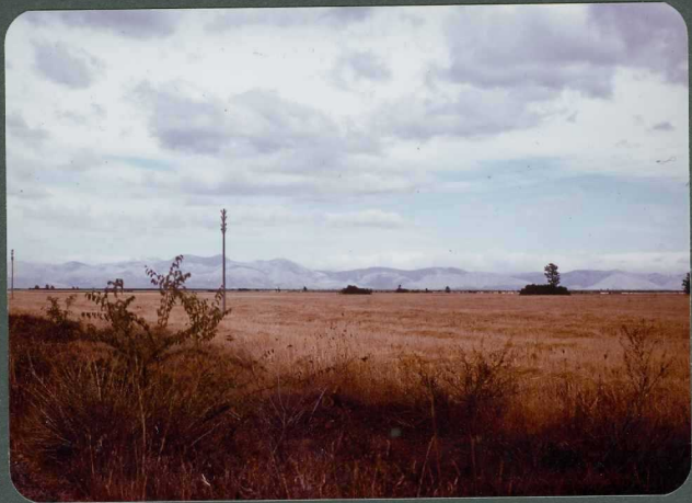
F.20: Superficie de la raña, con la cantábrica al fondo. Valcavadillo.