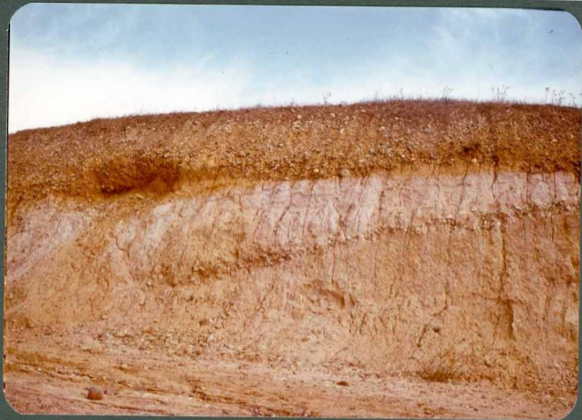
F.8: Canal de fango. Facies de la Serna. Membrillar.