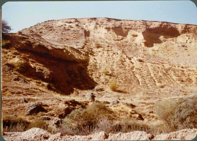
F.9: Paleocanales de conglomerados mixtos. Abanico de Aviñante, Buenavista de Valdavia.