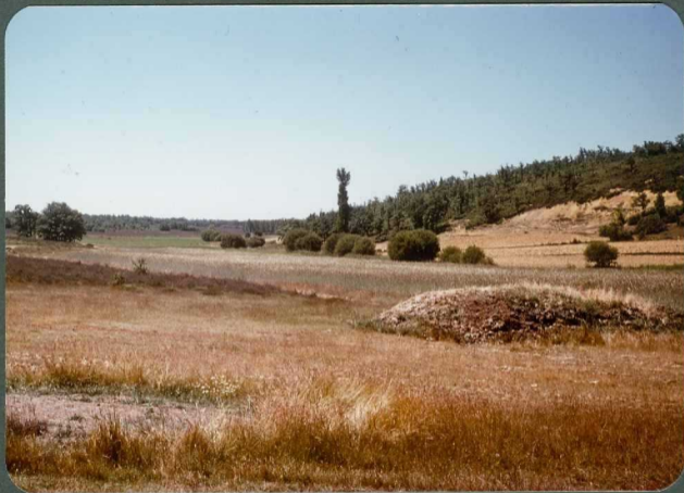
F.29: Valle disimétrico. Valles de Valdavia.