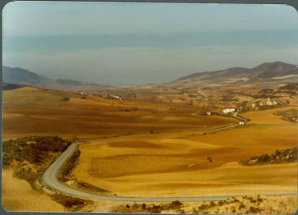
F.14.- Al fondo e izquierda, Paleoceno-Eoceno; en el centro serie terrigena roja (Oligoceno) y a la derecha, calizas de Minjancas con la serie amarilla a media ladera. (A la derecha, San Martín de Zar y al fondo Taravero).