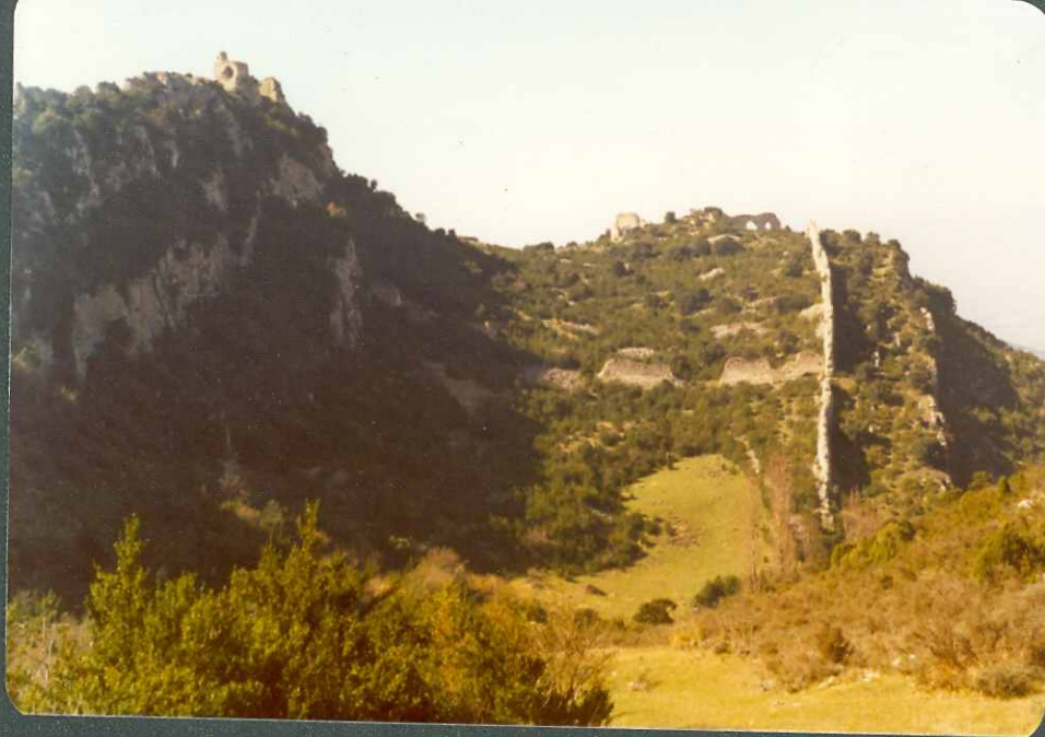
F.12.- Paleoceno-Eoceno subvertical de Portilla.