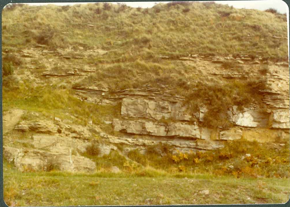
F. 3.- Caliza de Olárizu. Campaniense inferior-medio, tramo de margas y calizas en Olárizu.