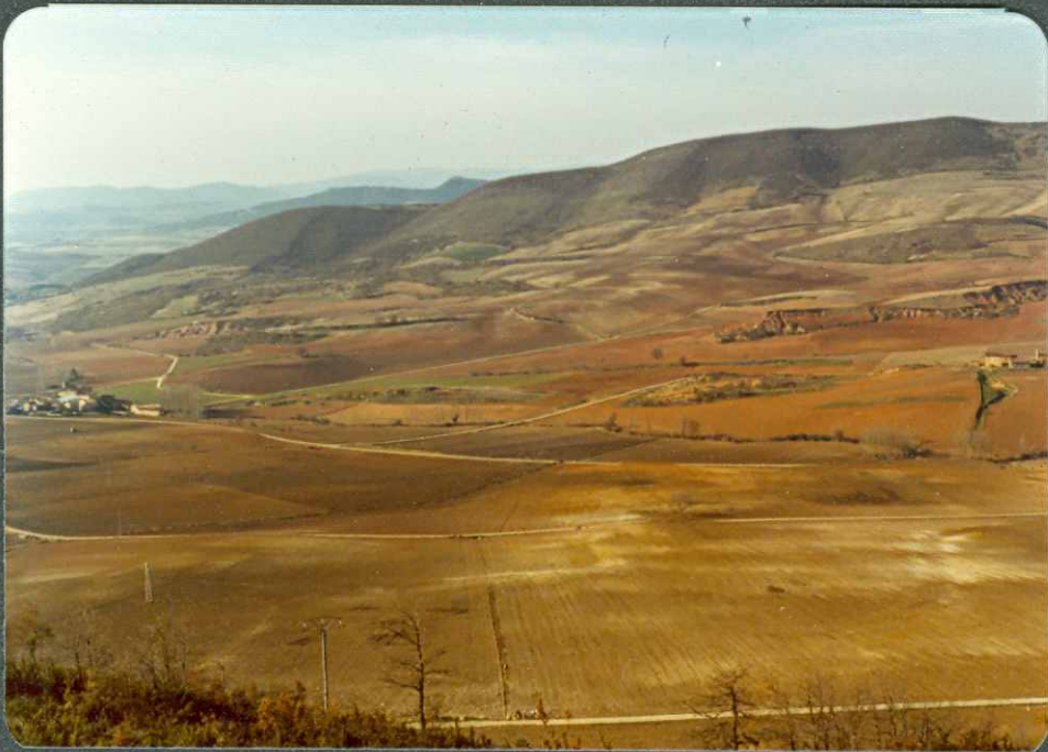
F.18.- Vista general del Terciario continental desde Tobera.