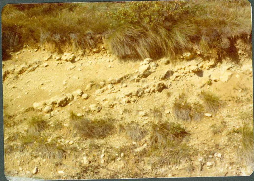
F. 2.- Campaniense inferior - medio. Tramo margoso; en Berros te guieta.