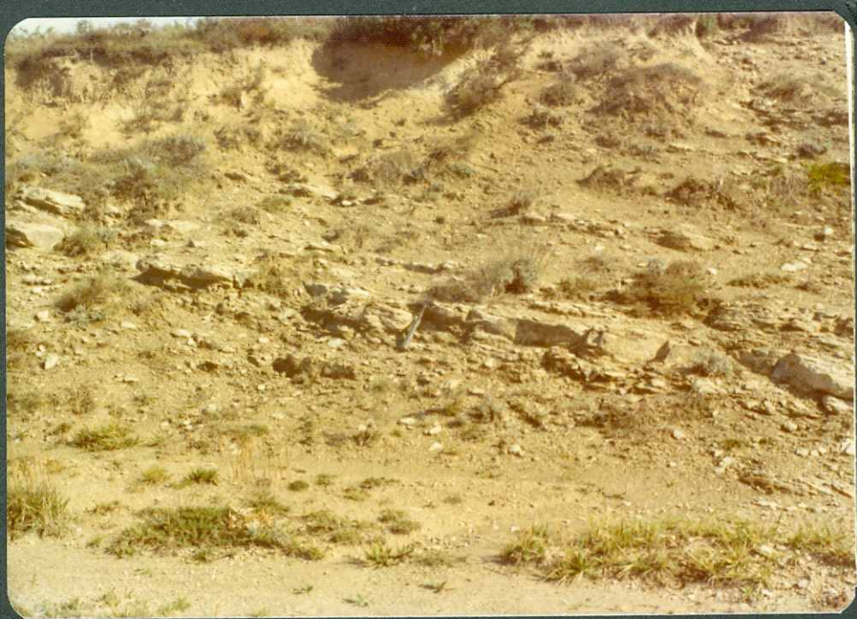
F. 1.- Santoniense medio-superior. Ariñez