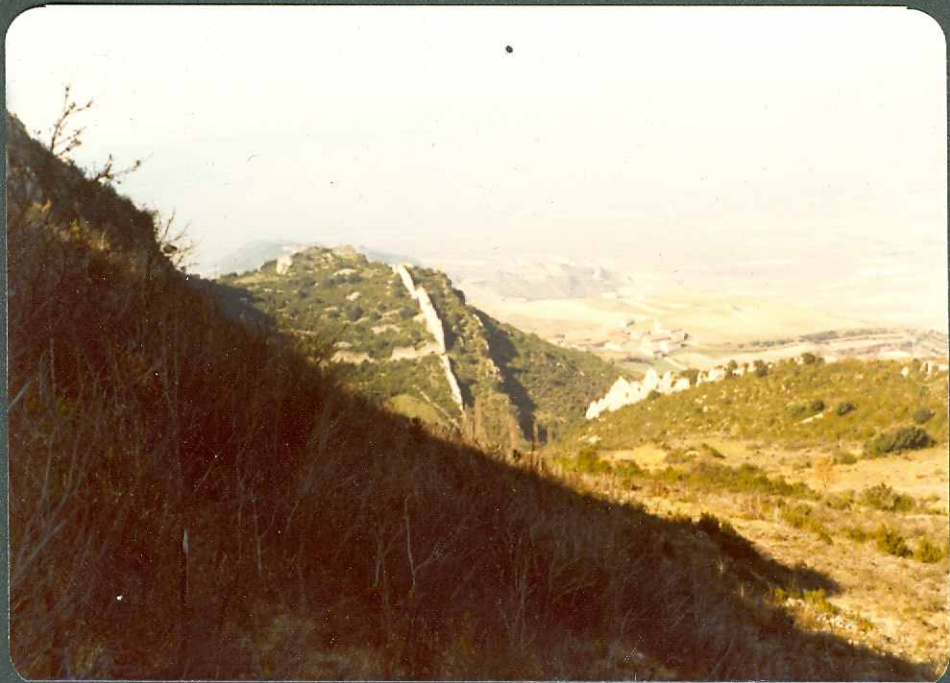
F.10.- Paleoceno-Eoceno subvertical de la zona de Portilla. A la derecha y al fondo Terciario continental de la Depresión Miranda-Treviño.