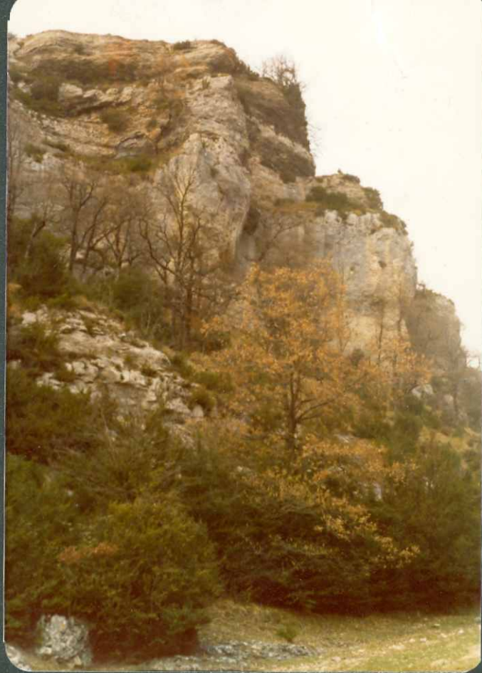
.13.- Calcarenita del Montiense-Thanetiense, al Norte de Ar lucea.