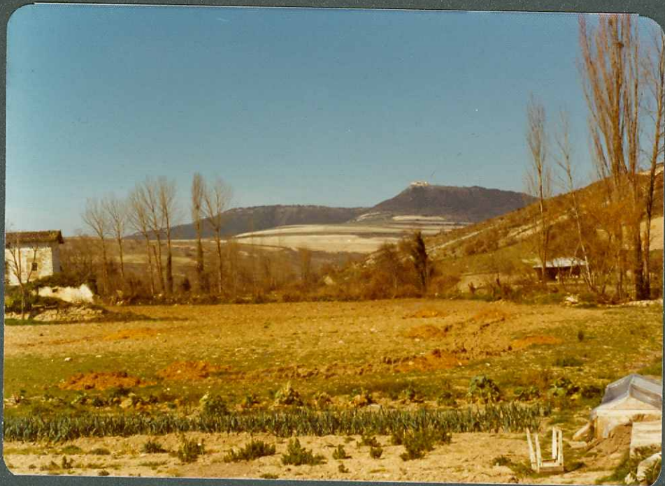
F.15.- Vista del Terciario continental desde Mijanca. Al fondo areniscas del sinclinal de Muergas; vista del Norte.