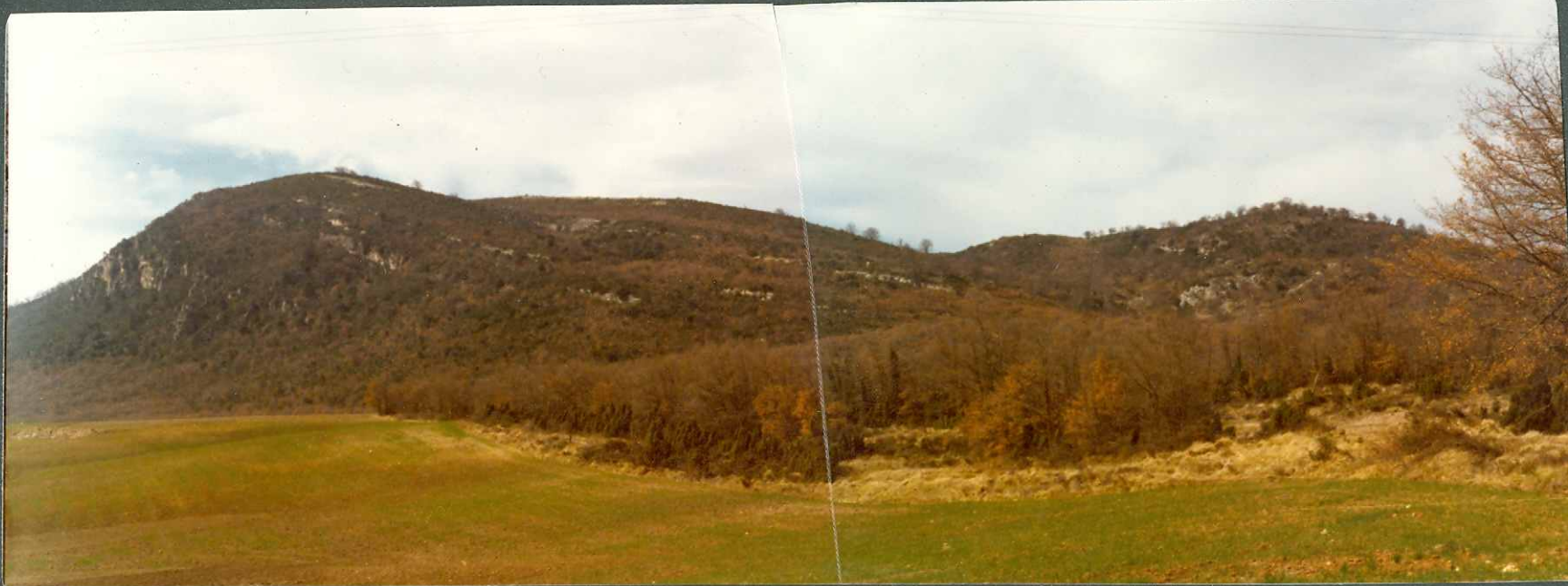
F.11.- Sinclinal Paleoceno-Eoceno inferior de Moraza.