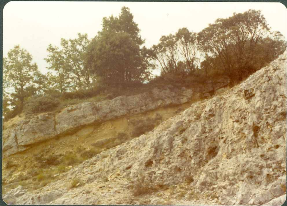
F. 7.- Niveles dolomíticos del Daniense, en Berrosteguieta.