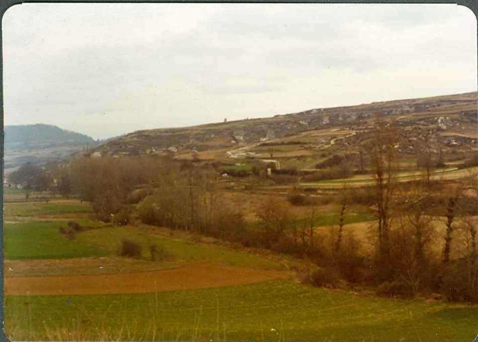
F. 9.- Dolomias del Daniense en Marquinez. Formas de erosión típicas.