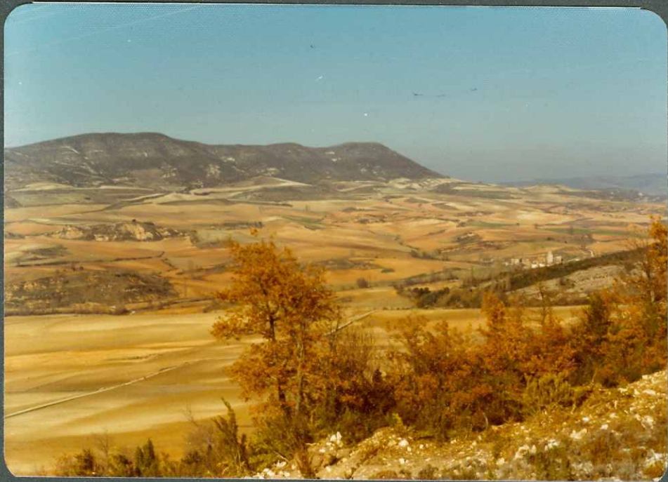
F.17.- Panorámica del Terciario continental desde Tobera.