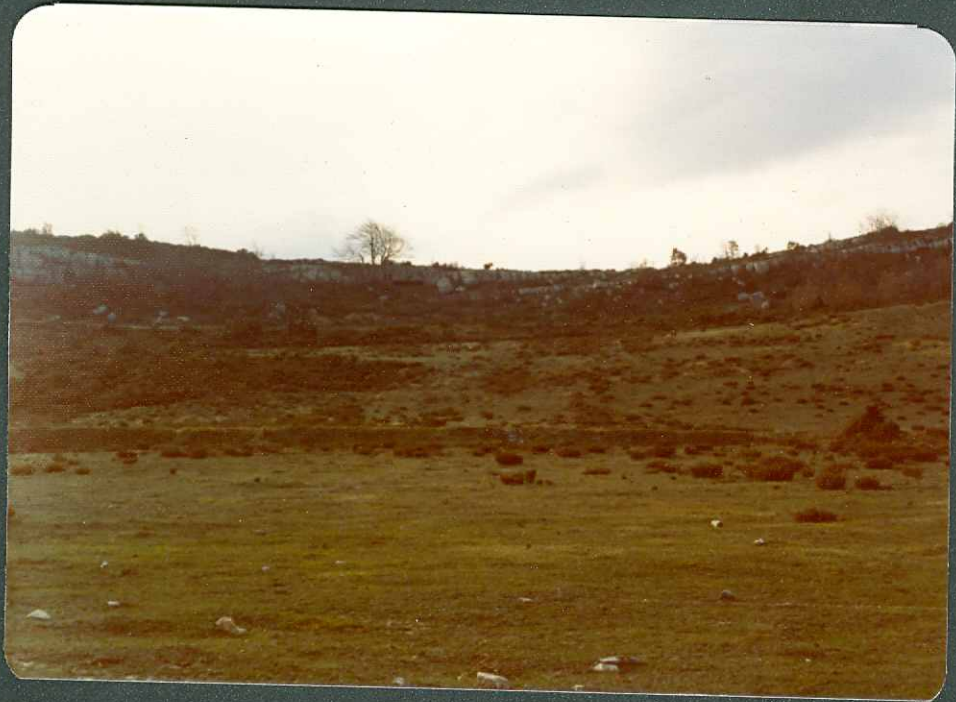
F.16.- Conglomerados del Terciario continental (arriba) y are nas margosas del Thanetiense 'al Norte de Arlucea.