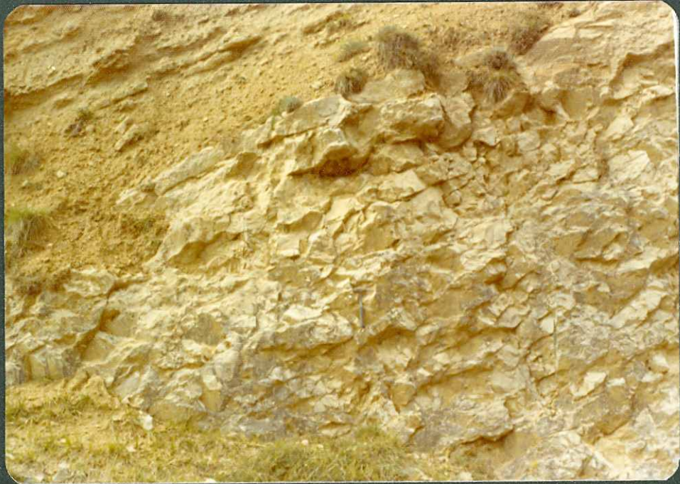
F. 5.- Bancos calizos del Maastrichtiense en Berrostequieta.