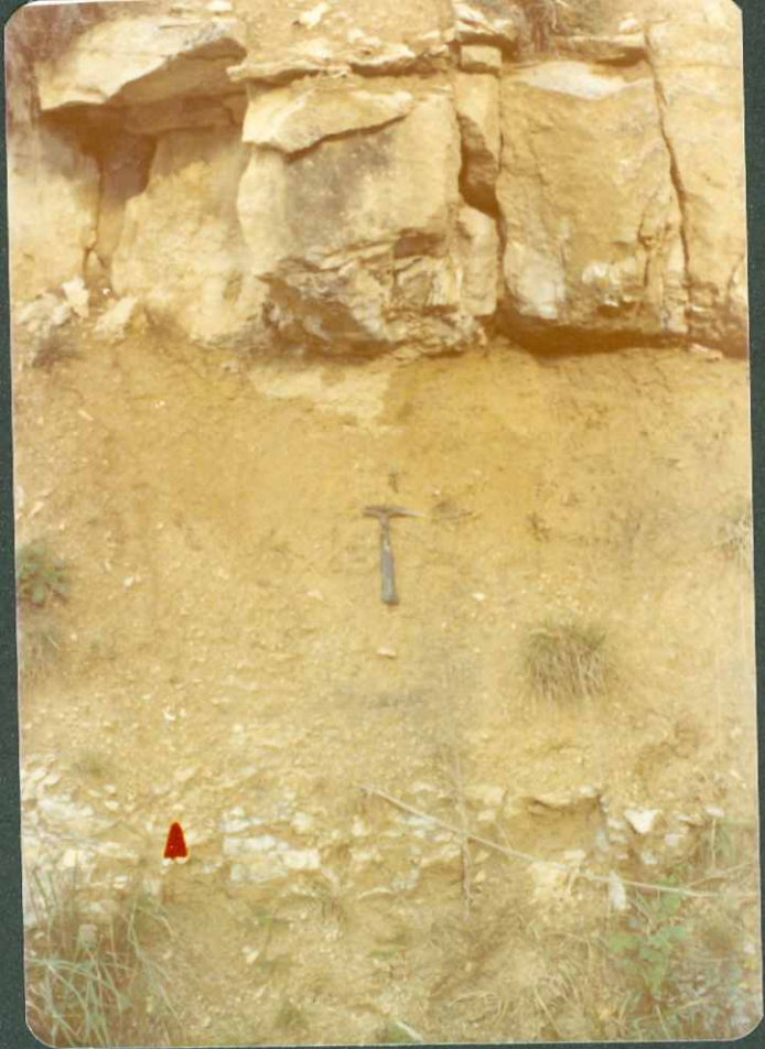
F. 6.- Tramo arenoso del Maastrichtiense, con Ostreidos, en Oquina.