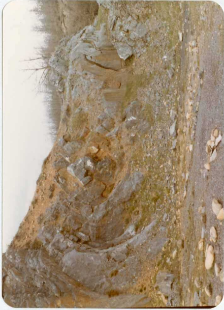
16-08-AD-AC-3003.- Pliegue en la Caliza de Montaña (H 1 Ba-B 1-21 )