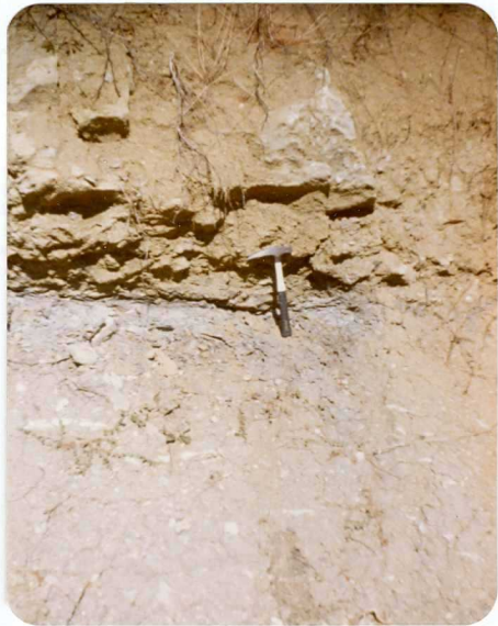
16-08-AD-AC-3009 . - Detalle de la serie de Transición ( C_{22-24} ) - del Cretácico con margas, limos y lentejones de areniscas del - Tramo inferior. Está invertido y en el muro aparece un estrato de caliza.