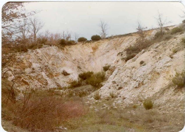
16-08-AD-AC-3001. - Aspecto de las areniscas y cuarcitas del Devónico superior en la Ctra. de Guardo a Velilla. (D 3 )