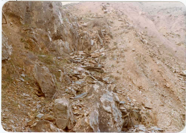
16-08-AD-AC-3005. .- Contacto entre la Caliza de Montaña y las pizarras del Westfaliense A-B ( H_{21}^B ).