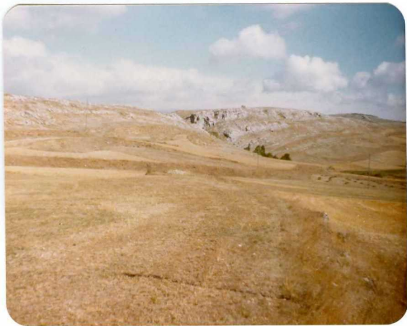
16-08-AD-AC-3010 . - Panorámica de las calizas del Cretácico (C 24-25 ), desde el S, en posición invertida.