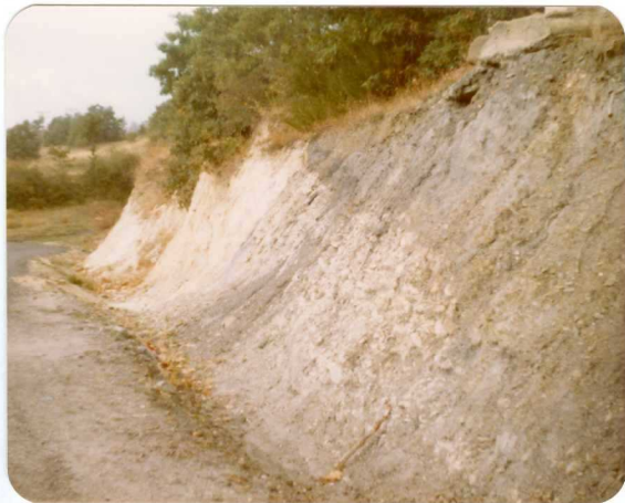
16-08-AD-AC-3008 . - Contacto en discordancia e invertido, entre el tramo Inferior cretácico (Utrillas) ( C_{16-22} ) y Tramo de la Choriza (Westfaliense D sup-Cantabriense). Foto tomada en la - Cra. de Aviñante al Santuario de la Virgen del Brezo.