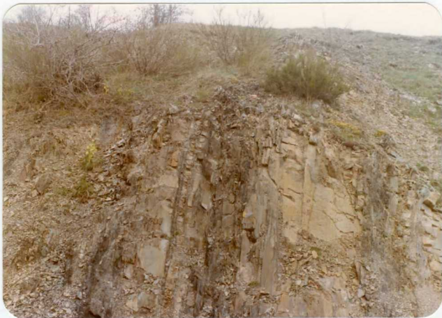
16-08-AD-AC-3006 . - Aspecto de las lutitas y areniscas de los tramos (Villafría-S. Pedrín-Villaverde) ( B3-B2 Hch 2 24-32 ), Cuenca de Prado-Guardo-Cervera.