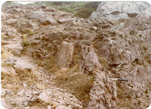
16-08- AD-AC-3002.- Aspecto de la caliza griotte de la F. Alba (H A 11-1 -Ba ).