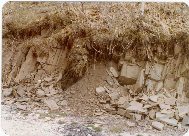
16-08-AD-AC-3007 .- Areniscas y lutitas de la Cuenca de Prado-Guardo-Cervera.