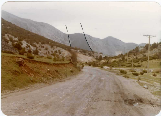
16-08-AD-AC-3000 . - Panorámica en la que se aprecian las areniscas del Devónico superior (oscuro) en contacto mecánico, entre la caliza de Montaña. Vertiente S del Domo del Valsurvio.