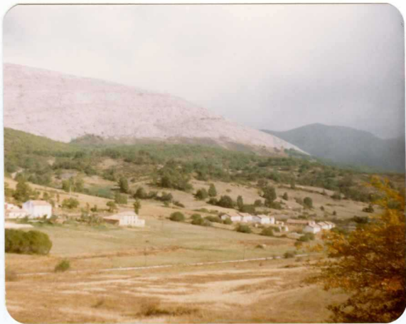
16-08-AD-AC-3004. - Vista panorámica de las Calizas de Montaña ( H_{1-21}^{Ba-B} ), en contacto mecánico con los materiales westfalienses de la Cuenca de Prado-Guardo-Cervera. Desde las casas hasta el observador, afloran los sedimentos cretácicos (Utrillas y Tramo de Transición).