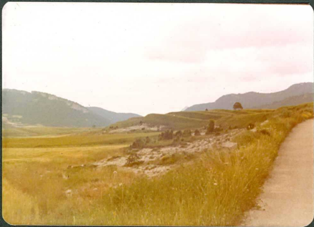
FOTO 12.- Margas con intercalaciones de calizas de la unidad C3-1 23-24.