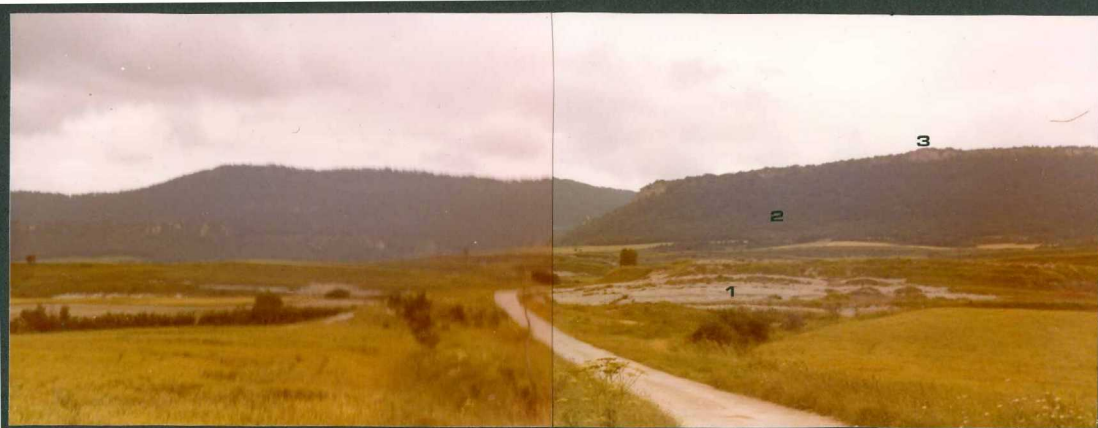
FOTO 16.- Panorámica: 1 - Margas con intercalaciones calizas ( C_{23-24}^{3-1} ). 2 - "Margas de Micraster" ( C_{24}^{1-2} ). 3 - Calizas de Lacazina ( C_{24}^{2-3} ).