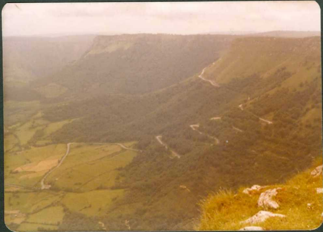
FOTO 3.- El puerto de Orduña sobre margas de la unidad C^{2-1}_{22-23} ; en la parte alta calizas del Coniaciense ( C^{2-3}_{23} ).