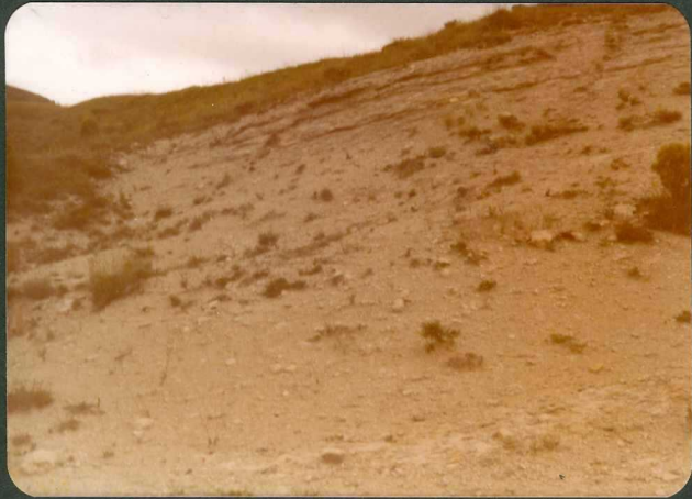
FOTO 4.- Margas de la unidad C_{22-23}^{2-1} al N. de la localidad de Archua.