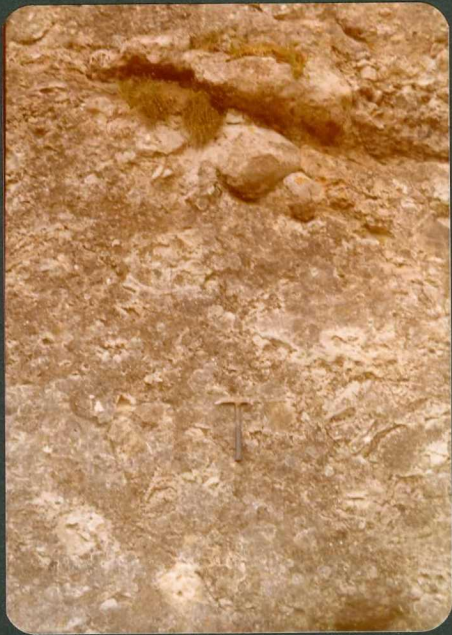
FOTO 27.- Conglomerados basales de la unidad Neogena ( T_C^B ) en la zona diapírica de Murguía.