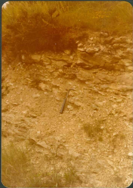
FOTOS 17 y 18.- Margas con intercalaciones de calizas nodulosas de la unidad C 1-2 25 al Sur de Caranca.