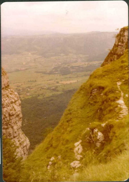
FOTO 6.- Area diapírica de Orduña; En primer plano calizas - coniacienses (C 2-3 ). 23