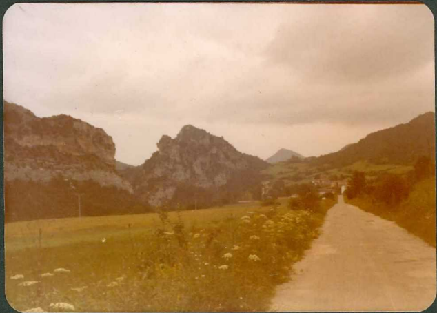
FOTO 8.- Calizas de la unidad C 2-1 23-24 en posición subvertical en San Zadornil.