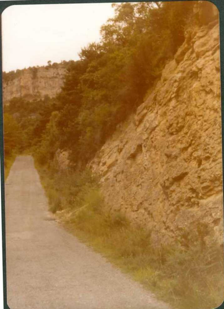
FOTO 19.- Areniscas microcon glomeráticas del - Campaniense Supe-- rior; al fondo ca- lizas del Maastrichtiense.