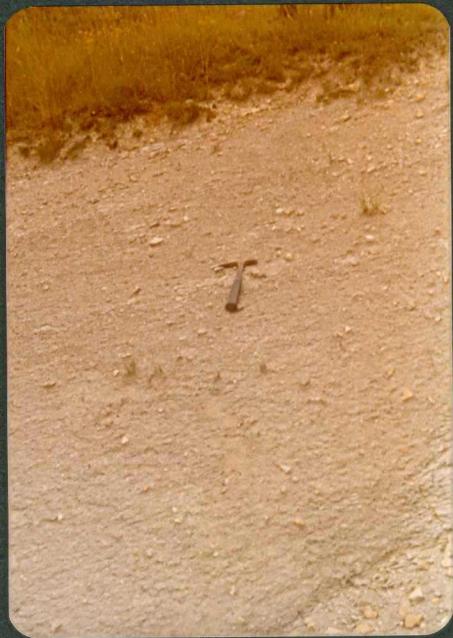
FOTO 13.- Margas de la unidad C 3-1 23-24 .