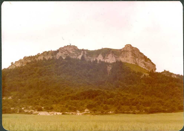
FOTO 15.- Calizas de Lacazina ( C_{24}^{2-3} ) al SE de la localidad - de Cárcamo.