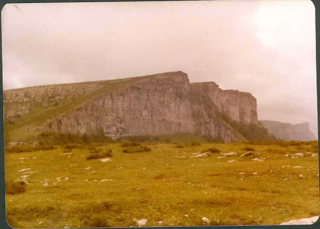
FOTO 7.- "Cejo" de calizas Coniacienses al Oeste de la Virgen de la Peña.