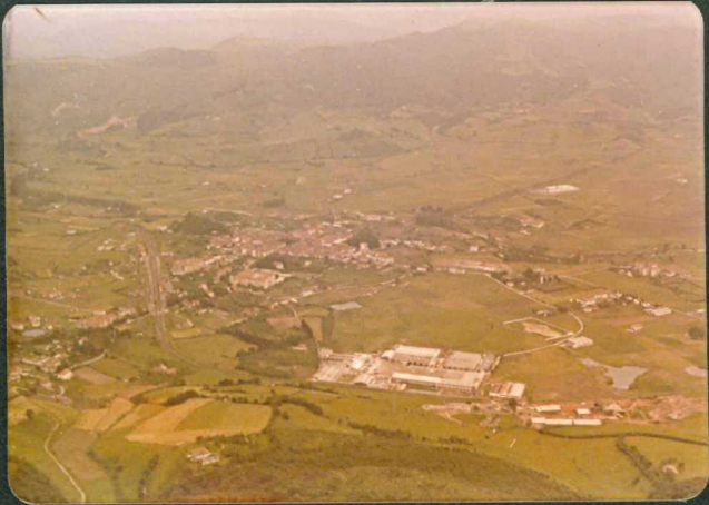
FOTO 1.- Zona diapfrica de Orduña desde la Virgen de la Peña.