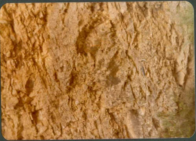
FOTO 20.- Areniscas microcon glomeráticas de la unidad C 3 25 .