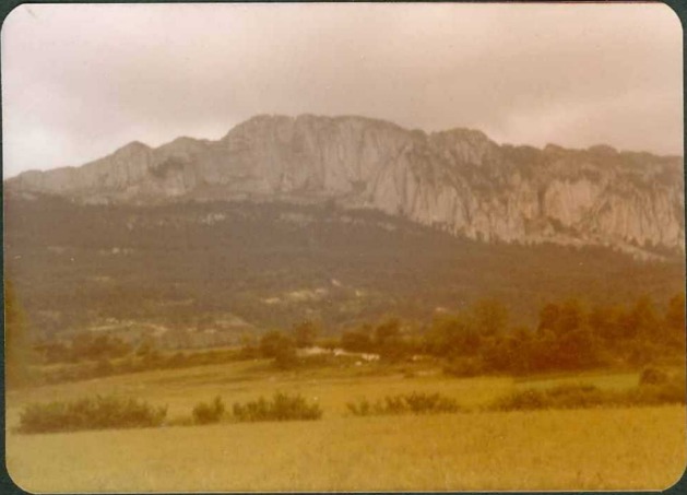
FOTOS 9 y 10.- Calizas de la unidad C 2-1 23-24 en el flanco N. - del anticlinal de Lahoz (angulo SO de la hoja).