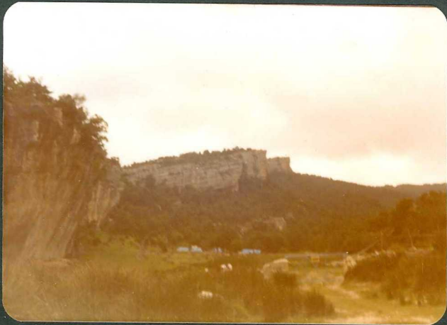
FOTOS 21 y 22.- "Cejo" de dolomias del Paleoceno al N. de Vi llanueva de Valdegovia.