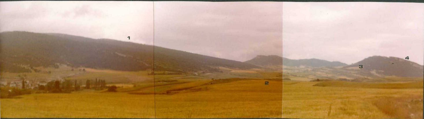
FOTO 11.- Panorámica: 1 - Calizas coniacienses ( C_{23}^{2-3} ). 2 - Margas con intercalaciones de calizas de la unidad C_{23-24}^{3-1} . 3 - Margas del Santoniense ( C_{24}^{1-2} ). 4 - Ca- lizas de Lacazina ( C_{24}^{2-3} ).