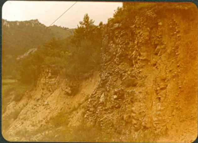
FOTO 26.- Conglomerados miocenos subverticales en San Zadornil.