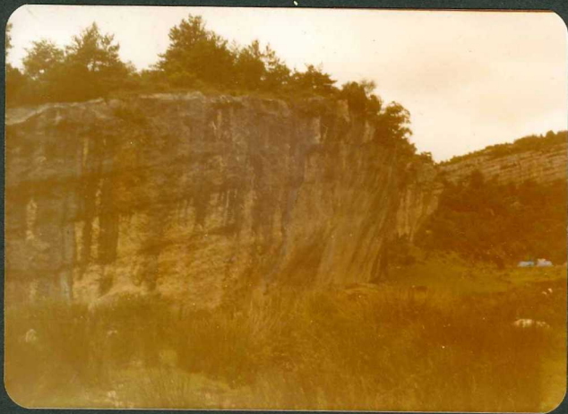
FOTOS 21 y 22.- "Cejo" de dolomias del Paleoceno al N. de Vi- llanueva de Valdegovia.