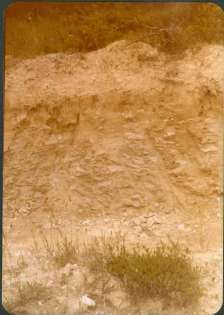
FOTO 14.- "Margas de Micraster" ( C_{24}^{1-2} ) entre las localidades de Astulez y Caranca.