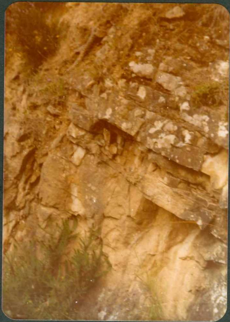
FOTO 2.- Areniscas del Albiense ( C_{16-21}^{a-1} ) en la carretera de Vi toria a Ramales.