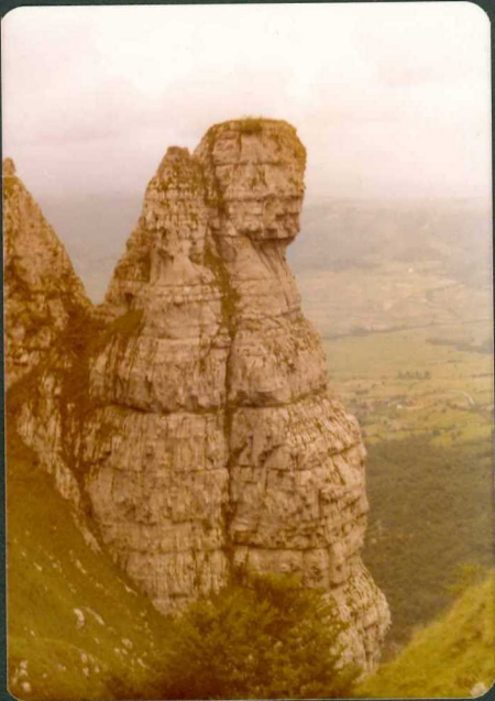
FOTO 5.- Pico del fraile,- Calizas del Conia ciense (C 2-3 ). 23