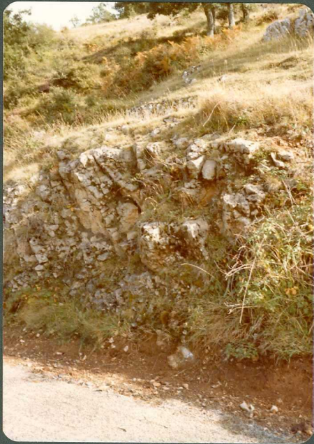
FOTO 9.- Calcarenitas cenomanienses.