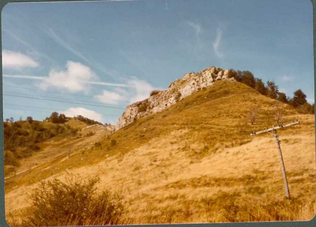
FOTO 10.- Creston de calcarenitas cenomanienses al SO de la localidad de Torres de Arriba.