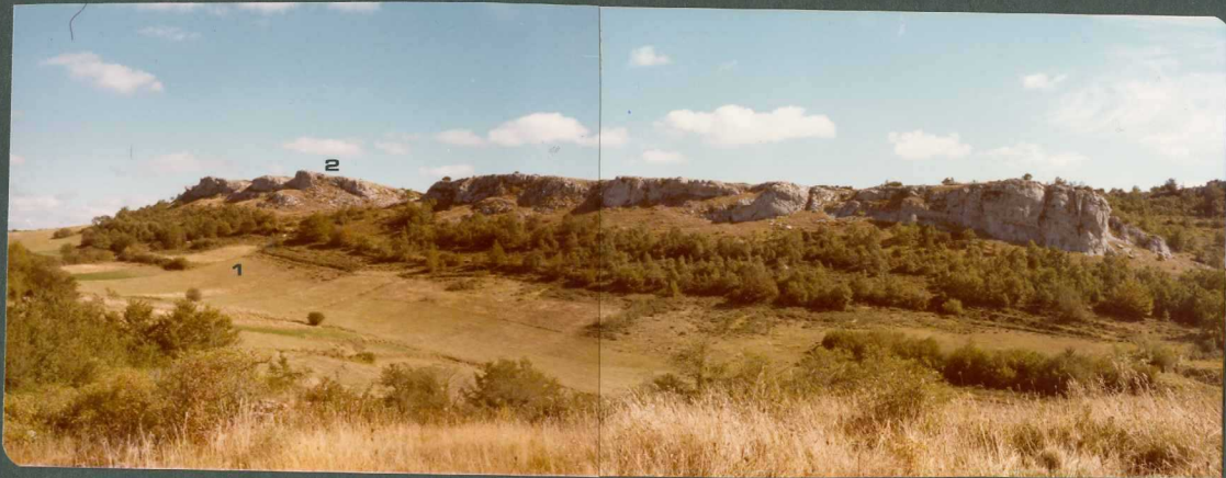
FOTO 12.- Panorámica entre las localidades de Torres de Arre- ba y Torres de Abajo: 1 - Margas de la unidad C 0-1 22-23 2 - Calizas y calizas arcillosas de la unidad --- C 2-1 22-24°