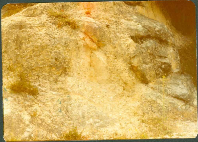
FOTO 3.- Conglomerados silíceos de la fâcies Weald en la estruc tura de Zamanzas.