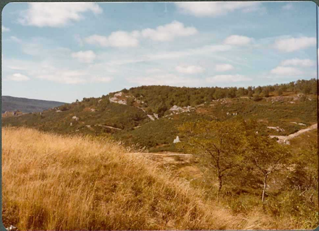
FOTO 11.- Calizas de la unidad C 2-1 22-24 en la localidad de Torres Arriba.