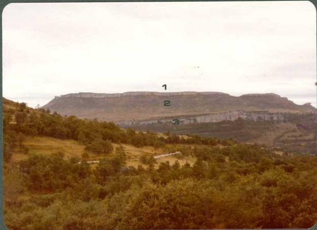
FOTO 17.- Panorámica del Cretácico Superior al Este de Argomedo: 1 - Caliza de Lacazina. 2 - Margas del Santo niense inferior. 3 - Calizas de la unidad C^{2-1}_{22-24} .