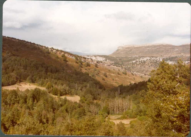
FOTO 16.- Cierre del Sinclinal de Villarcayo al Este de San - Martín de las Hoyas.