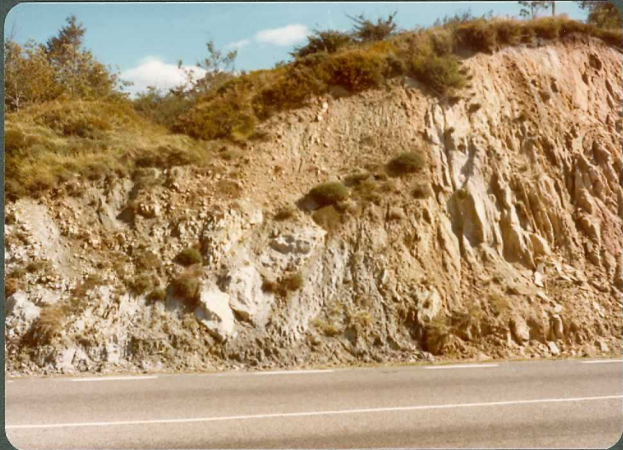
FOTO 8.- Falla del puerto de Carrales: 1 - Arenas del Albiense 2 - Margas y calizas Turonienses.