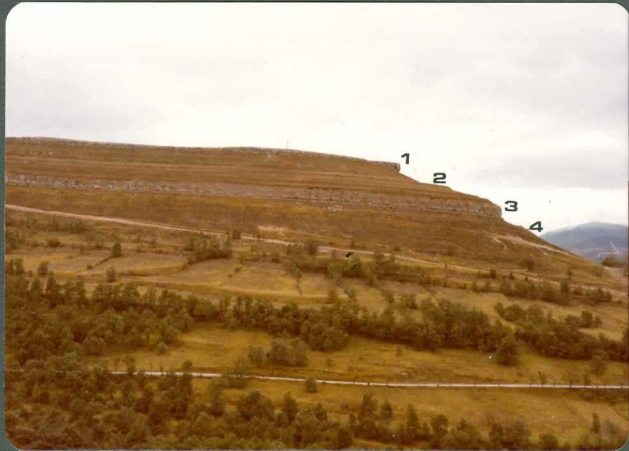
FOTO 15.- El Cretácico superior al N. de la localidad de Argomedo: 1 - Calizas de Lacazina. 2 - Margas de la unidad C_{24}^{1-2} . 3 - Calizas de la unidad C_{22-24}^{2-1} . 4 - Calizas y margas de la unidad C_{22-23}^{0-1} .