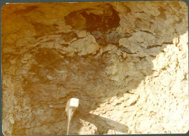
FOTO 19.- Margas del Santoniense superior y Campaniense con núcleos húmicos y restos carbonosos.