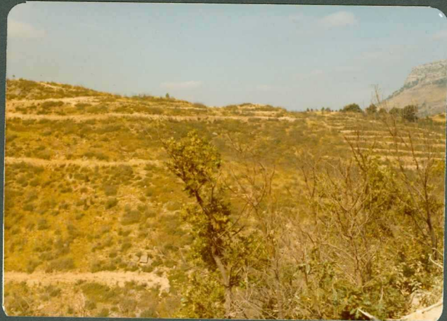
FOTO 2.- Valle de Zamanzas. En primer plano areniscas de la - facies Weald.