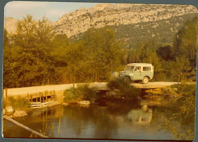
FOTO 14.- Estructura de Zamanzas cortada por el río Ebro. Al fondo calizas de la unidad C2-1 22-24