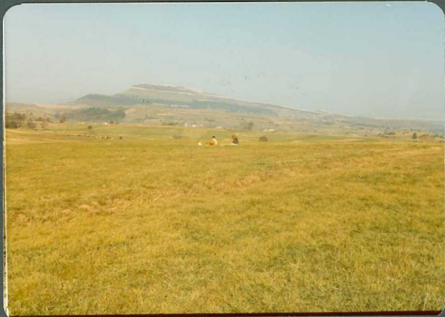
FOTO 1.- Zona diapírica de Virtus