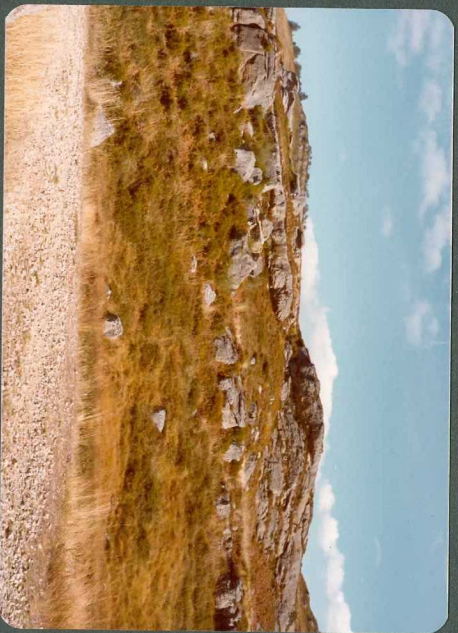
FOTO 6.- Areniscas arenas y arcillas de la unidad C 1-1 15-21