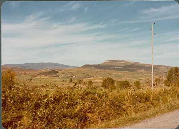
FOTO 18.- Morfología de crestas en el Cretácico superior al Norte de Castrillo de Bezana.