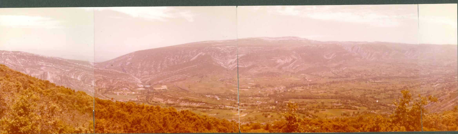
FOTO 20.- Panorámica del Sinclinal de Valdivielso: Cretácico superior, Paleoceno, Eoceno marino y Terciario con tinenta.