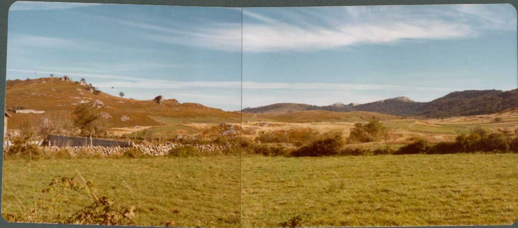
FOTO 7.- Panorámica: A la izquierda areniscas y conglomerados de la unidad C 1-1 15-21 a la derecha Cretácico Superior del puerto de Carrales.