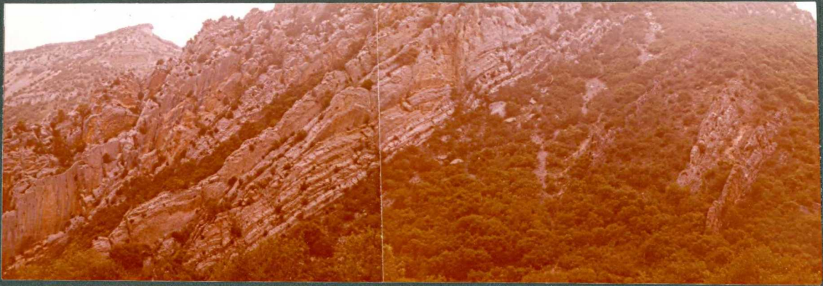
FOTO 13.- Flanco Sur cabalgante en el anticlinal de Zamanzas.