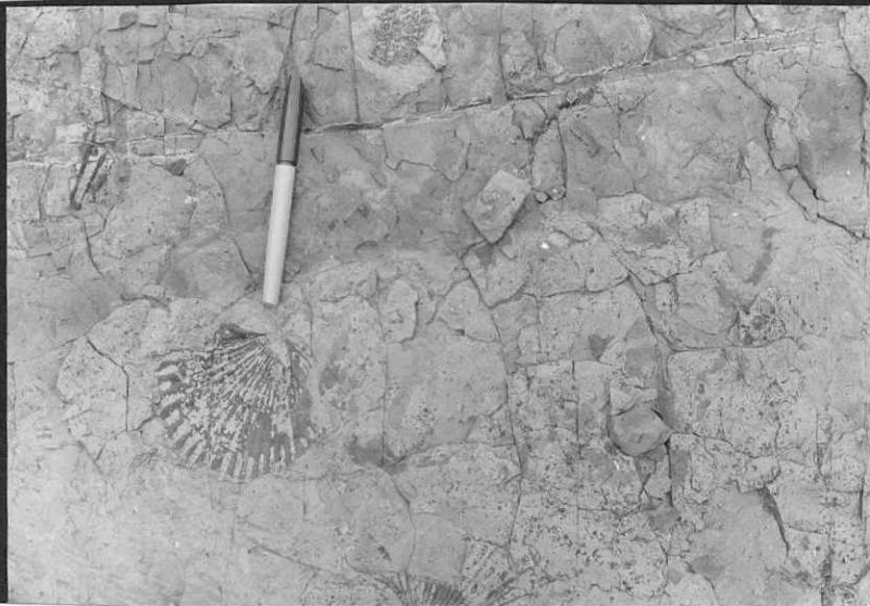
FC - 0904 - Nivel de Pectínidos en margas calcáreas del Pliensbachense (San Miguel de Aguayo).