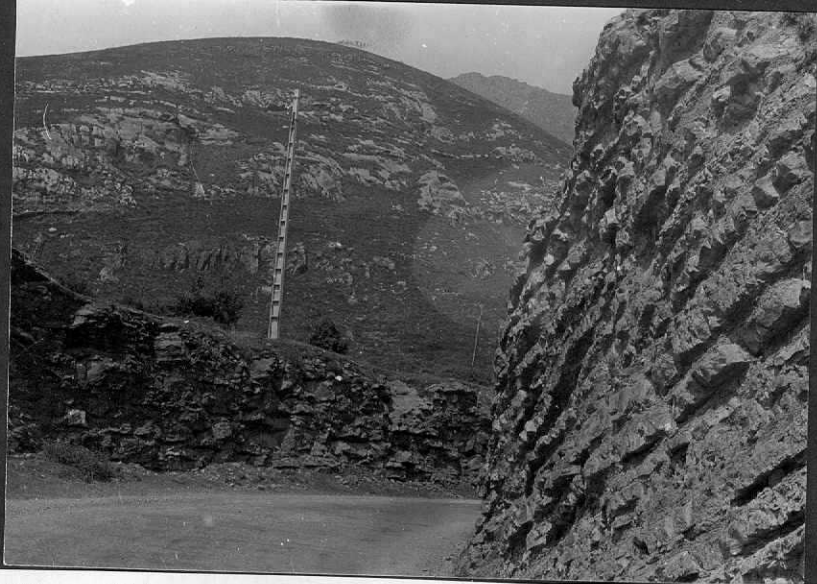
FC. - 0903 - Alternancia de calizas margosas y margas hojosas del Bajociense. (San Miguel de A guayo).