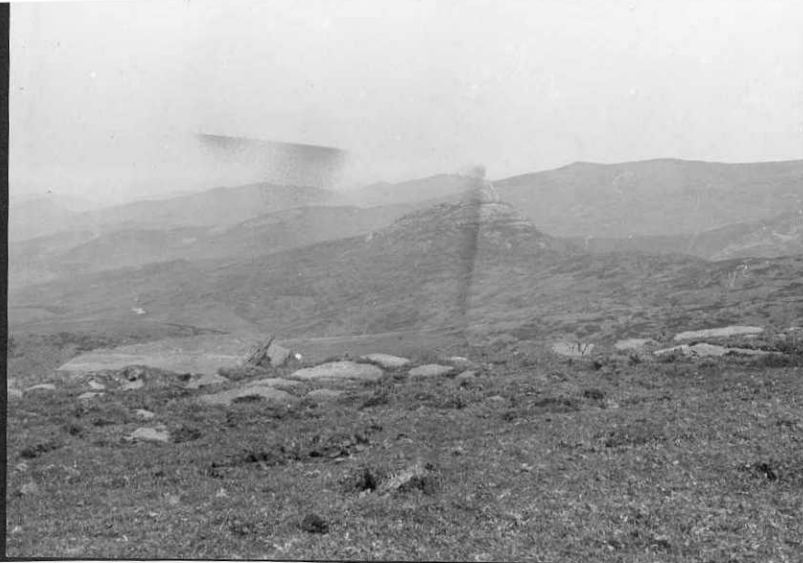
FC - 0902 - Cabalgamiento del Permotrias, en primer plano sobre Cretácico inferior (Pantano de Alsa. )