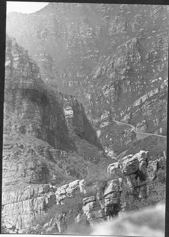
FC- 0900- Permotrias. Cabalgamiento del Rio Besaya. (Bárcena - Pié de Concha)